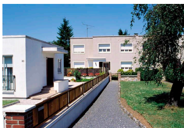
Vue générale du n° 78. IVR31_19945901174ZA