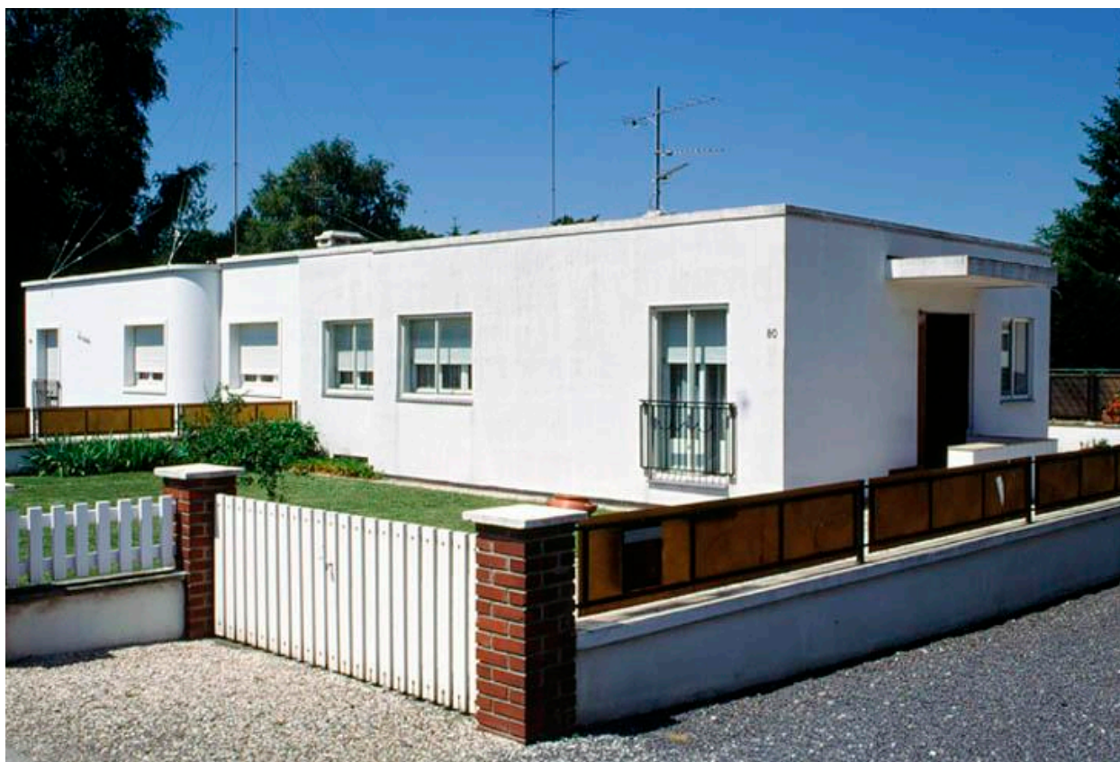
Vue générale d'un module de maison situé 80 route de Valenciennes.