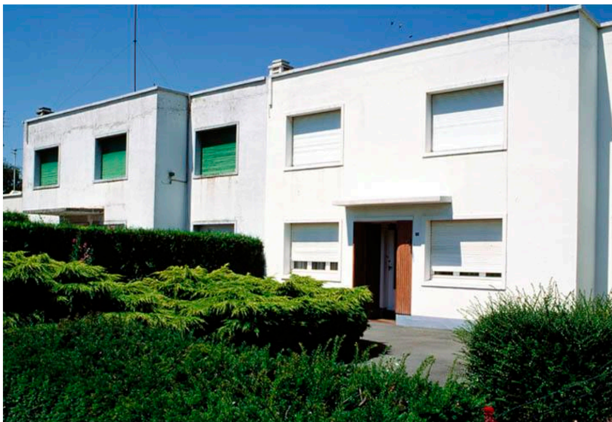
Vue générale du n° 70.