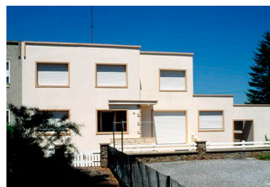
Vue générale d'un logement, n° 84. IVR31_19945901179ZA