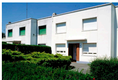
Vue générale du n° 70. IVR31_19945901172ZA