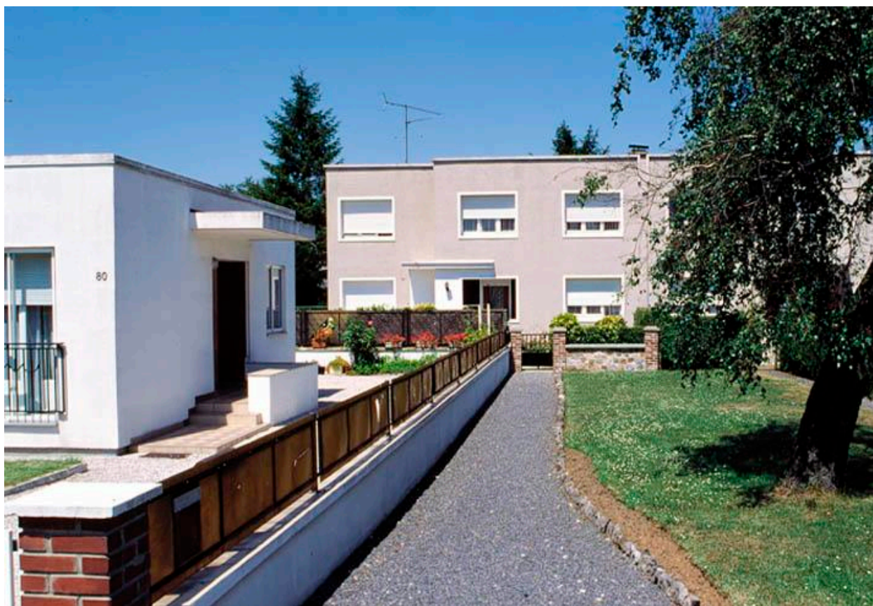
Vue générale du n° 78.