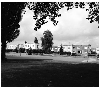
Vue partielle de l'alignement. IVR31_20025902038X