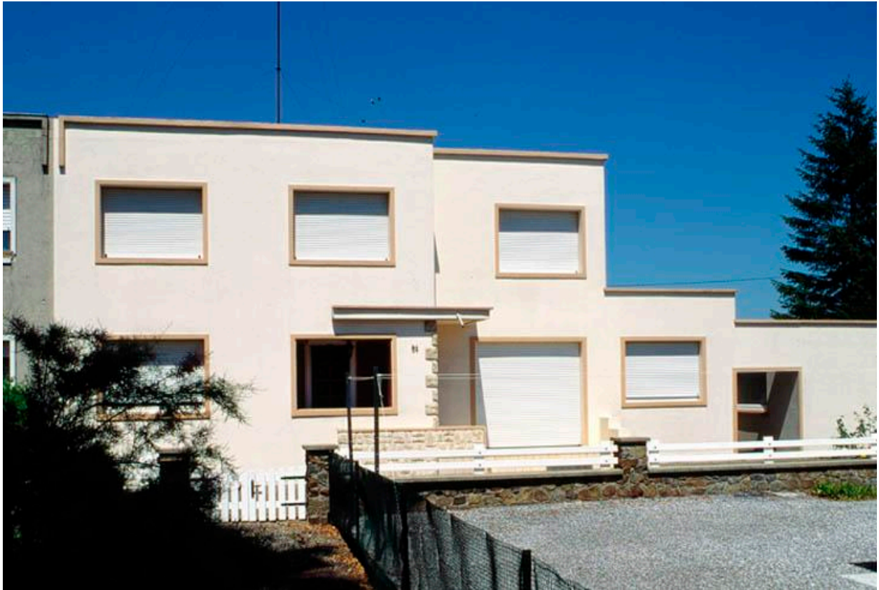
Vue générale d'un logement, n° 84.