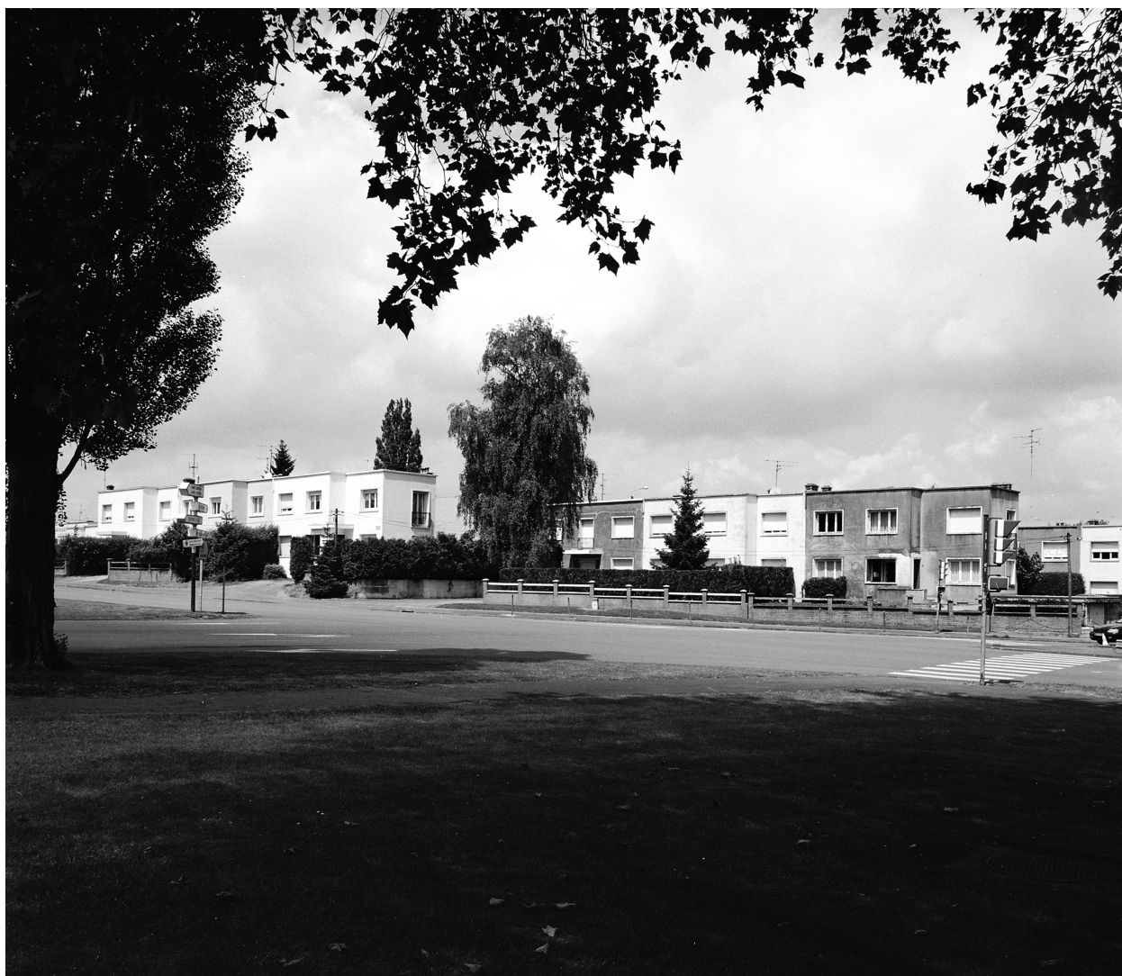
Vue partielle de l'alignement.