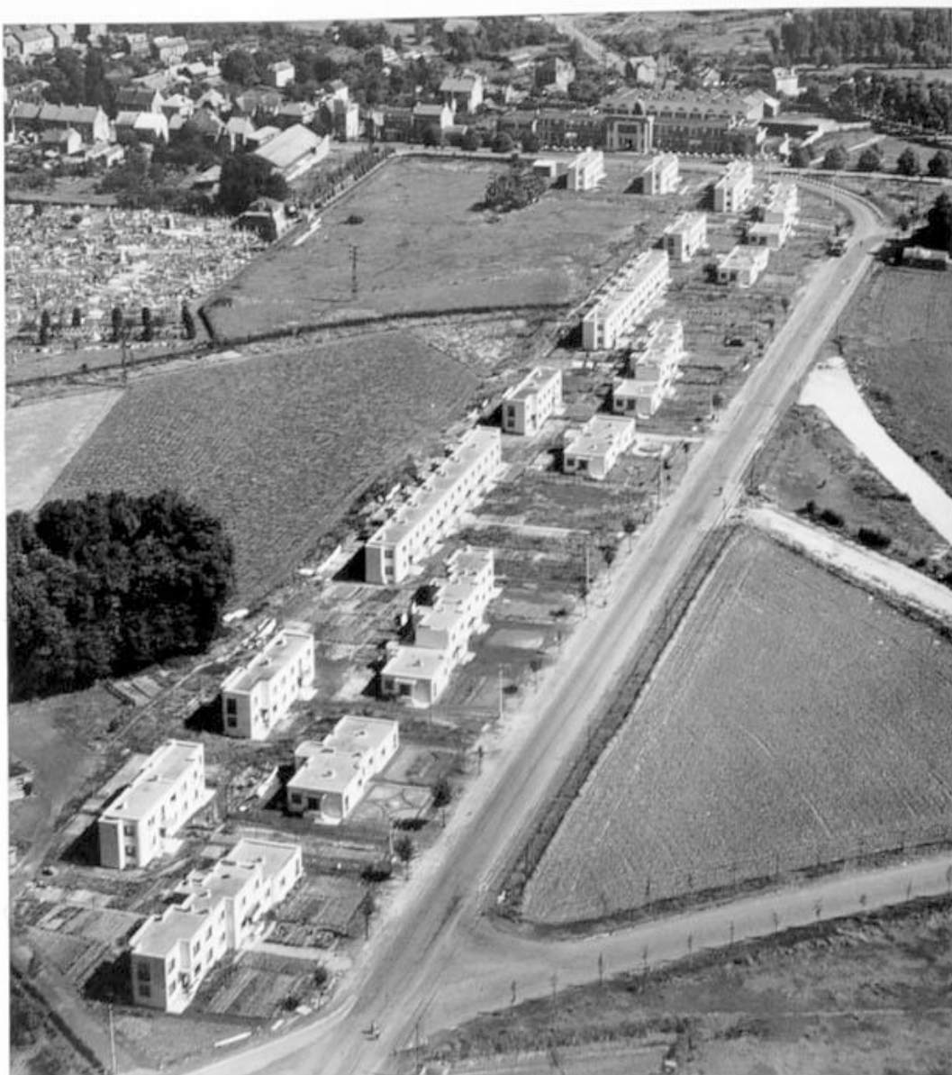
144. Reconstruction de Maubeuge, maisons individuelles, route de Valenciennes, 1947. Vue aérienne (la composition sur 2 épaisseurs).

Vue aérienne des I.D.T. (Immeubles à Destination Transitoire), route de Valenciennes, Y. Guillemaut photographe, 1947 (Archives Cité de l'Architecture, fonds André Lurçat). Dans : JOLY Robert, JOLY Pierre. L'architecte André Lurçat . Paris, Picard, 1995, p. 158.