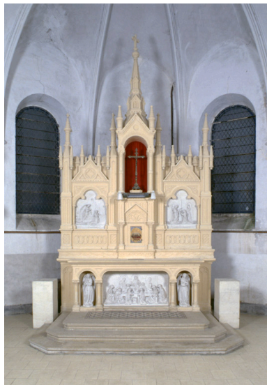
Vue générale. IVR22_19930201145ZA