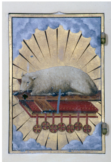
Porte du tabernacle : Agneau mystique sur le livre aux sept sceaux.