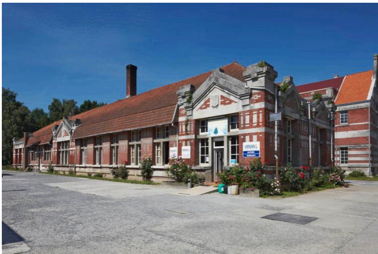
Vue générale des ateliers.