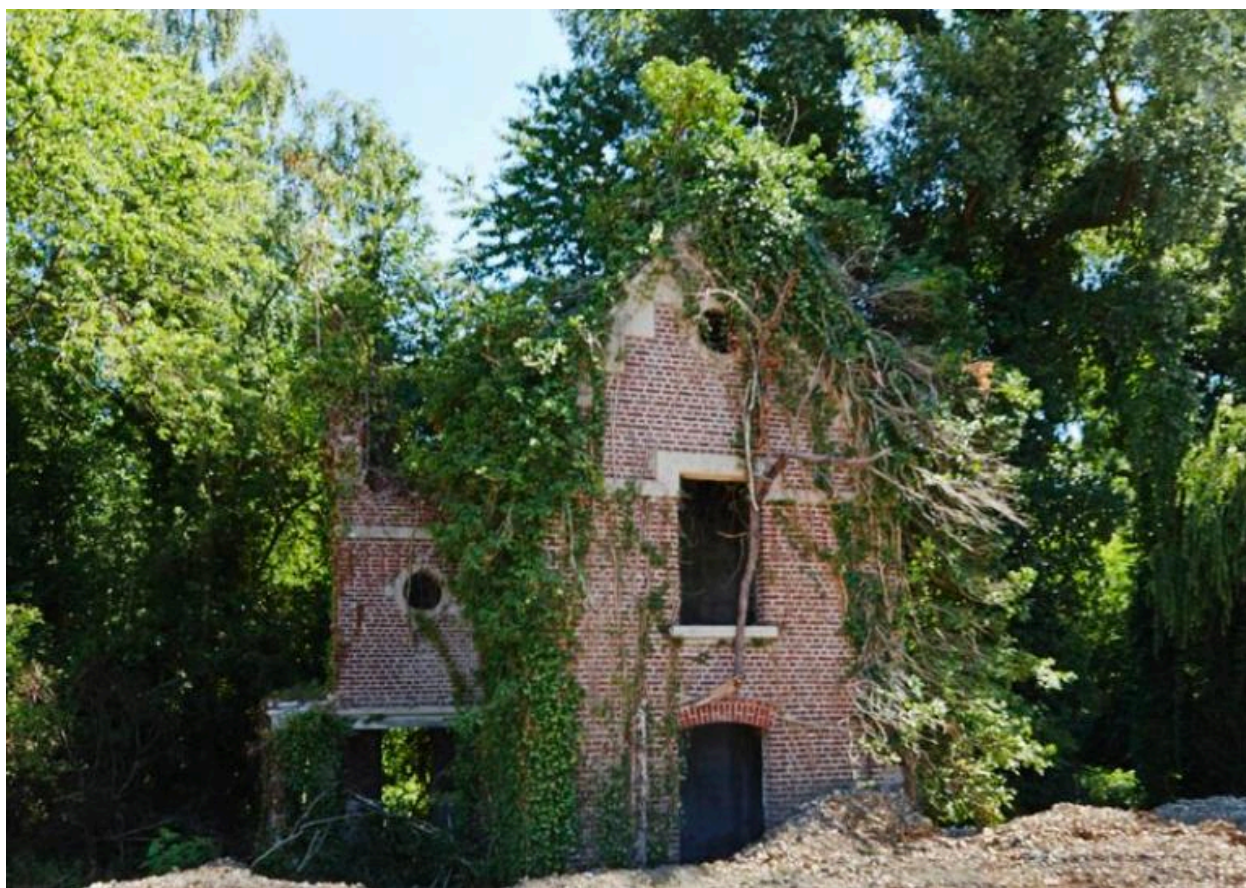
Ancienne maison de gardien de l'usine Kuhlmann.