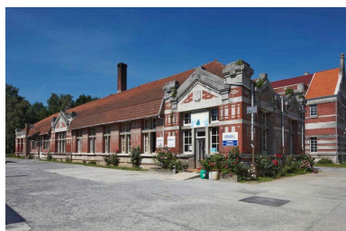
Vue générale des ateliers.