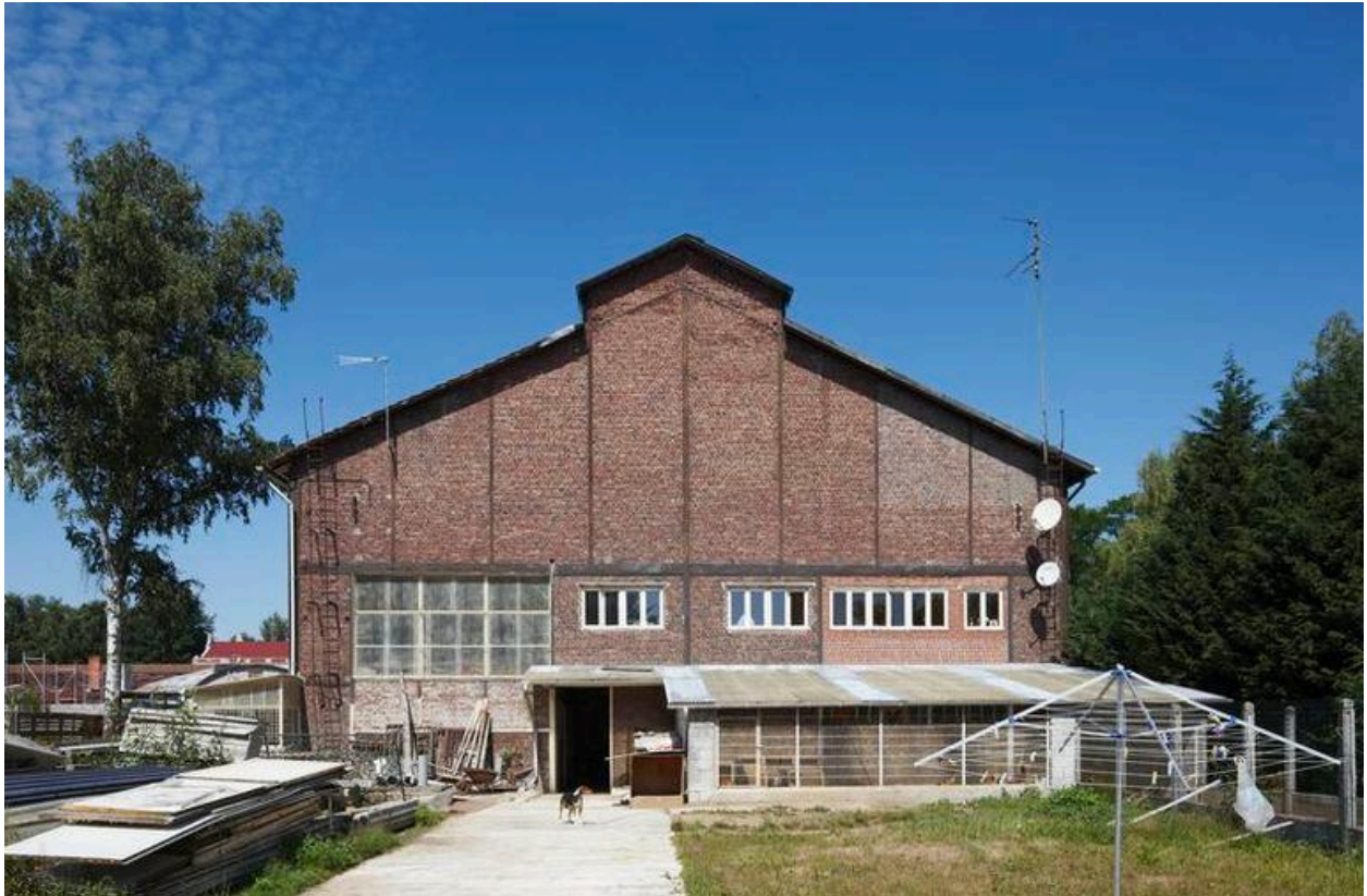
Seule halle de fabrication conservée de l'usine.