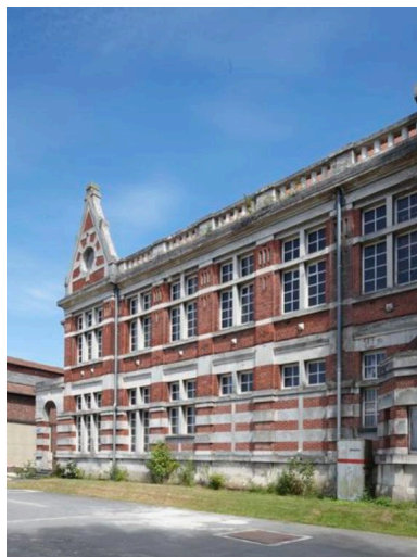
Vue partielle des bureaux, élévation antérieure.