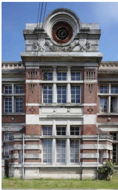
Vue générale de la travée centrale de l'élévation antérieure des bureaux.