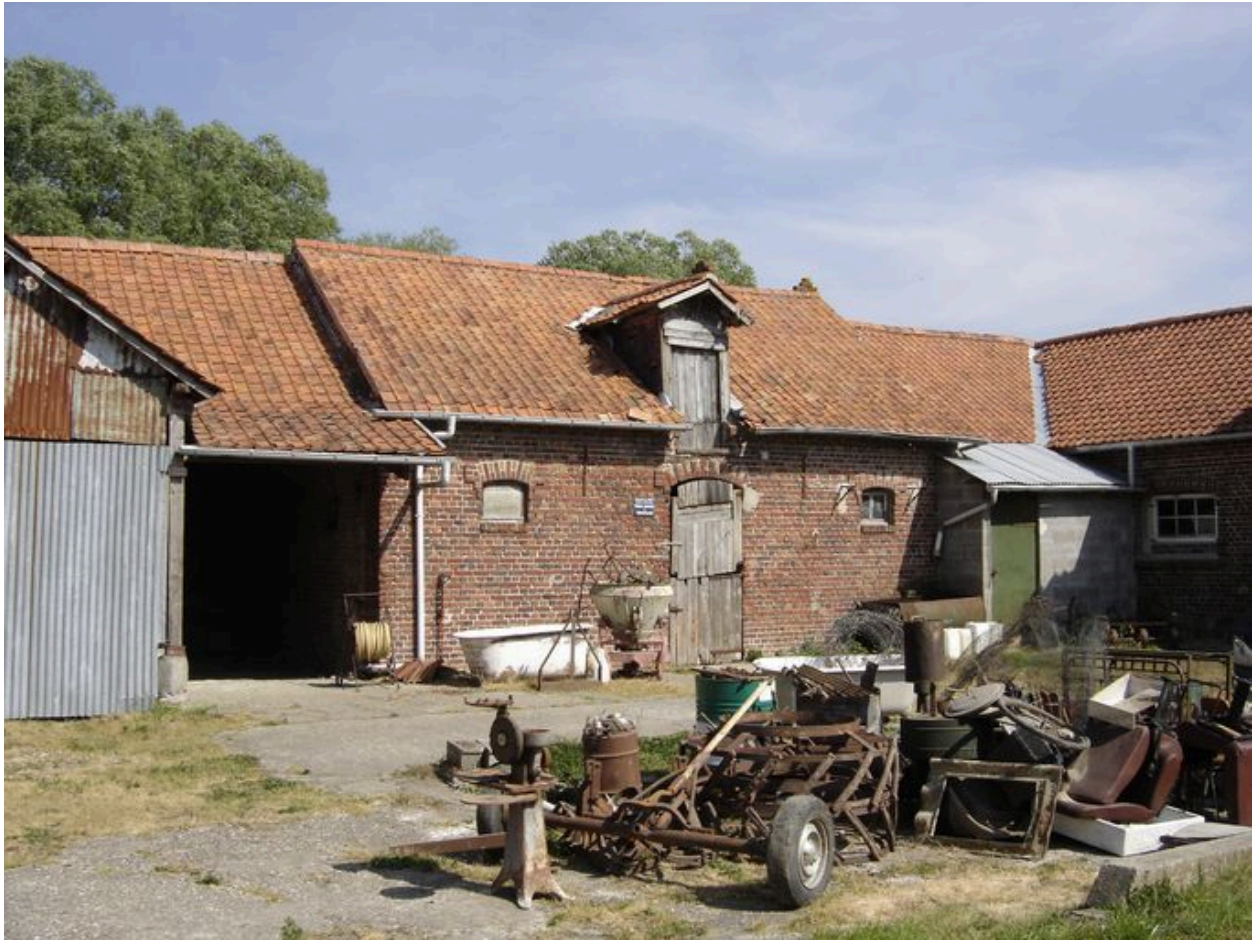
Vue des étables à l'est de la cour.