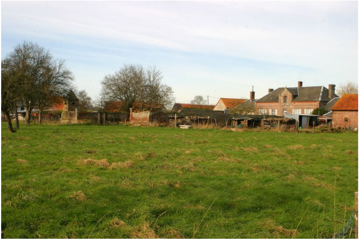
Vue générale depuis le sud.