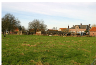
Vue générale depuis le sud. IVR22_20078000136NUCA