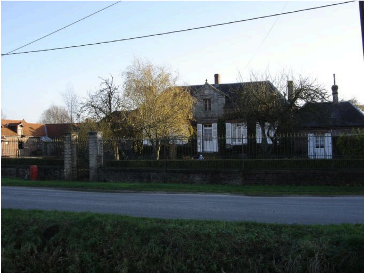
Vue d'ensemble de la façade du logis.