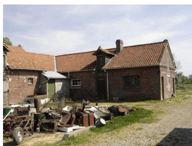
Vue des étables au sud-est de cour. IVR22_20078005959NUCA