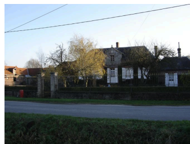
Vue d'ensemble de la façade du logis. IVR22_20048001051NUCA