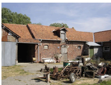
Vue des étables à l'est de la cour.