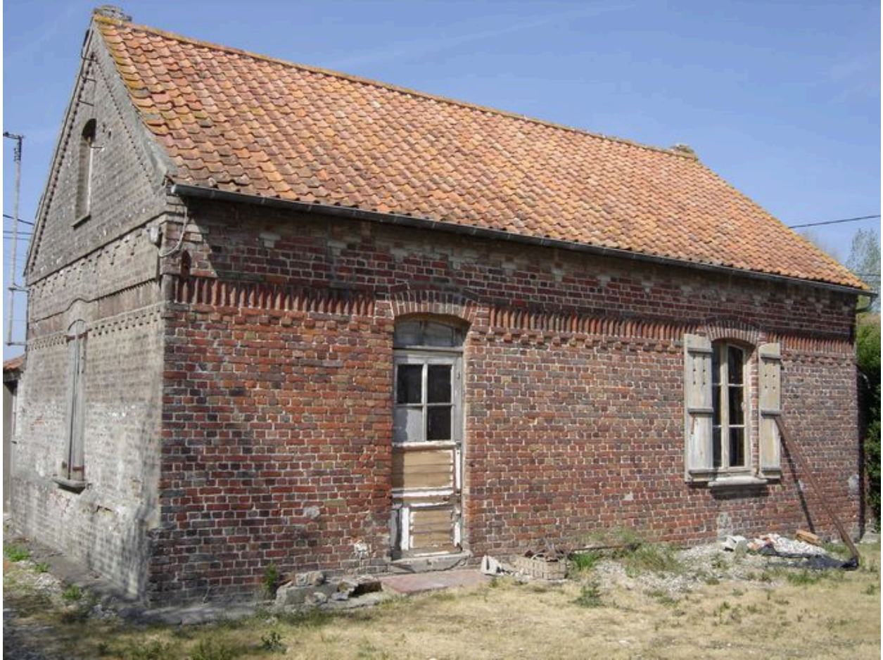
Vue du logement annexe depuis la cour.