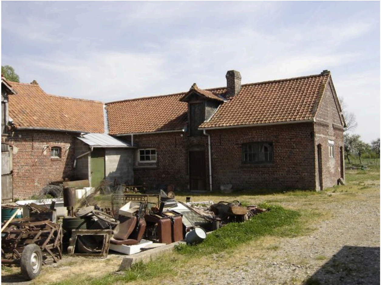
Vue des étables au sud-est de cour.