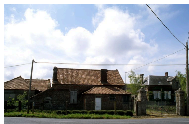
Vue du logement annexe au nord-est de la cour depuis la rue.