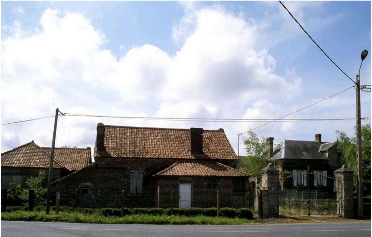
Vue du logement annexe au nord-est de la cour depuis la rue.