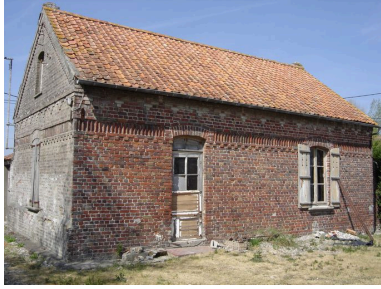
Vue du logement annexe depuis la cour.