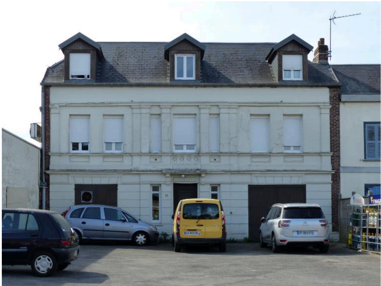
Vue de la façade principale du logis.