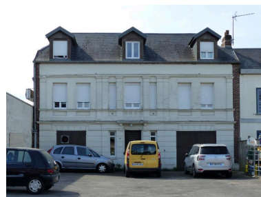
Vue de la façade principale du logis.