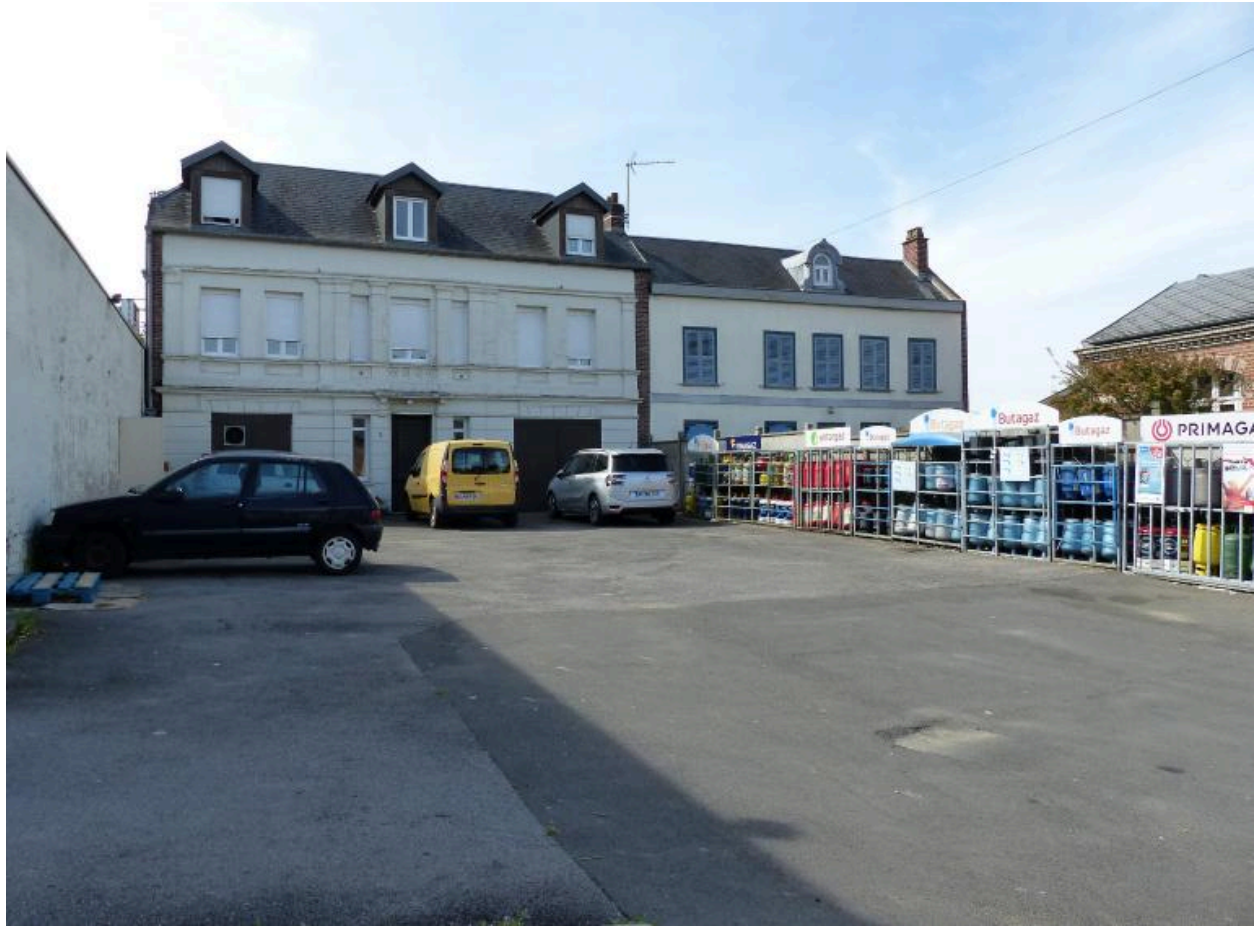
Vue de situation du logis, à gauche de l'image.