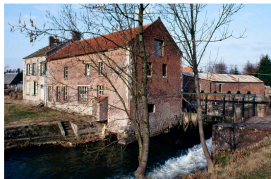
Vue d'ensemble, depuis le sud. IVR22_19920200408ZA