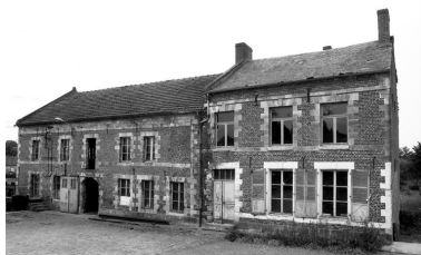
Vue de la façade du bâtiment principal. IVR22_19920201211Z