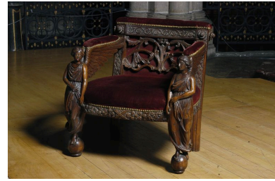
Siège de célébrant (diacre).