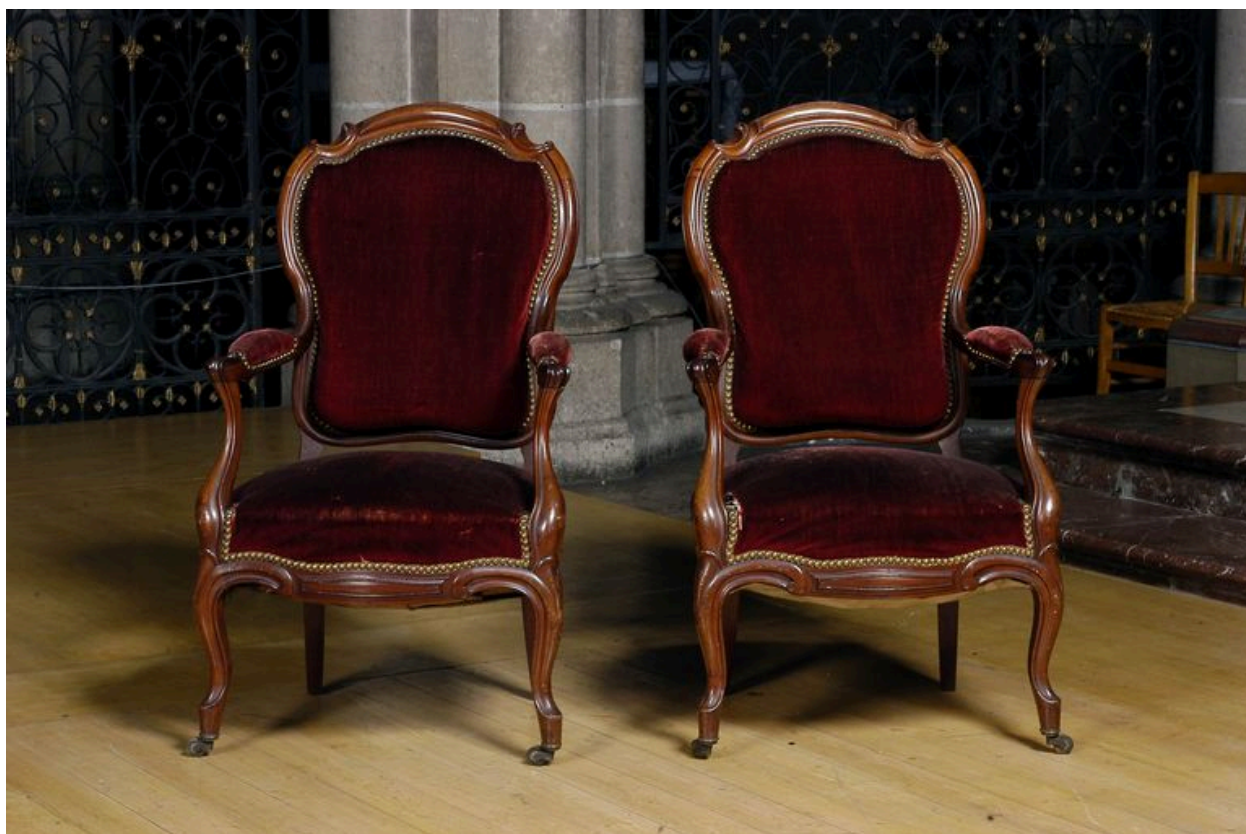
Sièges de célébrant (sous-diacres).