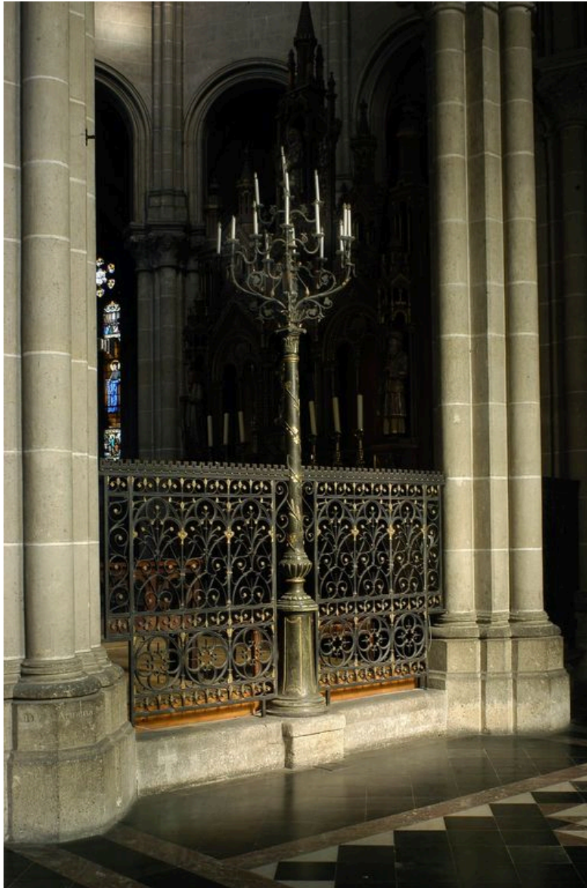
Vue de la clôture et du candélabre.