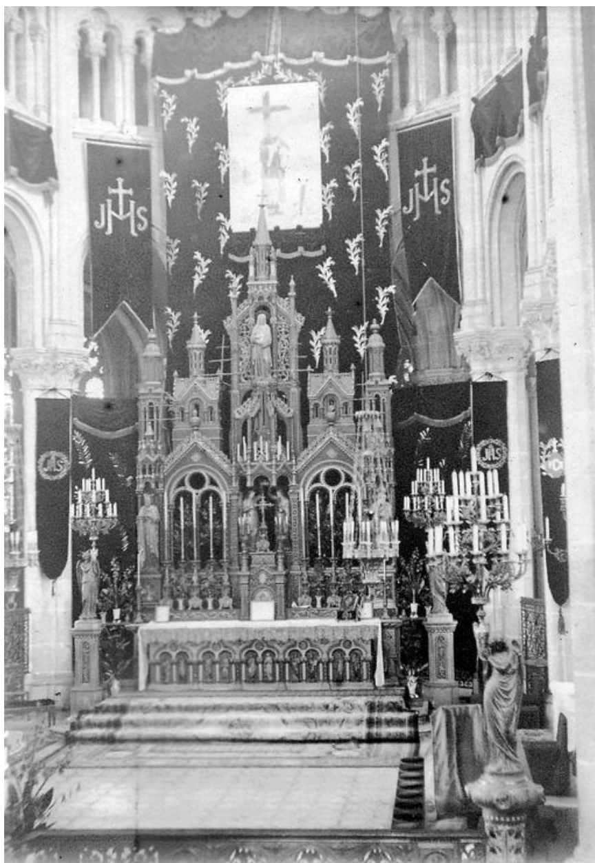
Le maître-autel, au début du 20e siècle.