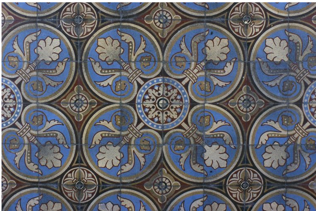
Détail du carrelage.