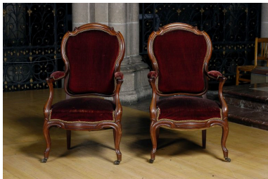
Sièges de célébrant (sous-diacres).