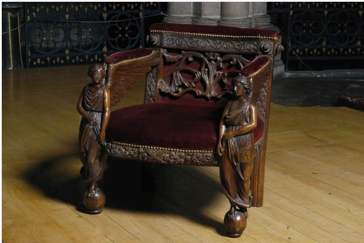
Siège de célébrant (diacre).