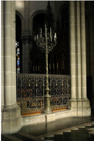
Vue de la clôture et du candélabre. IVR22_20058001883NUCA