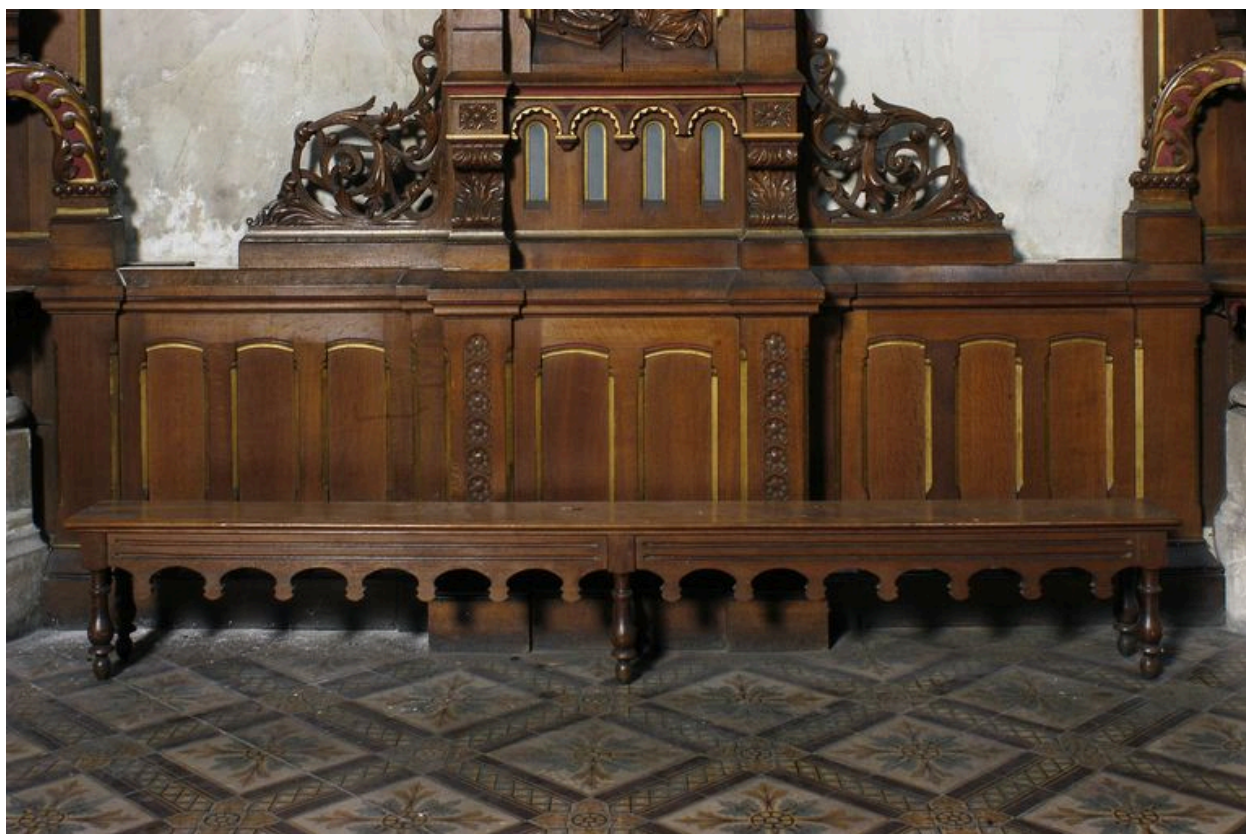
Banc (actuellement conservés dans les chapelles des transepts).