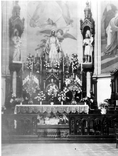
Vue du choeur au début du 20e siècle.