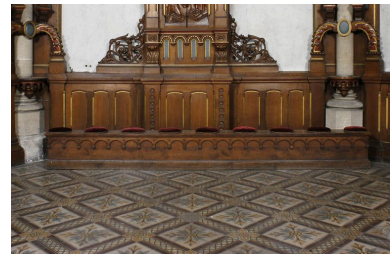
Banc (actuellement conservés dans les chapelles des transepts). IVR22_20058001908NUCA