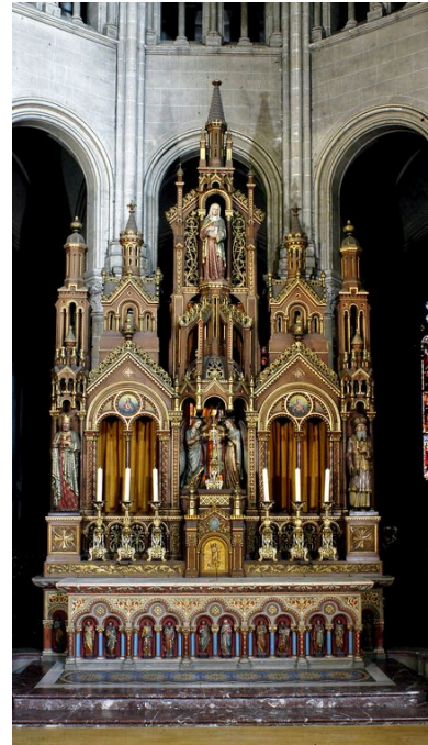
Maître-autel