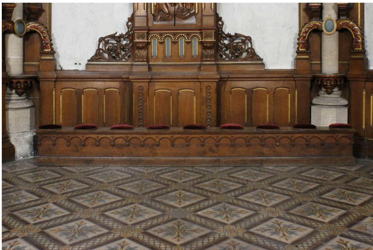
Banc (actuellement conservés dans les chapelles des transepts).