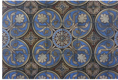
Détail du carrelage.