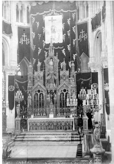
Le maître-autel, au début du 20e siècle (AP Congrégation). IVR22_20058099989NUCA