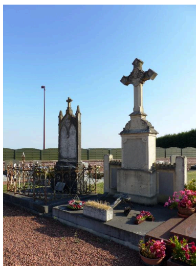
Concessions perpétuelles dans l'allée principale du cimetière.