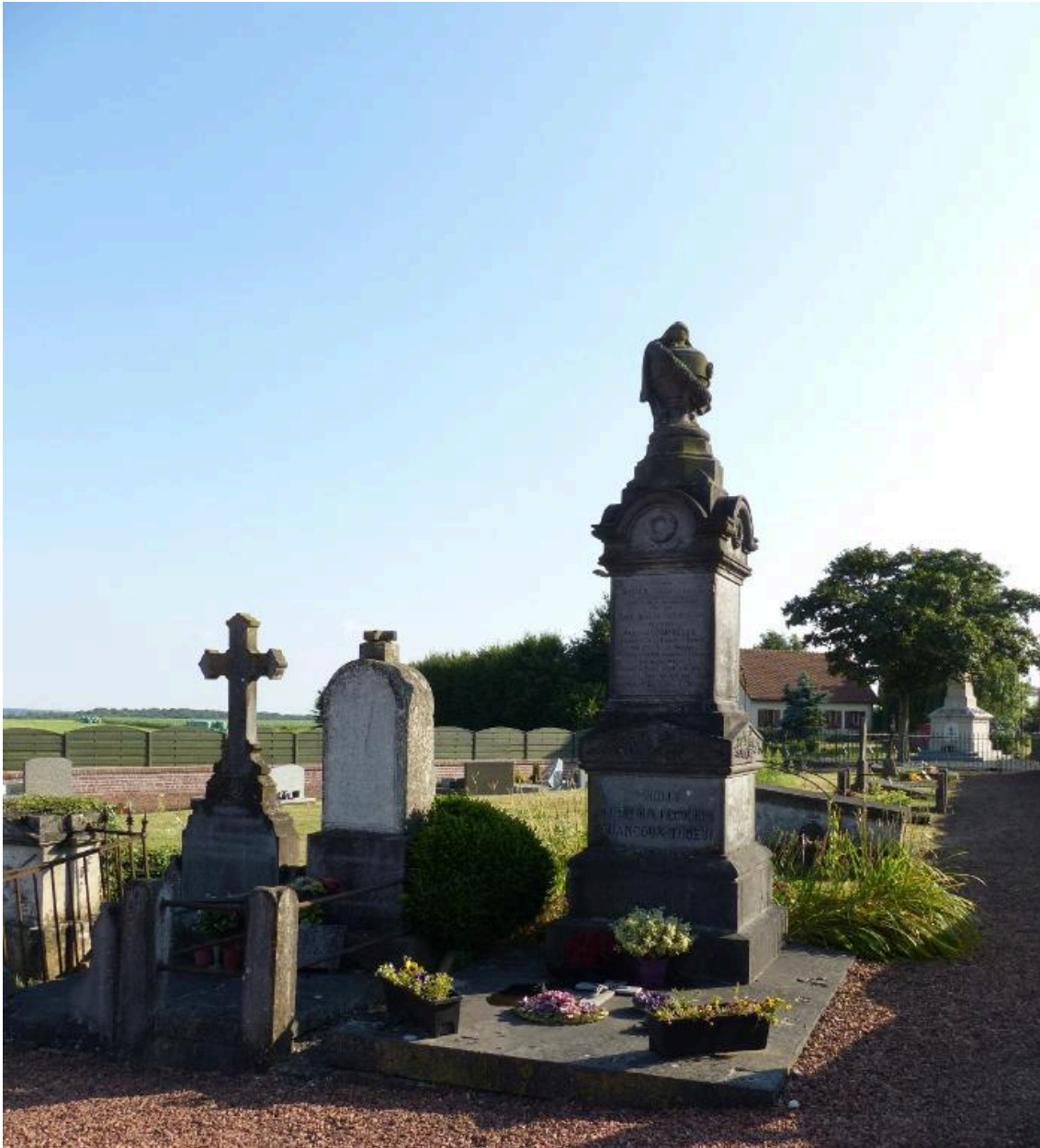
Vue générale du cimetière.