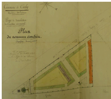
Cachy. Plan du nouveau cimetière, 1878 (AD Somme ; 99 O 879). IVR32_20178005092NUCA