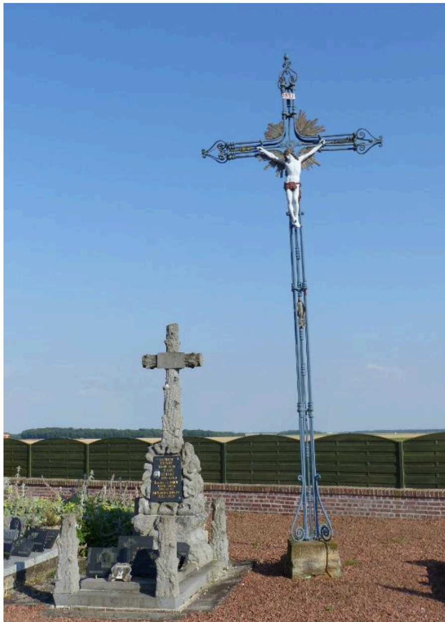
La croix de cimetière, érigée en 1865.