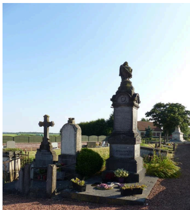
Vue générale du cimetière. IVR32_20168005720NUCA