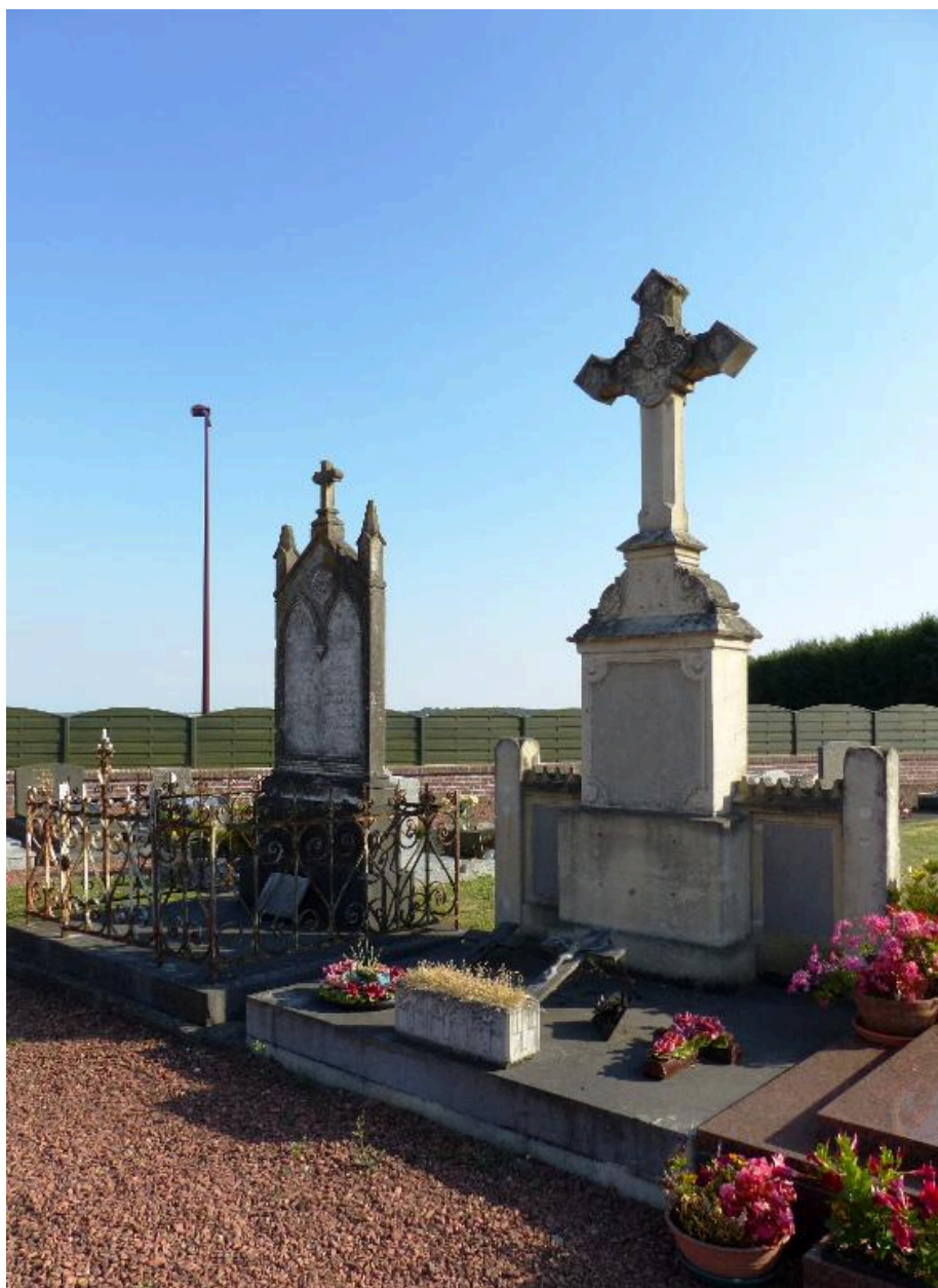
Concessions perpétuelles dans l'allée principale du cimetière.