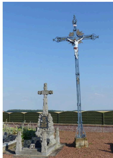
La croix de cimetière, érigée en 1865. IVR32_20168005718NUCA