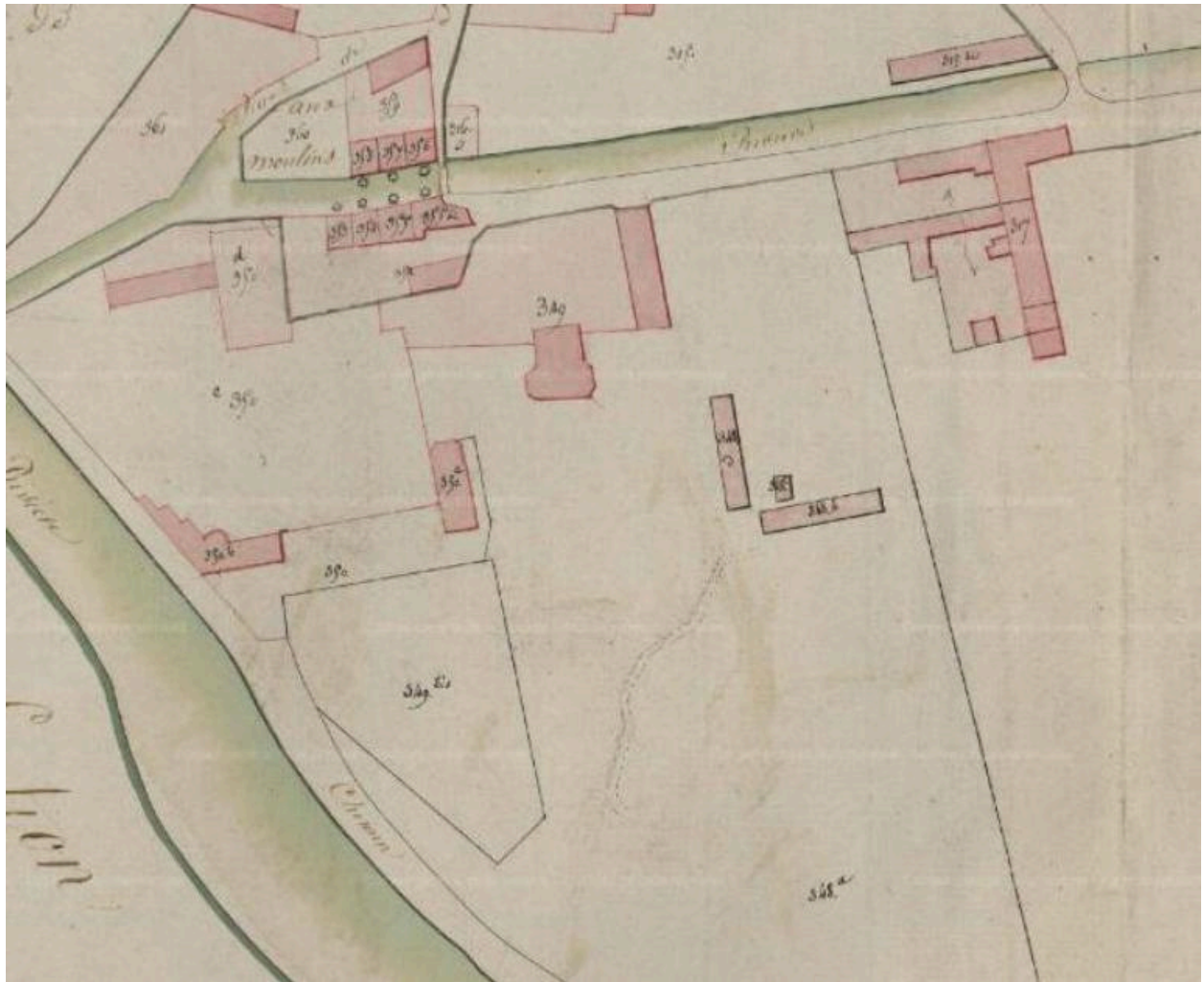
Extrait du cadastre de 1812 (AD Somme).