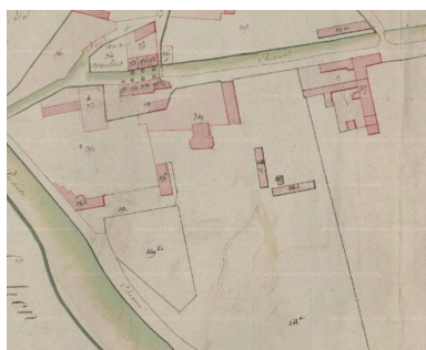
Extrait du cadastre de 1812 (AD Somme).

IVR22_20148005161NUC2A