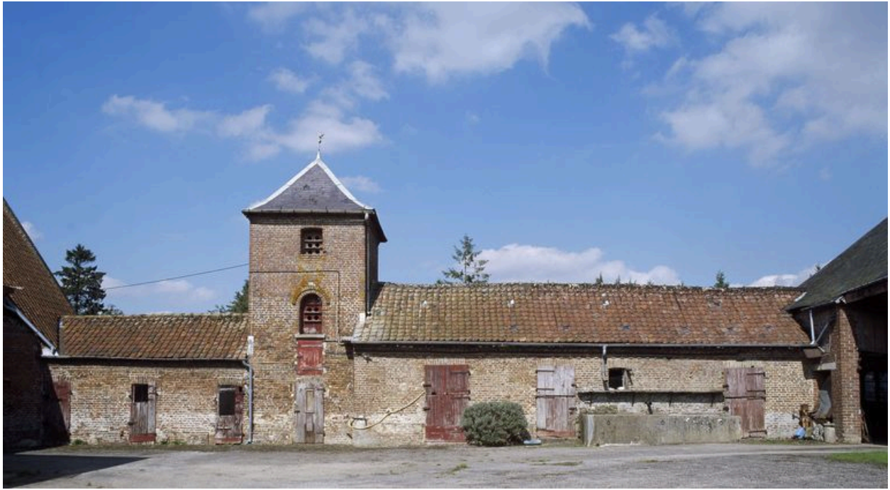
Colombier flanqué d'étables.