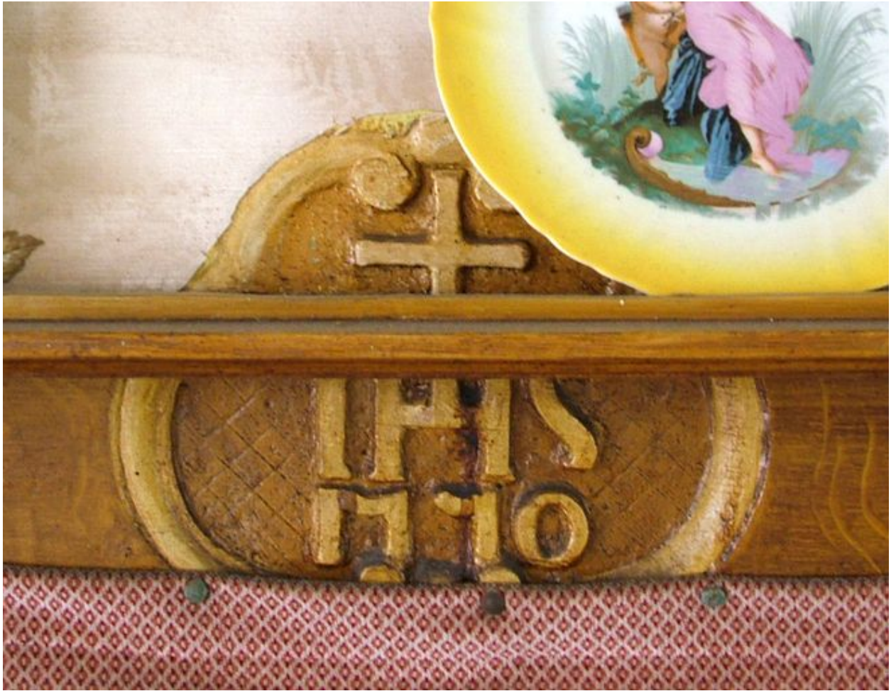
Inscription et date portée sur le linteau de la cheminée de la cuisine : IHS et 1770.