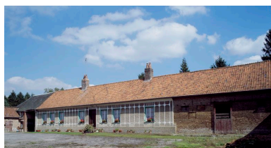
Logis et étable.