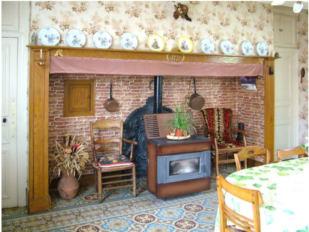
Cheminée de la cuisine.