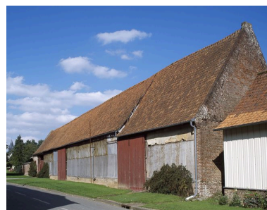
Vue générale depuis la rue. IVR22_20108000357XA