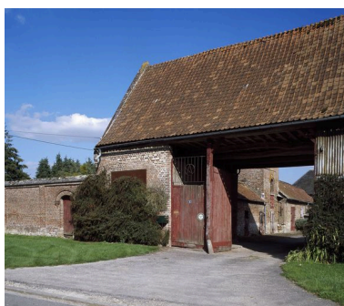
Porte et passage charretiers. IVR22_20108000358XA