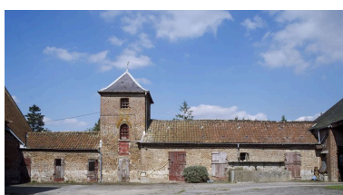
Colombier flanqué d'étables.