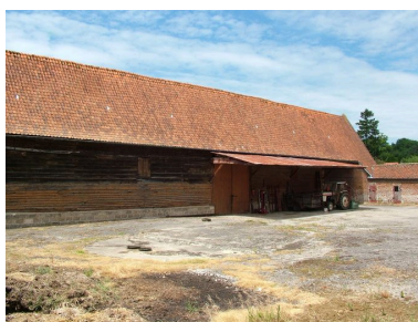
Grange. IVR22_20108001947NUCA