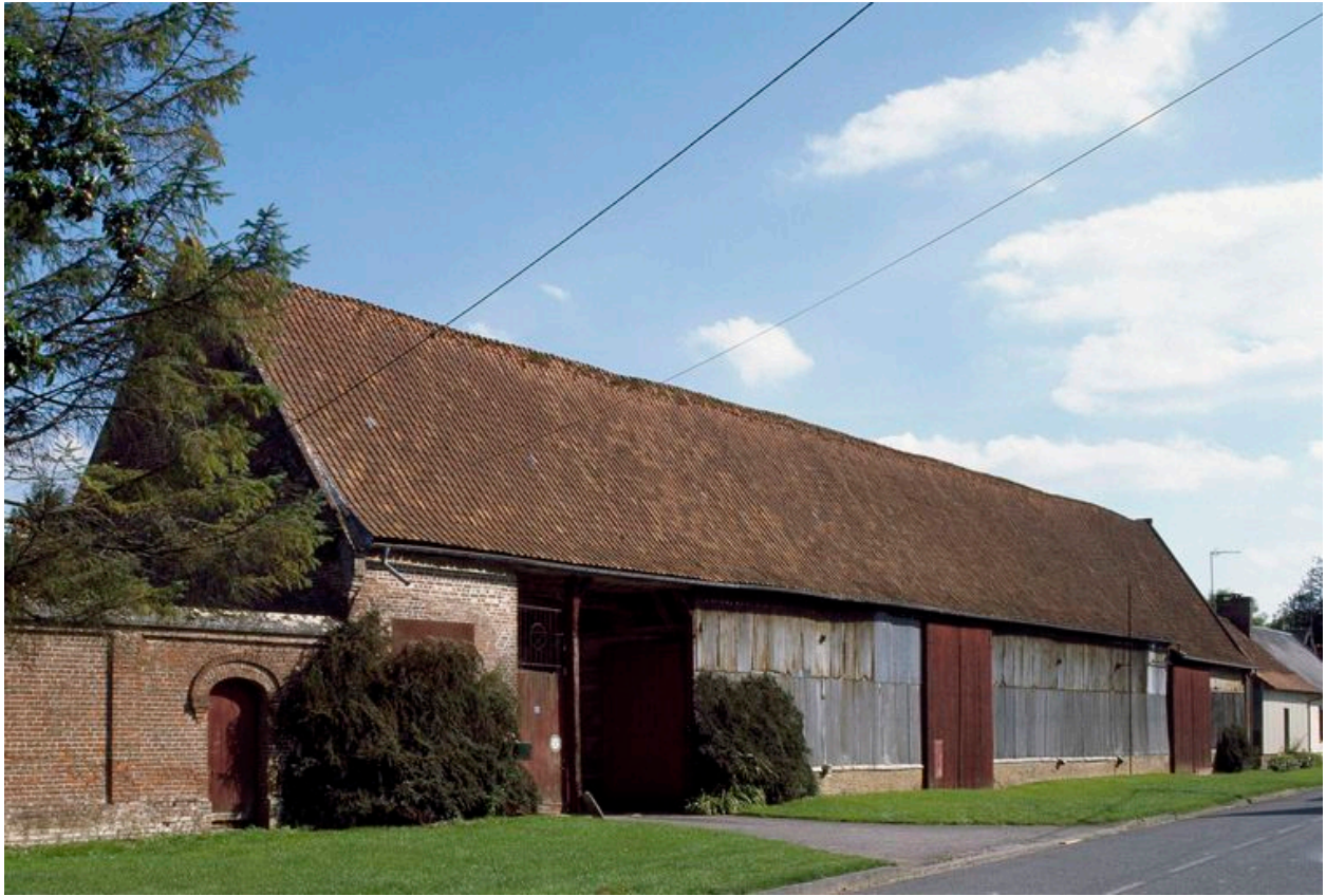
Vue générale depuis la rue.