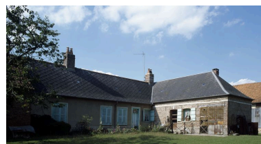
Vue arrière du logis sur jardin. IVR22_20108000353XA