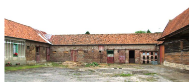
Etables. IVR22_20108002081NUCA