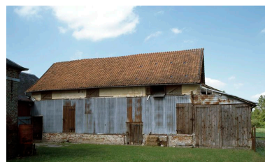
Grange en retour d'équerre sur le jardin.