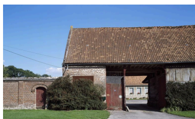
Porte et passage charretiers. IVR22_20108000359XA