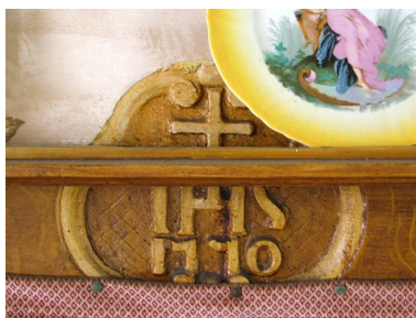
Inscription et date portée sur le linteau de la cheminée de la cuisine : IHS et 1770. IVR22_20108001950NUCA