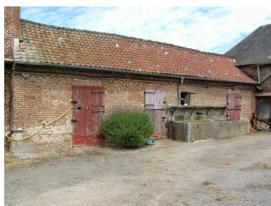
Etable jouxtant le colombier.