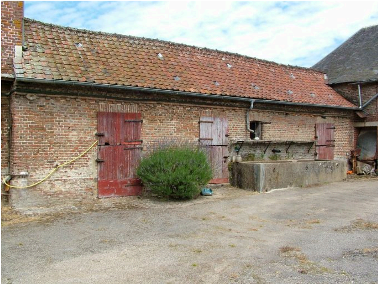
Etable jouxtant le colombier.