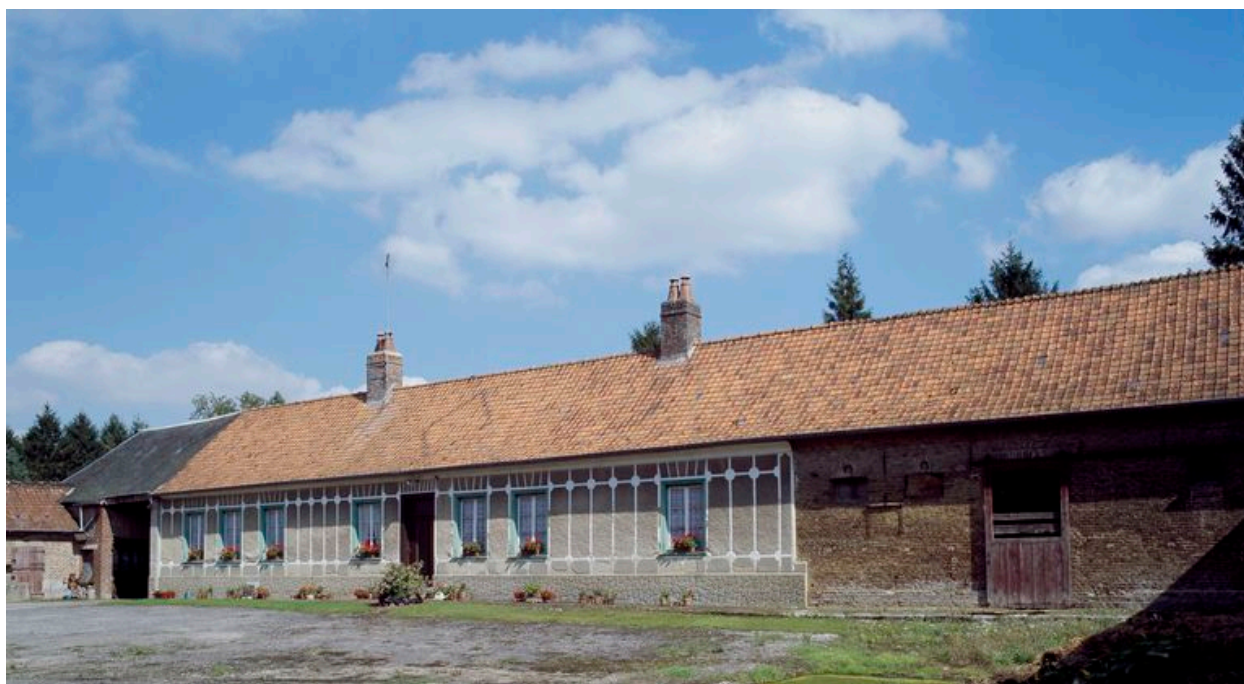
Logis et étable.