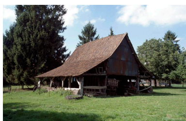
Charreterie.