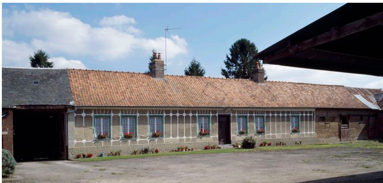
Logis et étable.