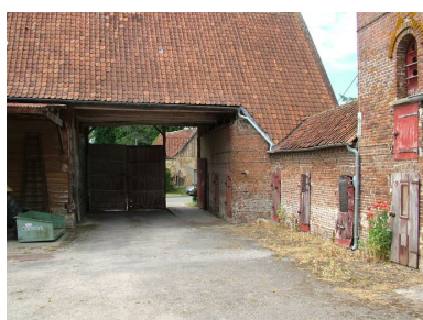
Etables dans le prolongement du passage charretier. IVR22_20108001943NUCA