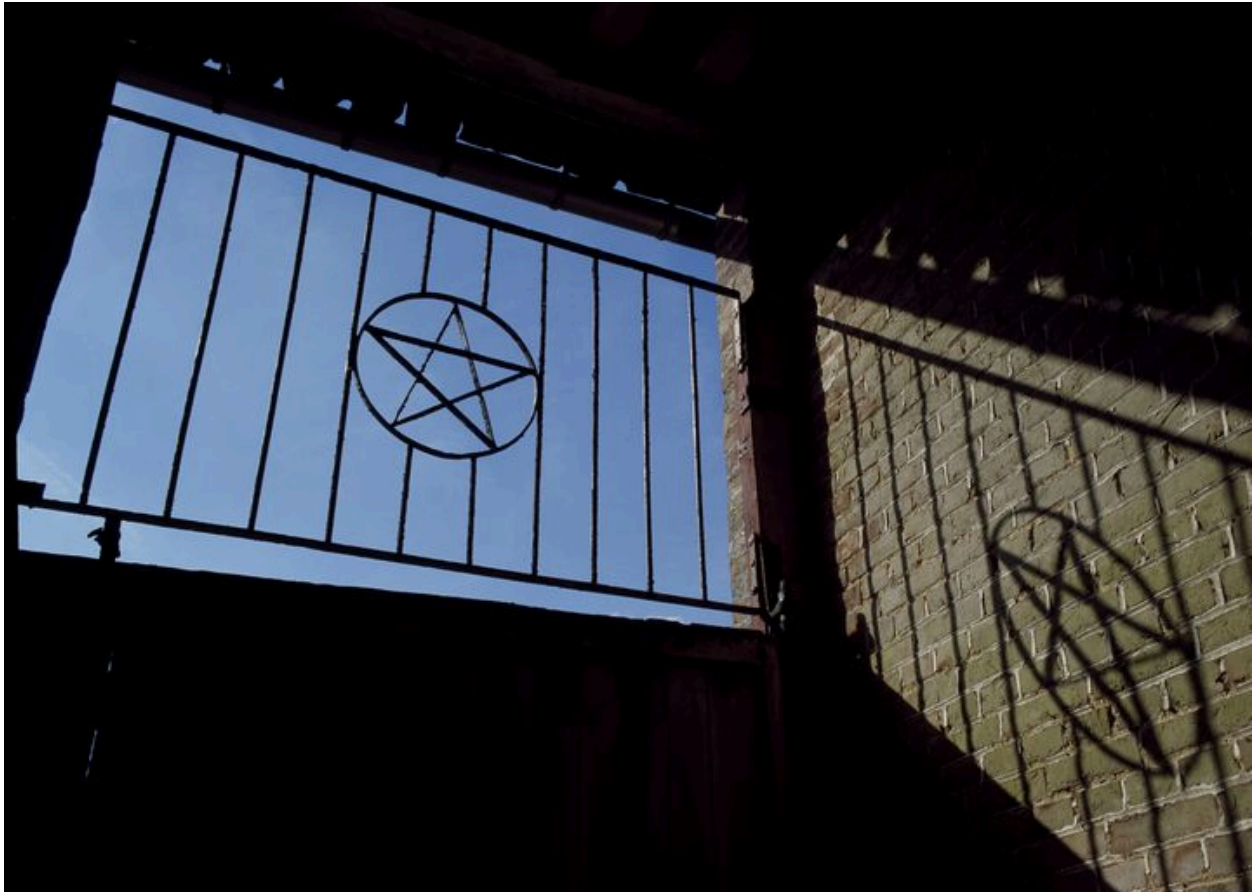
Imposte de la porte charretière.