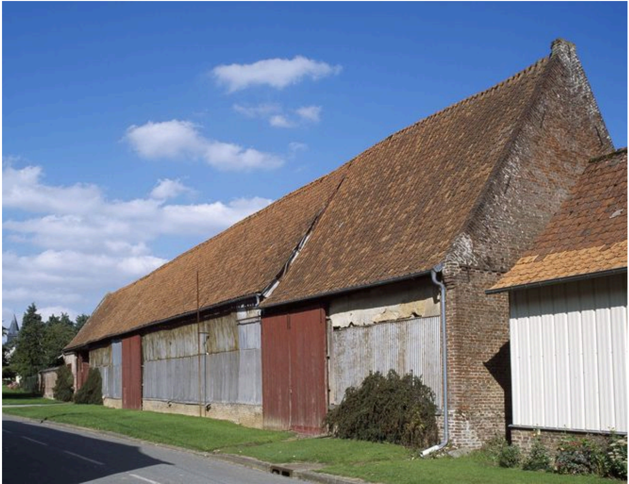
Vue générale depuis la rue.