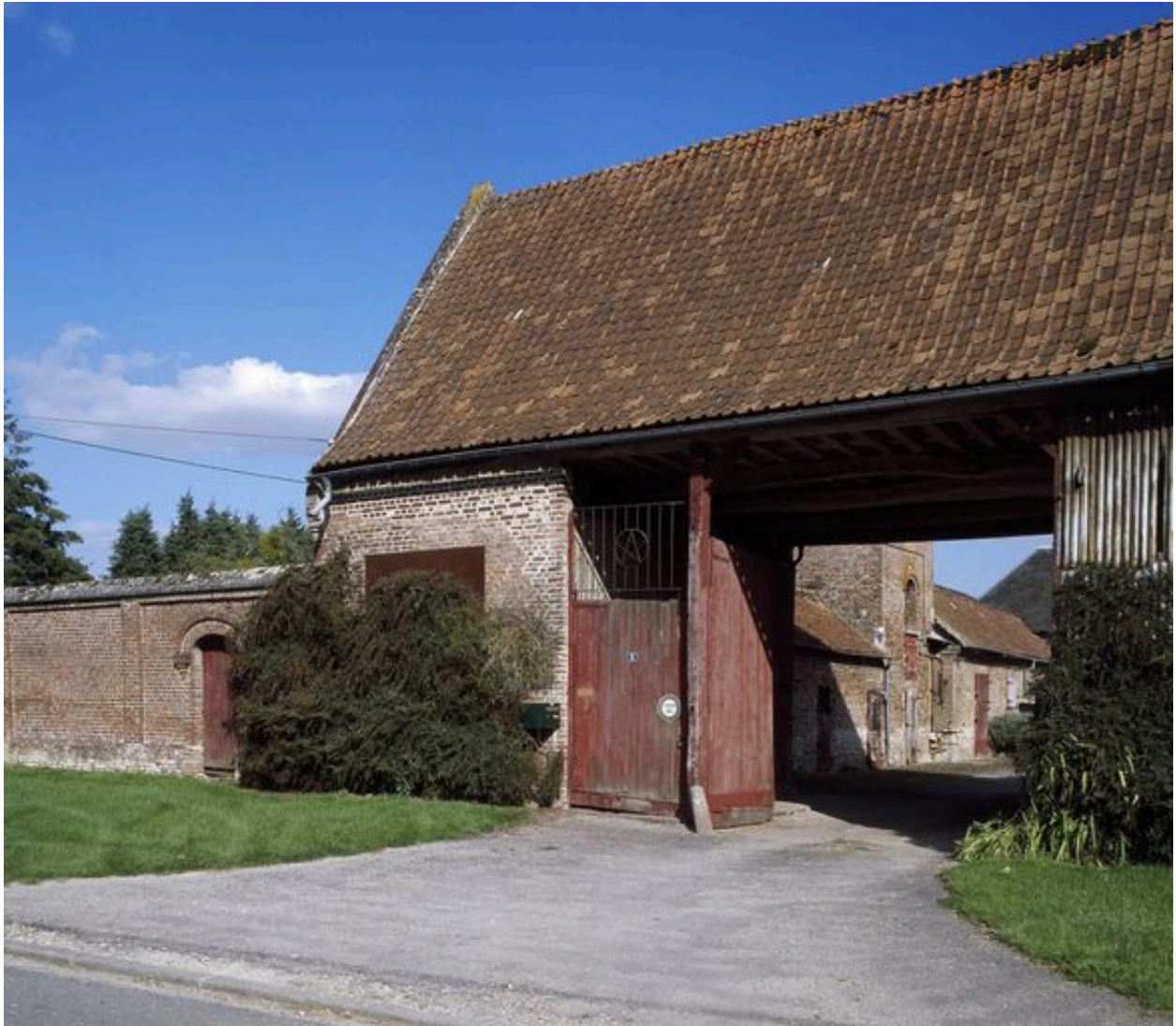
Porte et passage charretiers.