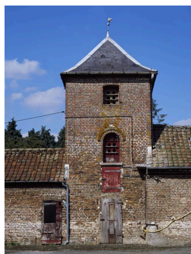
Colombier flanqué. IVR22_20108000354XA