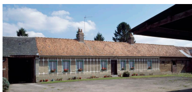
Logis et étable. IVR22_20108000363XA