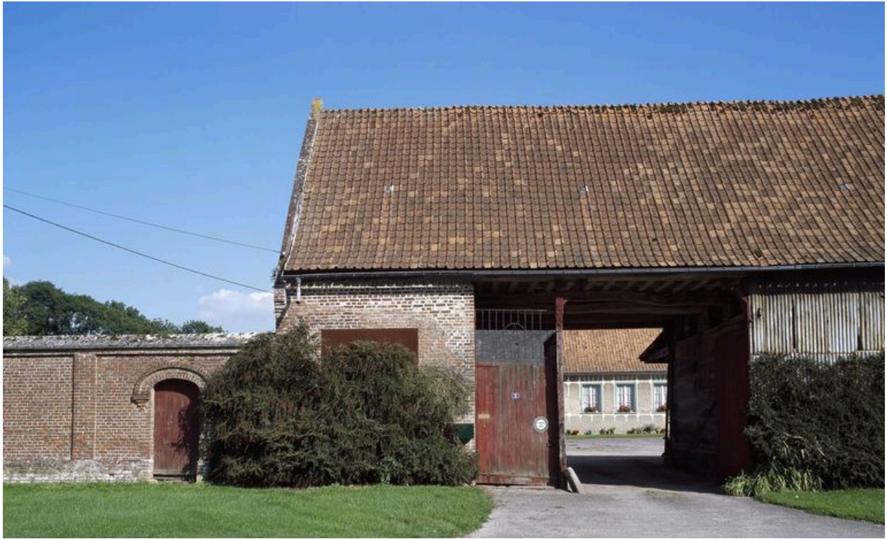
Porte et passage charretiers.