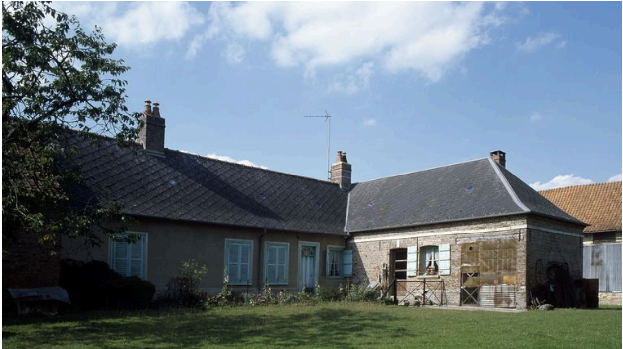
Vue arrière du logis sur jardin.