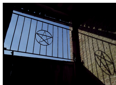
Imposte de la porte charretière. IVR22_20108000361XA