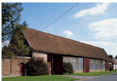
Vue générale depuis la rue. IVR22_20108000360XA