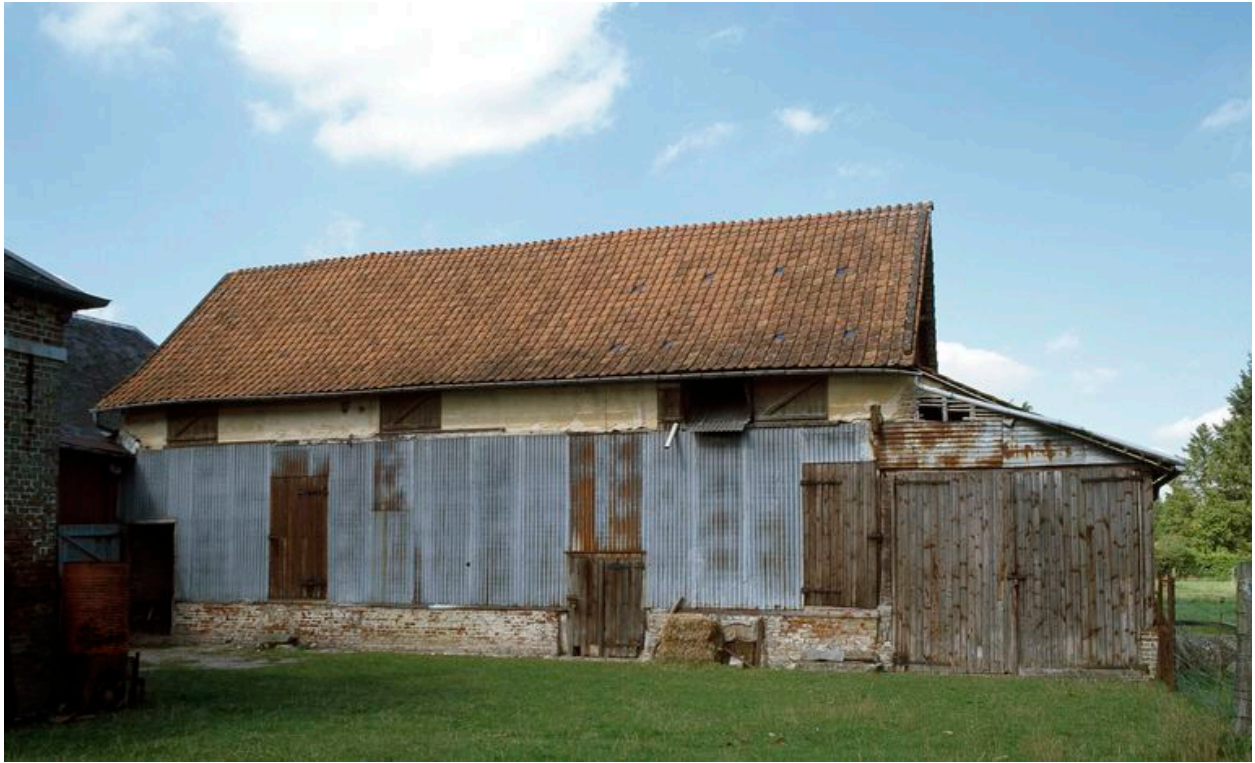
Grange en retour d'équerre sur le jardin.