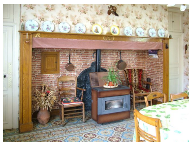
Cheminée de la cuisine.