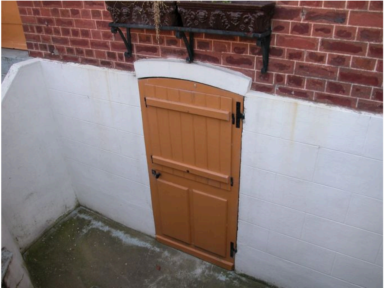
Détail de la porte d'accès au sous-sol (travée de droite en façade).