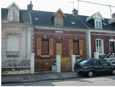
Vue d'ensemble. IVR22_20058003131NUCA