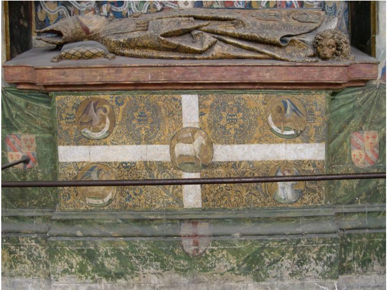
Vue de détail sur le décor sous la niche.