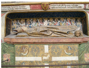
Vue de détail sur la niche et le gisant.