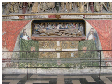
Vue générale. IVR22_20068013033NUCA