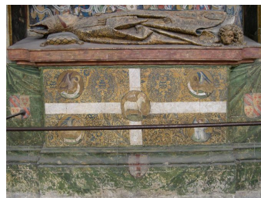
Vue de détail sur le décor sous la niche. IVR22_20068013035NUCA