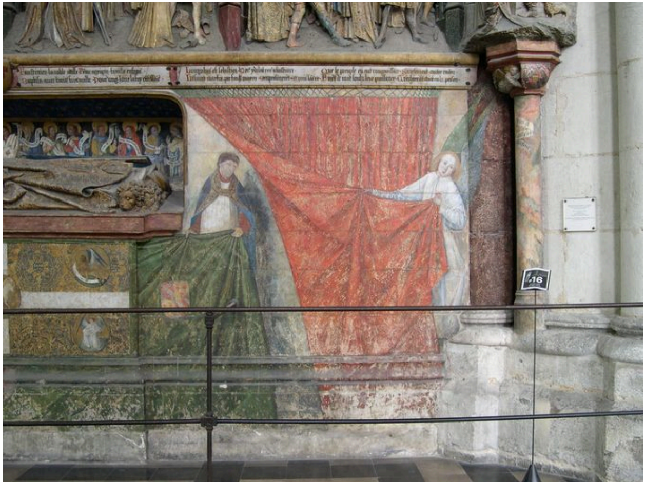
Vue de détail sur la partie droite du décor mural.