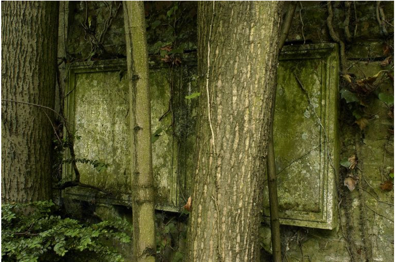
Vue de la stèle rectangulaire.