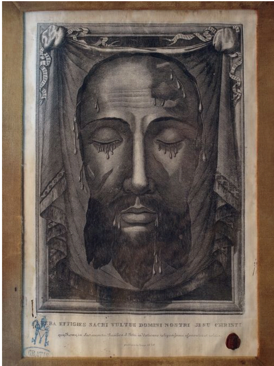
Vue partielle, gravure