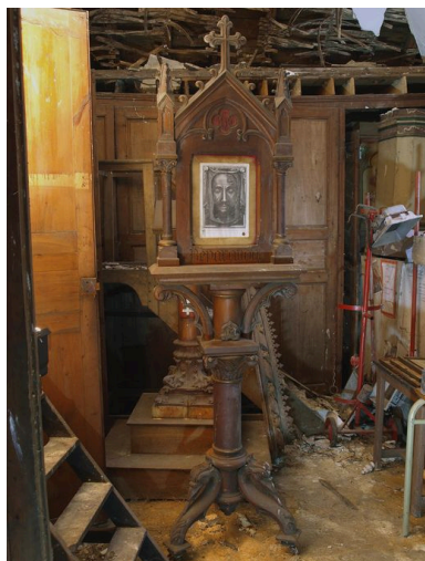
Vue générale IVR31_20106202070NUCA