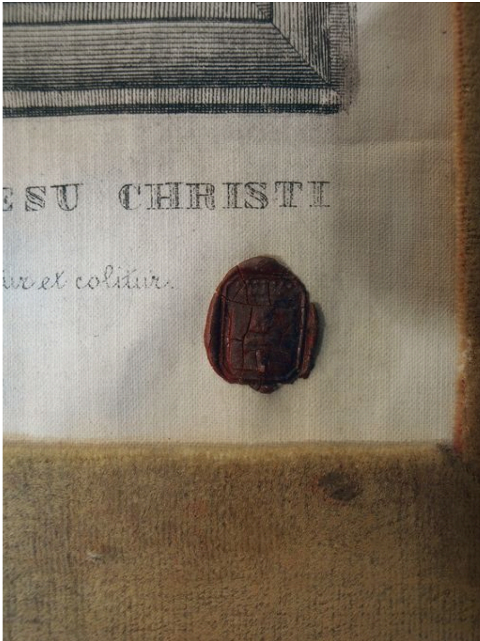
Vue de détail, sceau