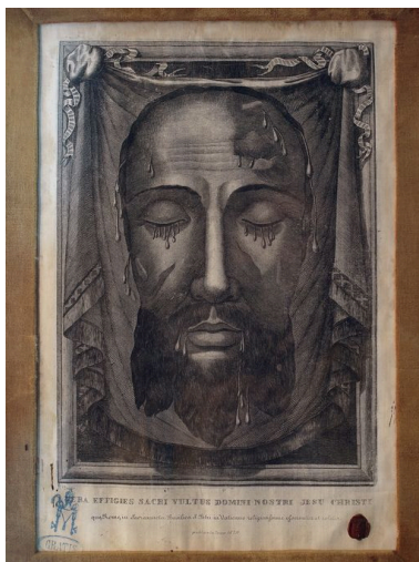
Vue partielle, gravure IVR31_20106202071NUCA