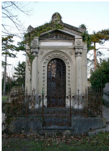
Vue générale. IVR22_20078001318NUCA