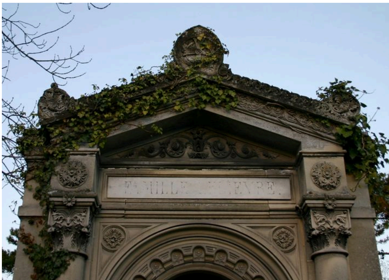
Détail du fronton du tombeau-chapelle.