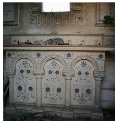
Faux-autel polychrome. IVR22_20078001323NUCA