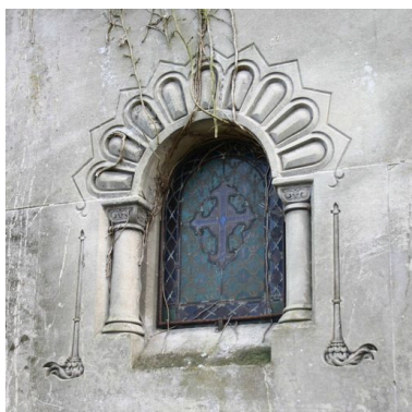
Fenêtre cintrée, ouvrant les murs latéraux du tombeau-chapelle. IVR22_20078001322NUCA