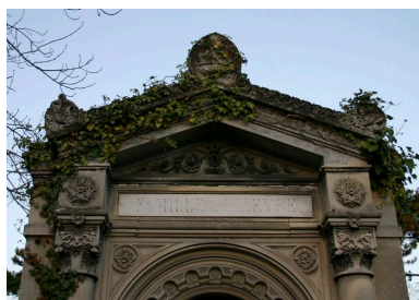
Détail du fronton du tombeau-chapelle.