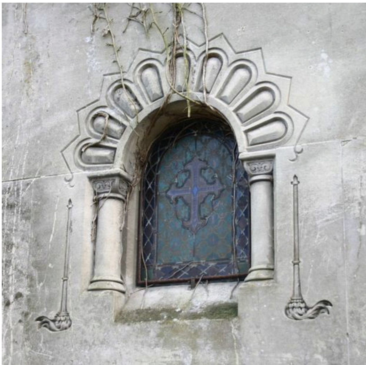
Fenêtre cintrée, ouvrant les murs latéraux du tombeau-chapelle.