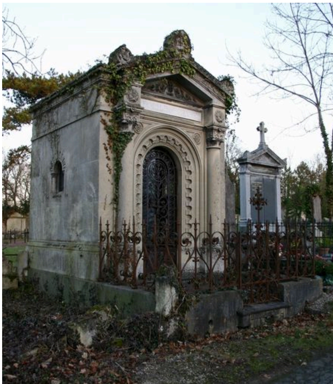
Vue générale, depuis le côté.