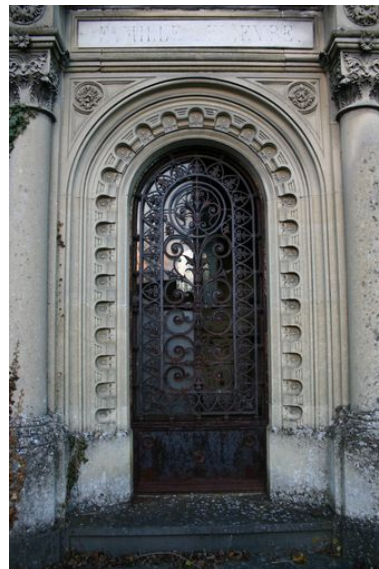
Détail de la porte du tombeau-chapelle.