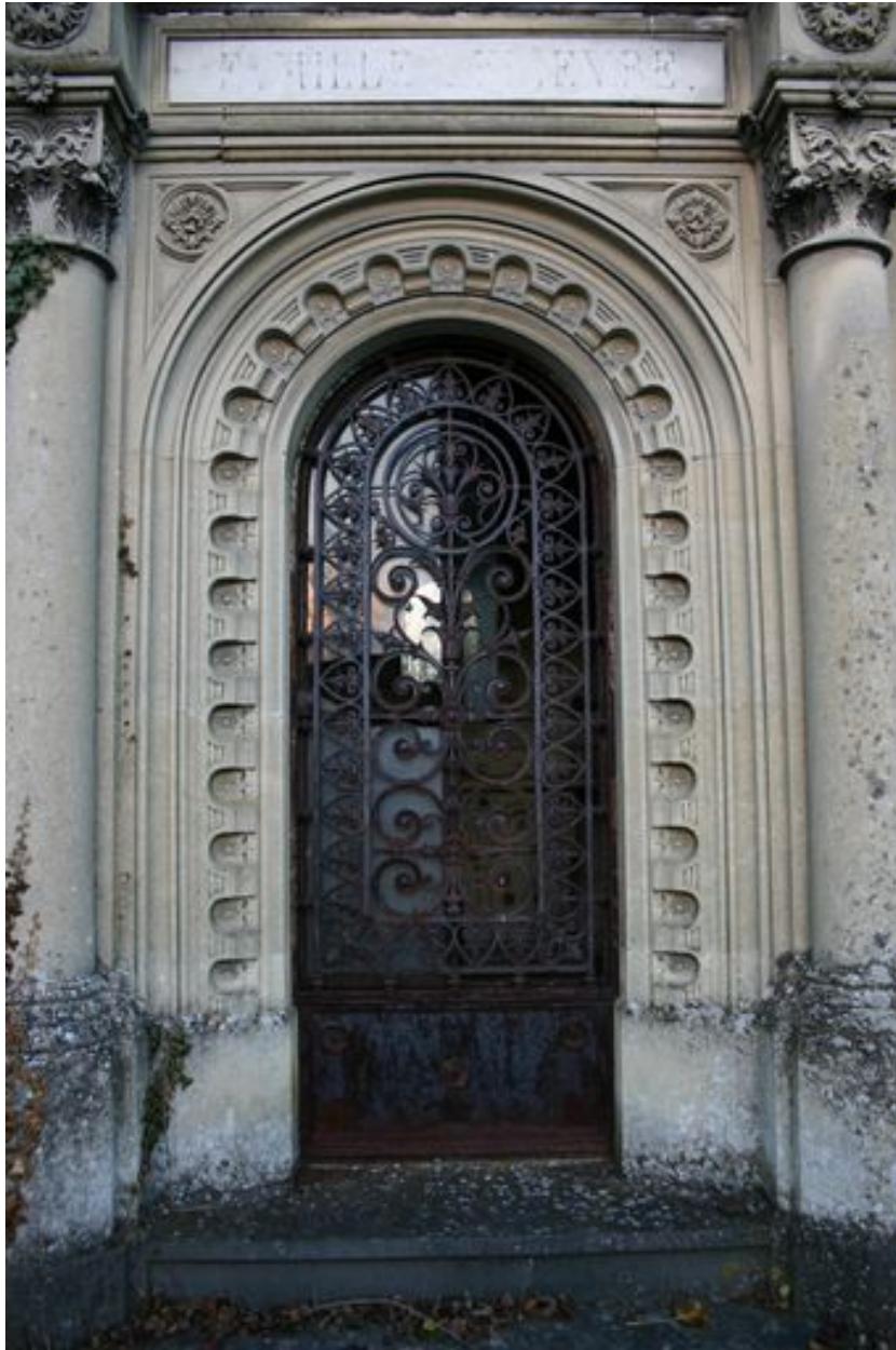
Détail de la porte du tombeau-chapelle.