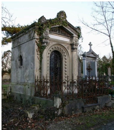
Vue générale, depuis le côté.