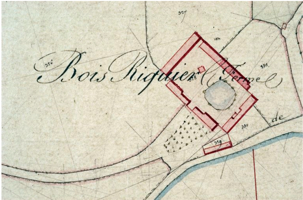
Extrait du cadastre napoléonien, 1834 (AD Somme ; 3P 1772/3).