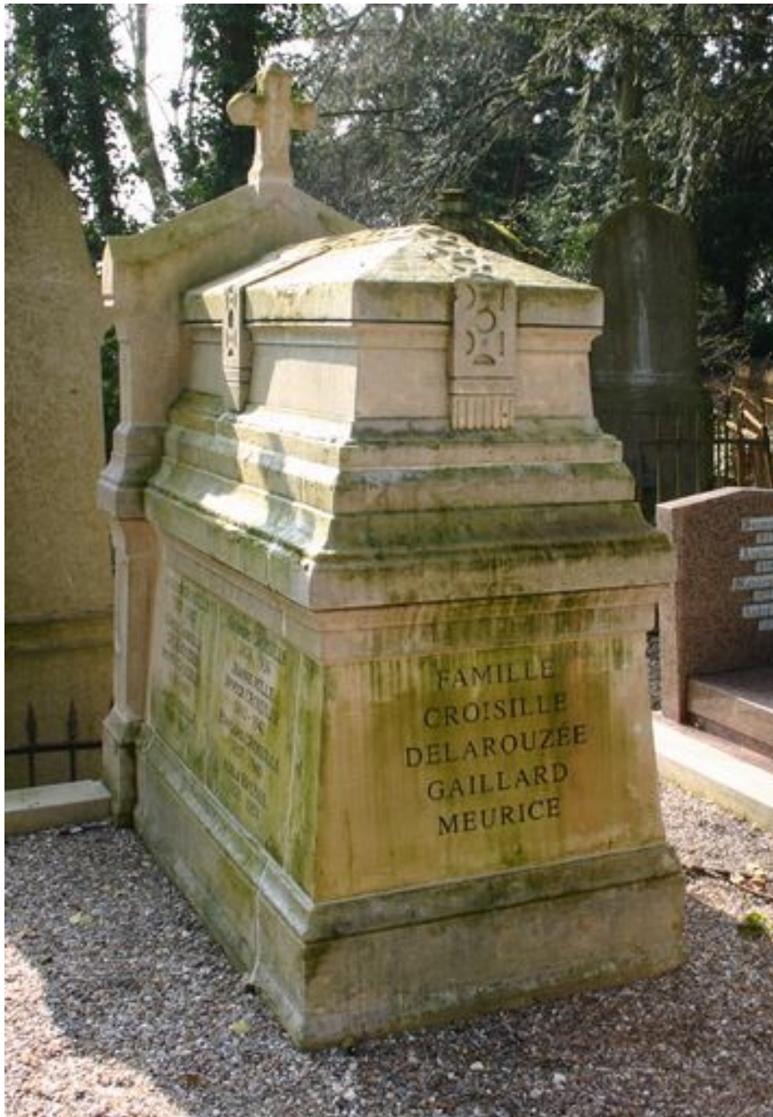
Tombeau en forme de catafalque, vers 1867-1881.