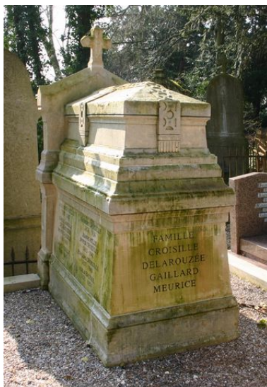
Tombeau en forme de catafalque, vers 1867-1881.