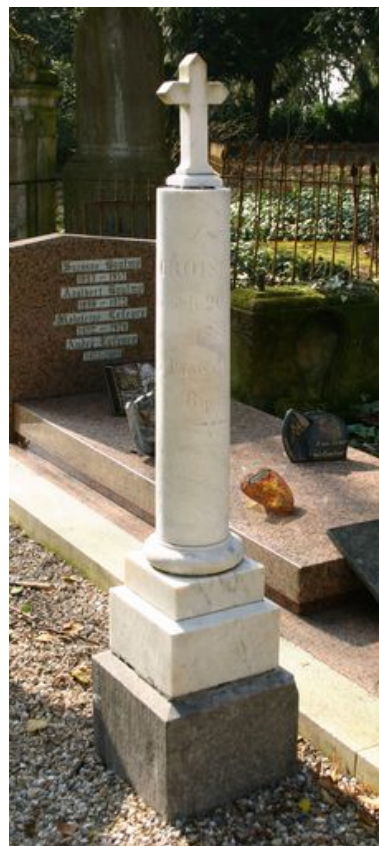
Colonne funéraire, vers 1865. IVR22_20098001057NUCA