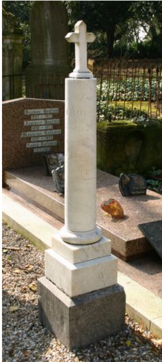
Colonne funéraire, vers 1865.