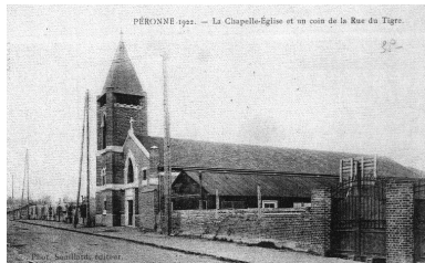
Péronne. 1922. La chapelle église et un coin de la rue du Tigre, carte postale, 1922 (Historial de la Grande Guerre, Péronne ; n° 13538). IVR22_20158005688NUCA