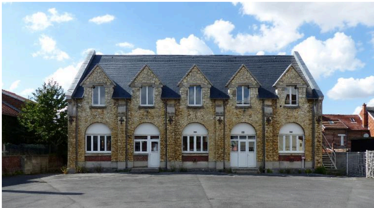
Vue de la maison paroissiale.