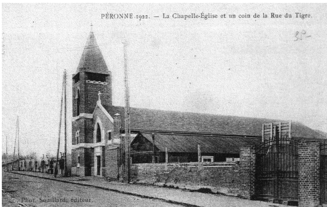
Péronne. 1922. La chapelle église et un coin de la rue du Tigre, carte postale, 1922 (Historial de la Grande Guerre, Péronne ; n° 13538).