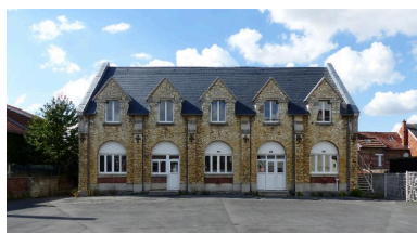
Vue de la maison paroissiale.