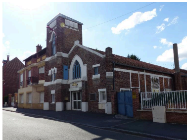
Vue générale. IVR32_20178005191NUCA