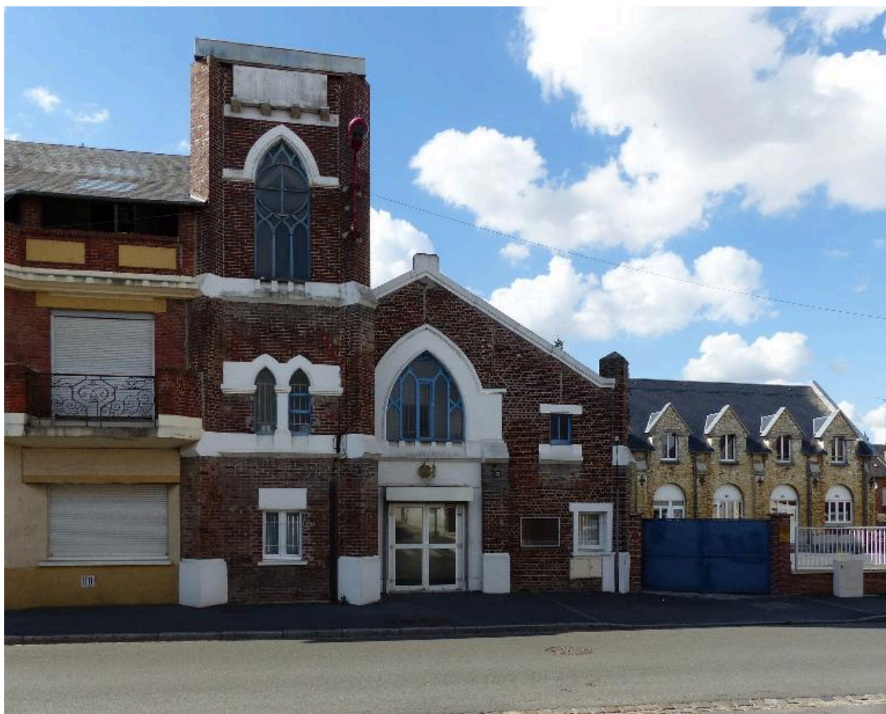
Vue de face. La maison paroissiale à l'arrière-plan.