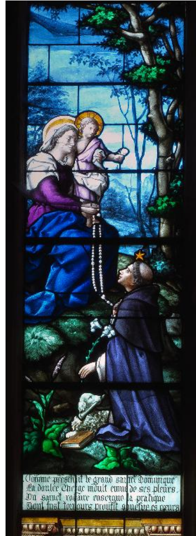
Vue de détail : la Remise du rosaire. IVR22_20146000141NUC2A

IVR22_20146000140NUC2A