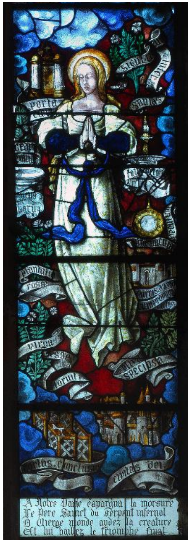
Vue de détail : la Vierge des litanies.