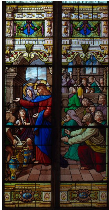
Vue de détail : les Noces de Cana.