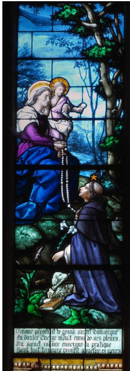
Vue de détail : la Remise du rosaire.

IVR22_20146000141NUC2A Auteur de l'illustration : Marie-Laure Monnehay-Vulliet (c) Région Hauts-de-France - Inventaire général reproduction soumise à autorisation du titulaire des droits d'exploitation