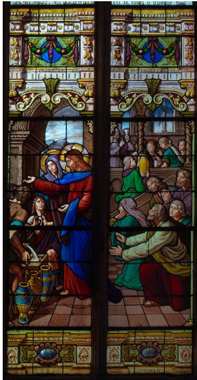
Vue de détail : les Noces de Cana.