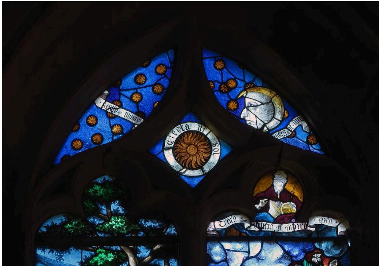
Vue du tympan.