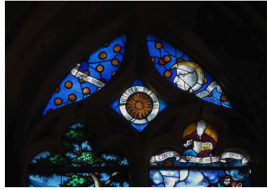
Vue du tympan.

IVR22_2014600076NUC2A