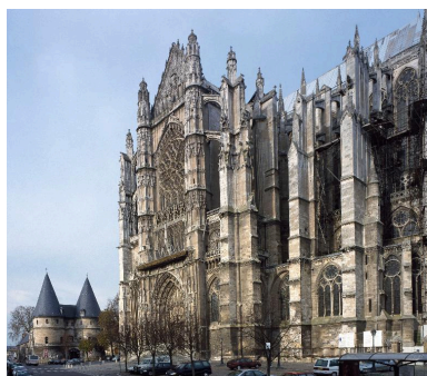
Vue du flanc sud de la cathédrale, avec les deux tours du palais épiscopal. IVR22_19996001584VA