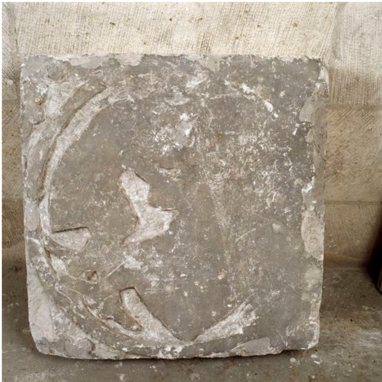
Vue d'une dalle : hommes luttant.