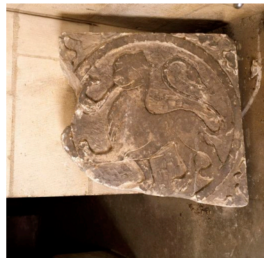
Vue d'une dalle : félin dévorant un oiseau. IVR22_20100200046XA