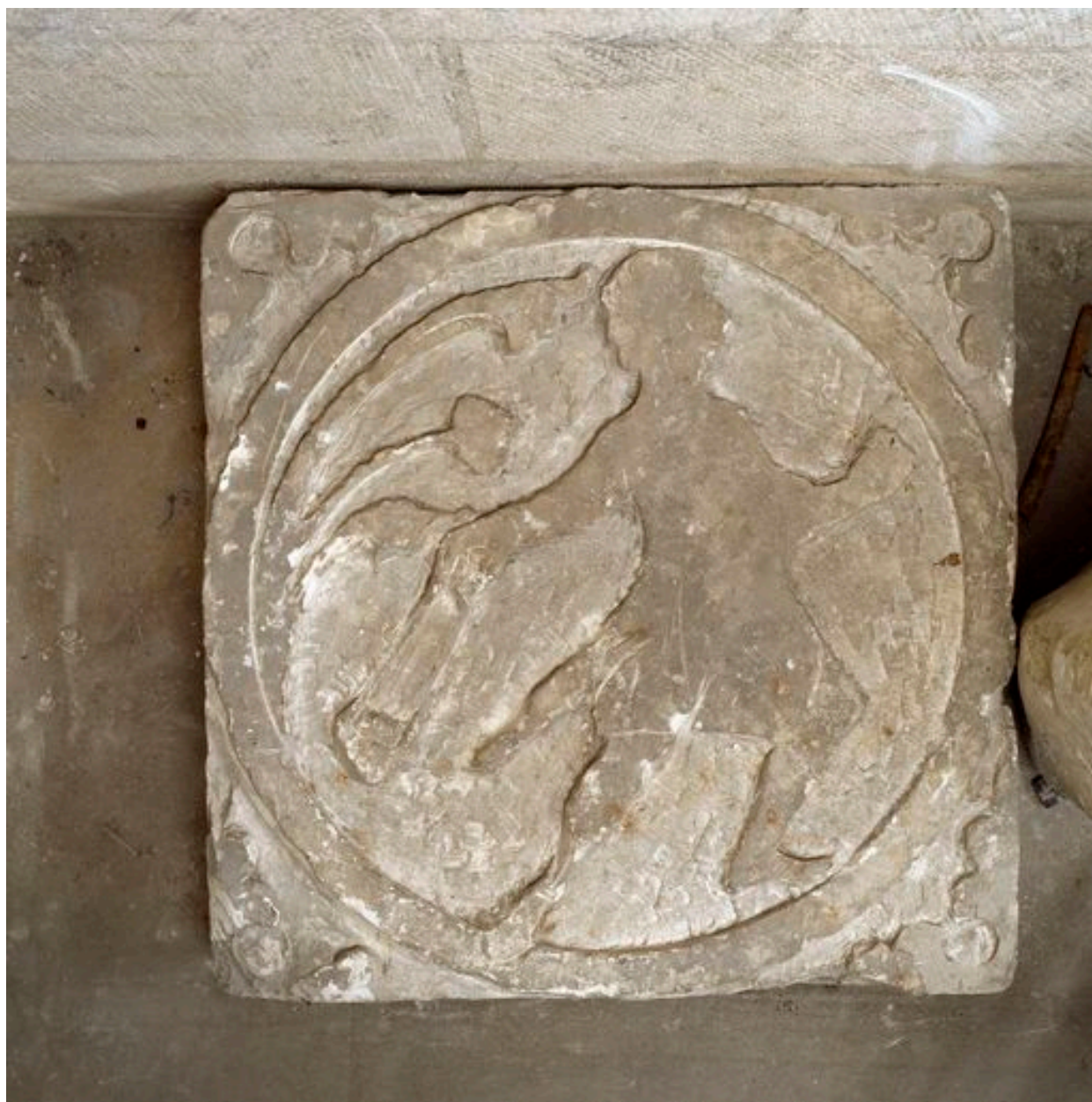
Vue d'une dalle : David (?) avec sa fronde.