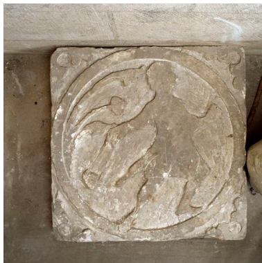
Vue d'une dalle : David (?) avec sa fronde.