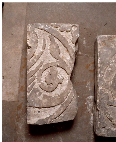
Fragment de dalle : basilic.