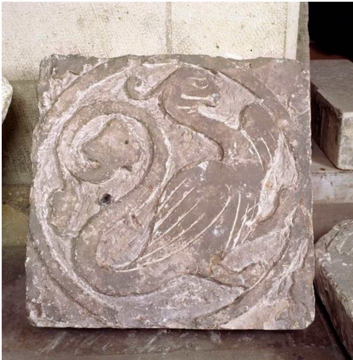
Vue d'une dalle : basilic.