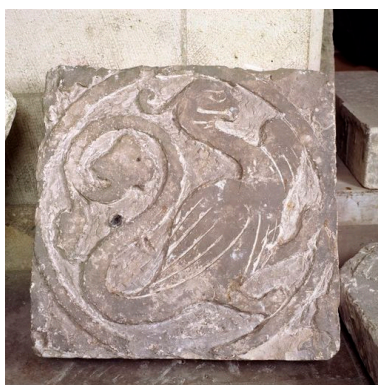
Vue d'une dalle : basilic. IVR22_20100200051XA