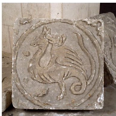
Vue d'une dalle : dragon attaqué par un oiseau à tête de chien. IVR22_20100200050XA