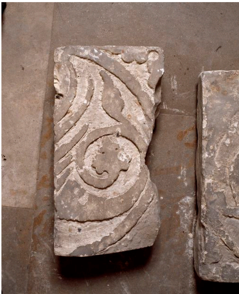
Fragment de dalle : basilic.