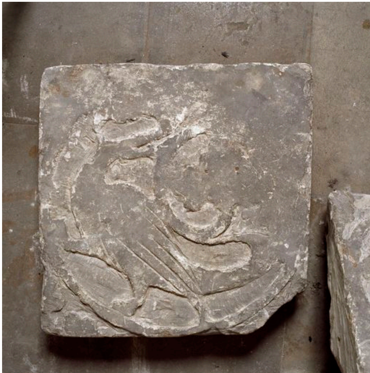
Vue d'une dalle : basilic.