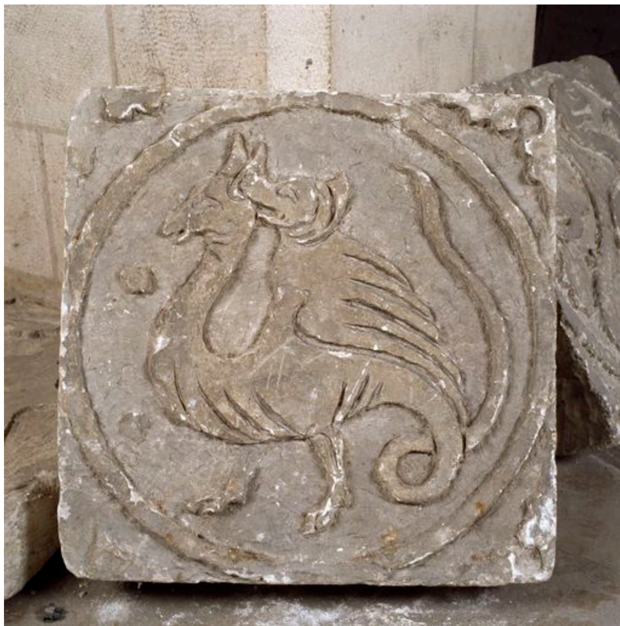
Vue d'une dalle : dragon attaqué par un oiseau à tête de chien.