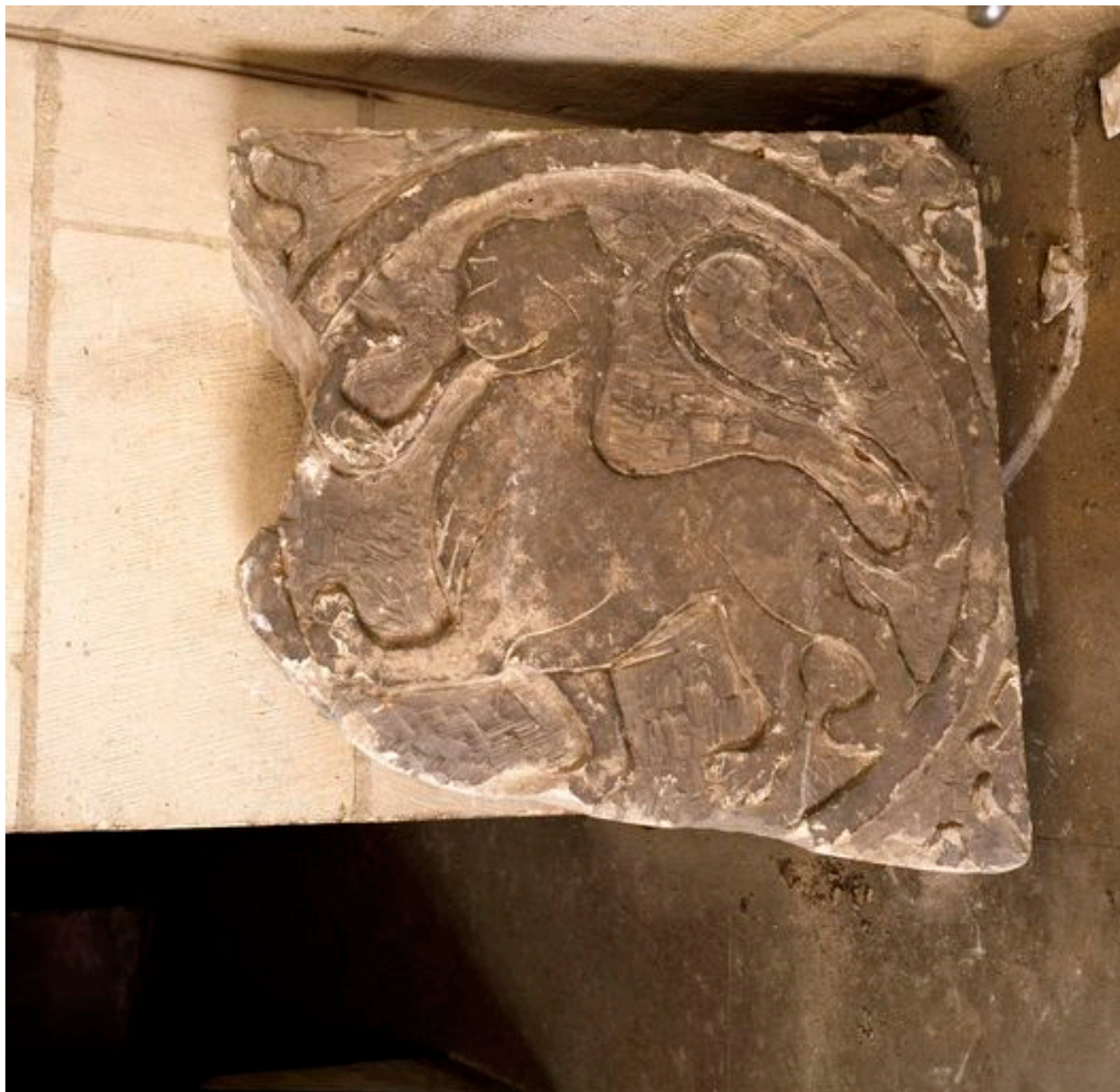
Vue d'une dalle : félin dévorant un oiseau.