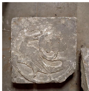
Vue d'une dalle : basilic. IVR22_20100200048XA