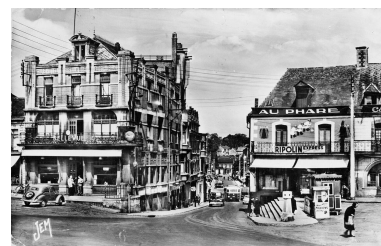
Vue de l'hôtel et perspective de la rue Marcel-Aimé. Carte postale, vers 1950. IVR31_19925901880X