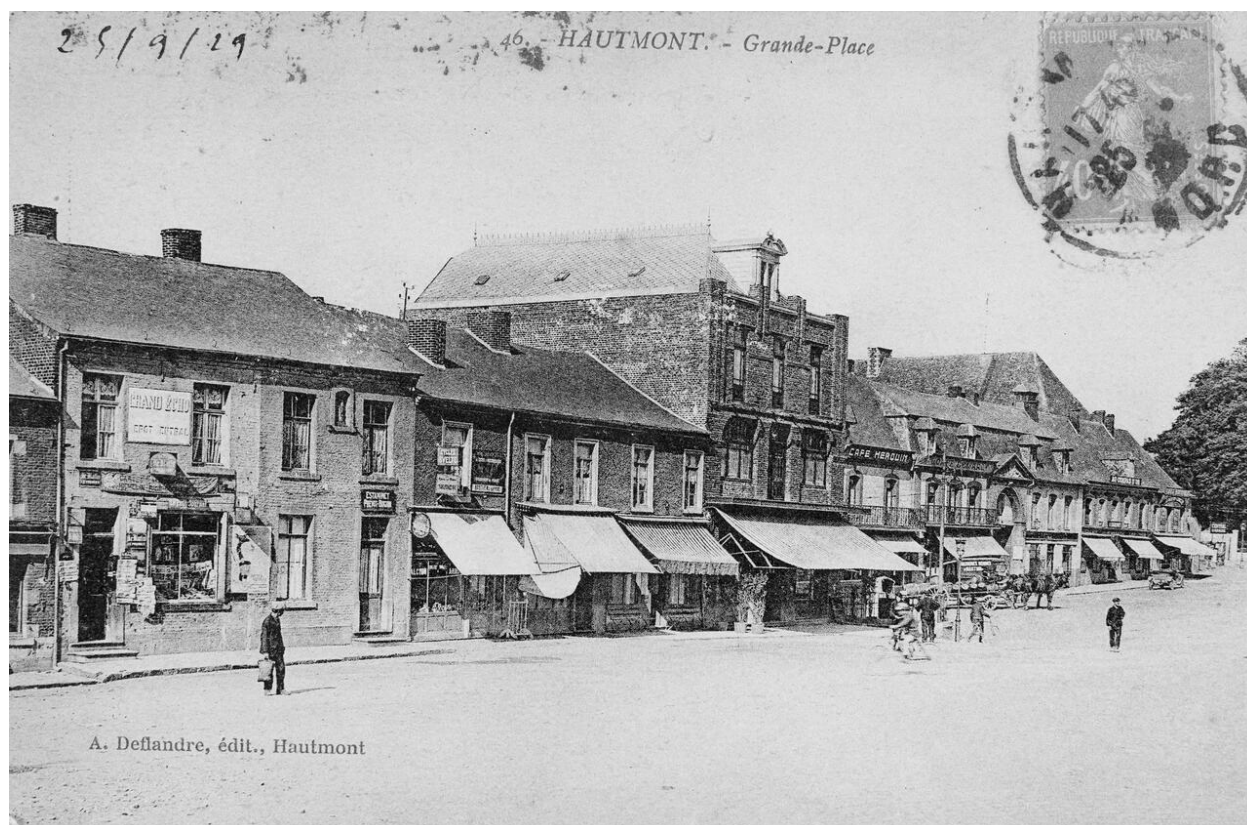
Vue de l'hôtel et de l'abbaye depuis la place de la Libération. Carte postale, début XXe siècle.