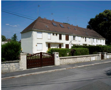
Logements collectifs de la cité de la Garenne. IVR22_20106000781XA