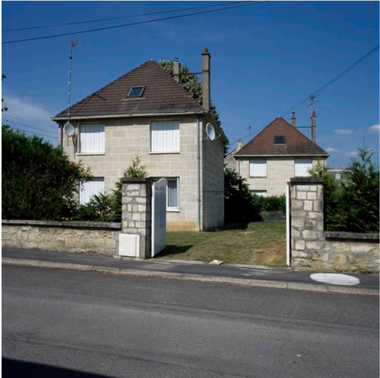
Maisons d'ingénieurs de la cité de la Garenne.