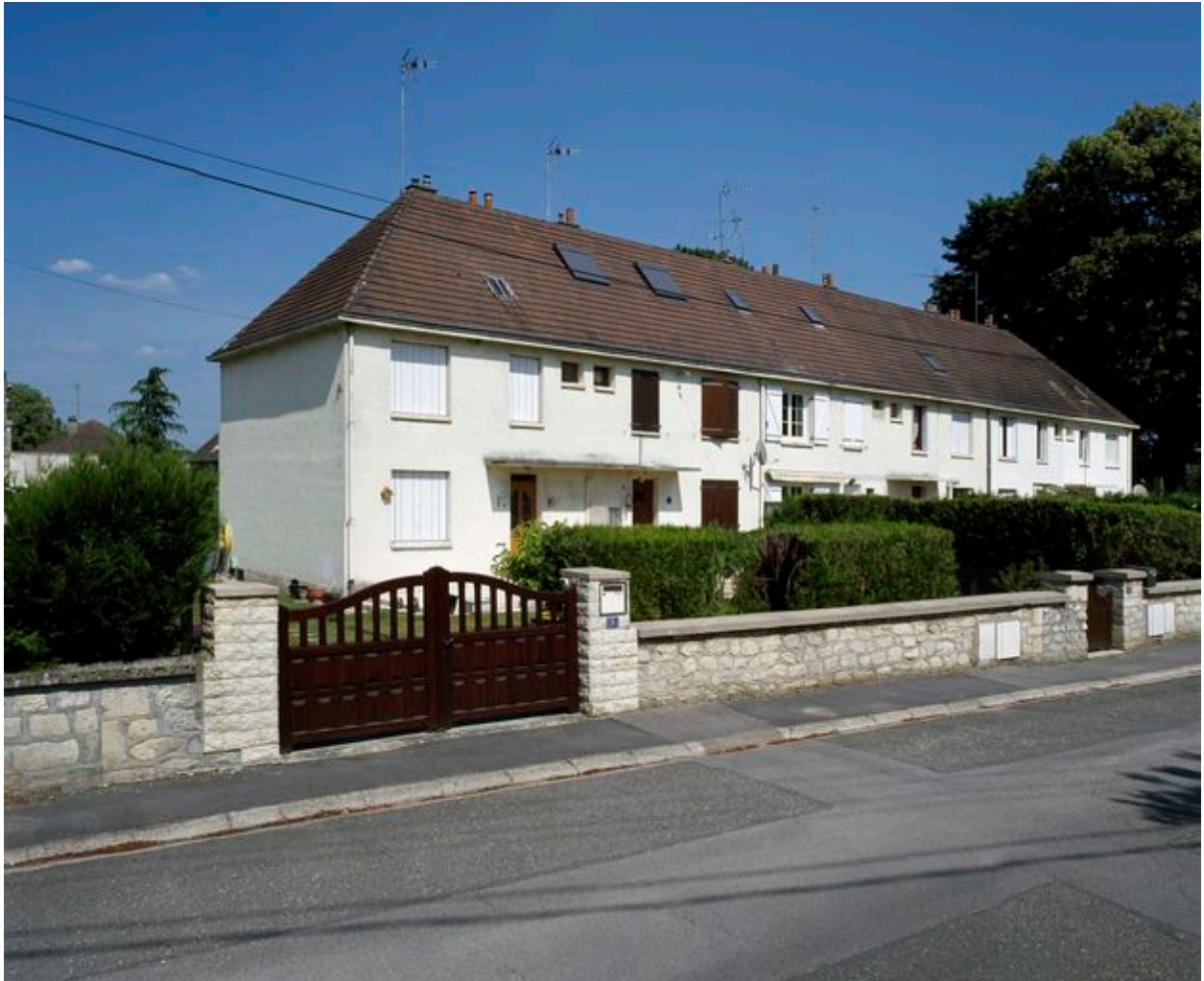
Logements collectifs de la cité de la Garenne.