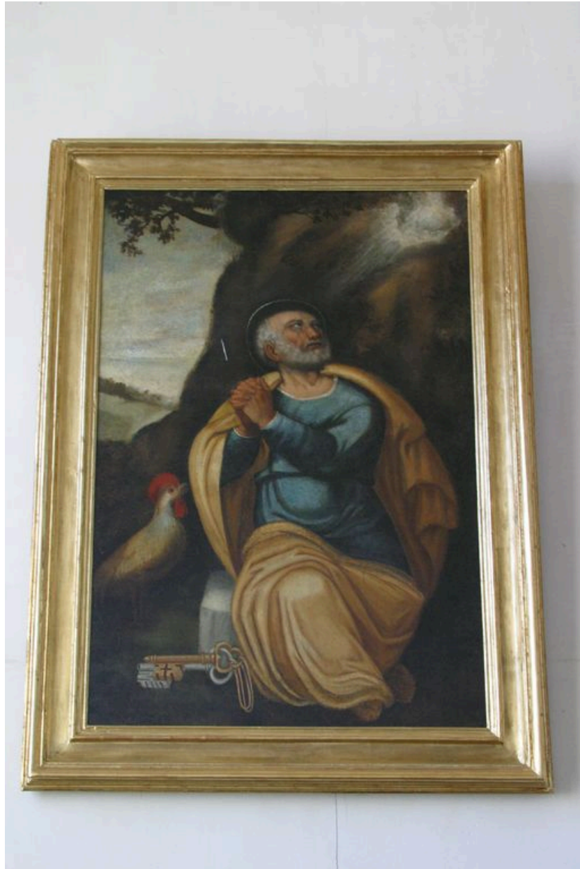
Vue du tableau de saint Pierre.