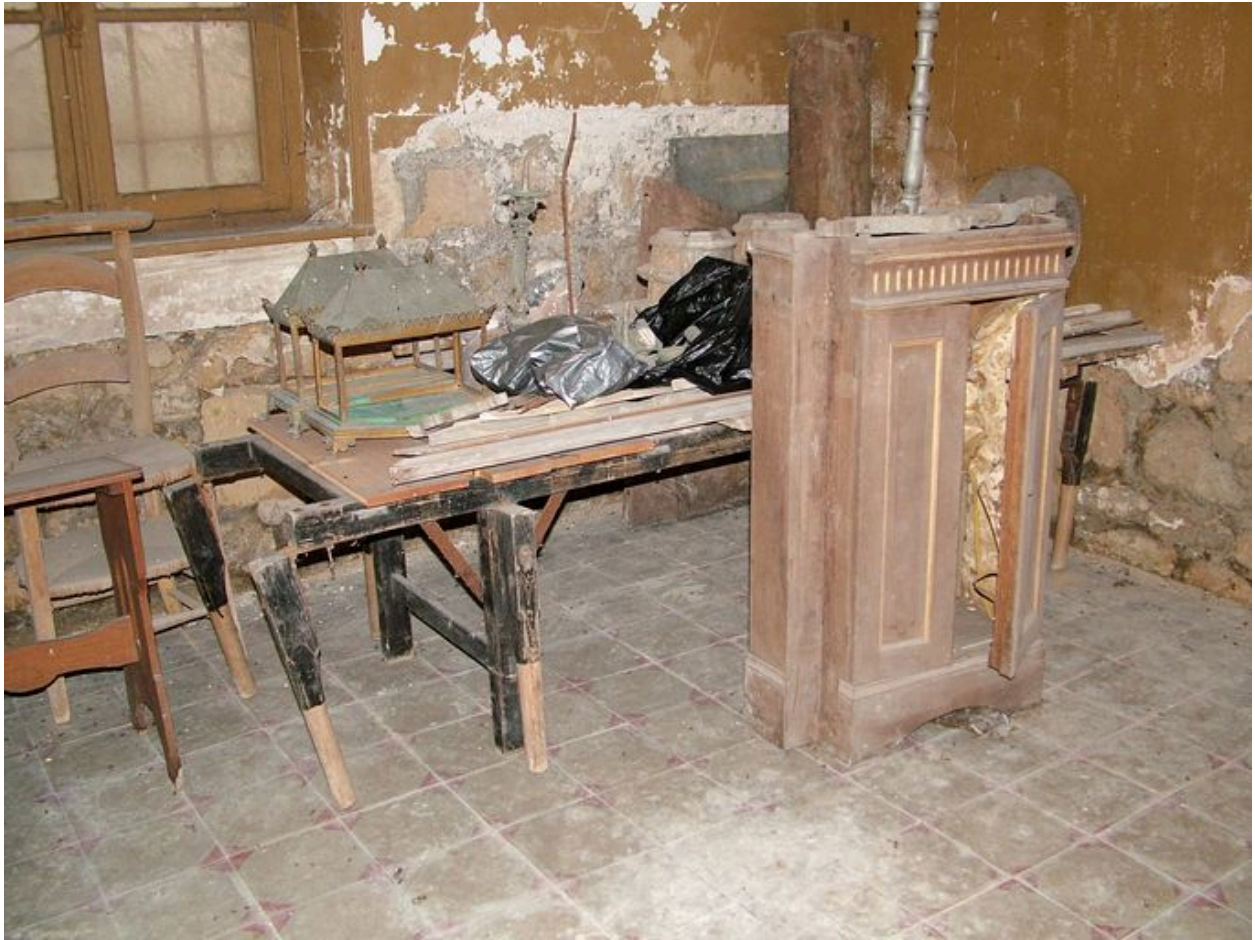
Dépôt d'objets dans la sacristie provenant de l'abbaye de Cuissy-et-Geny.