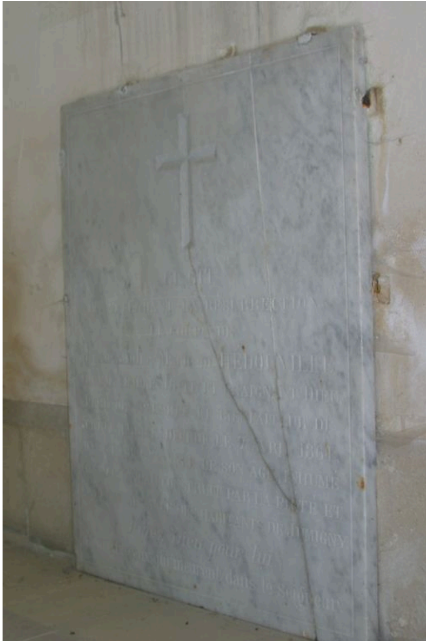
Vue de la dalle funéraire fixée au mur sud.