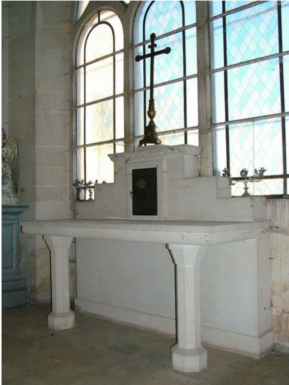
Vue du maître-autel.