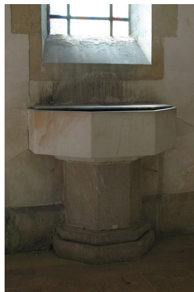
Vue des fontes baptismaux.