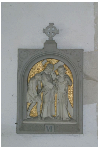
Vue d'une station du chemin de croix.