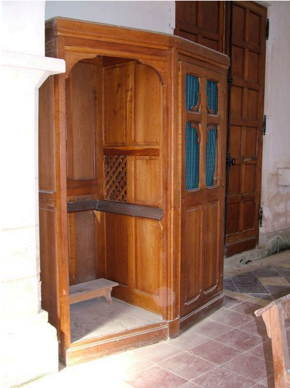
Vue du confessionnal.