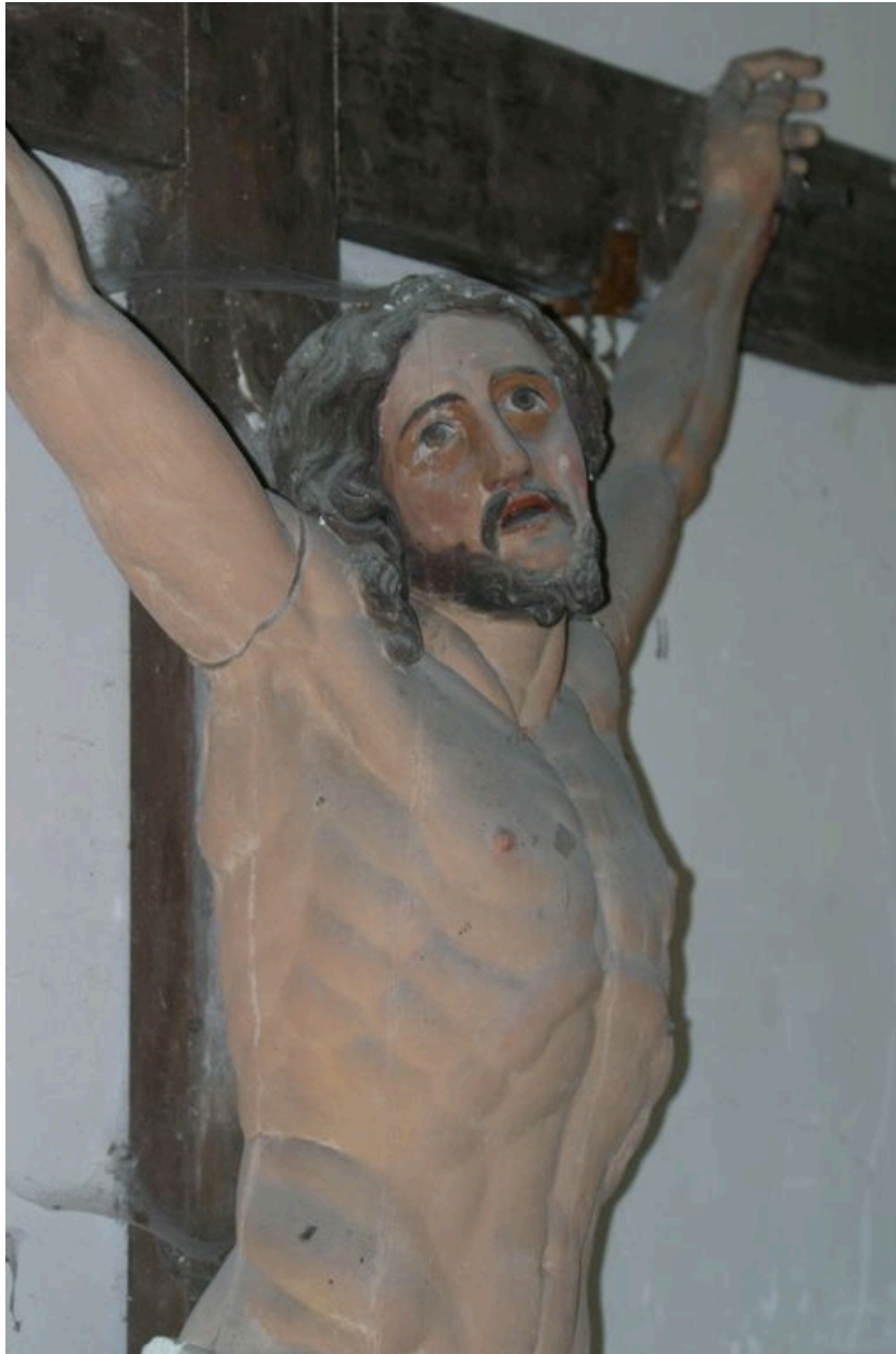
Détail du Christ en croix.