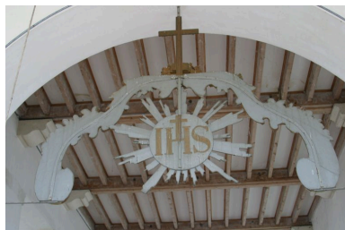
Vue antérieure de la poutre de gloire. IVR22_20030202712NUCA