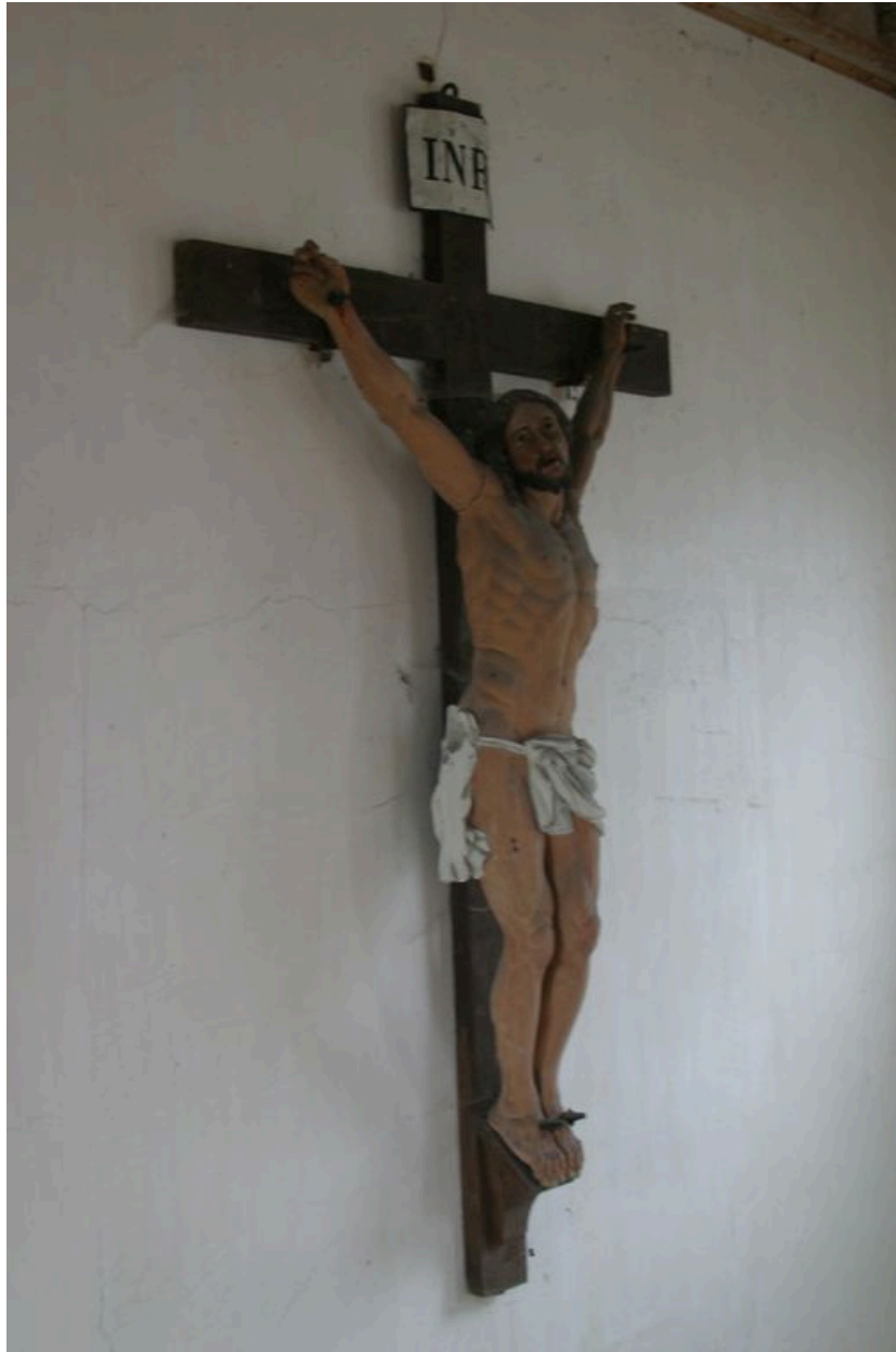
Christ en croix.