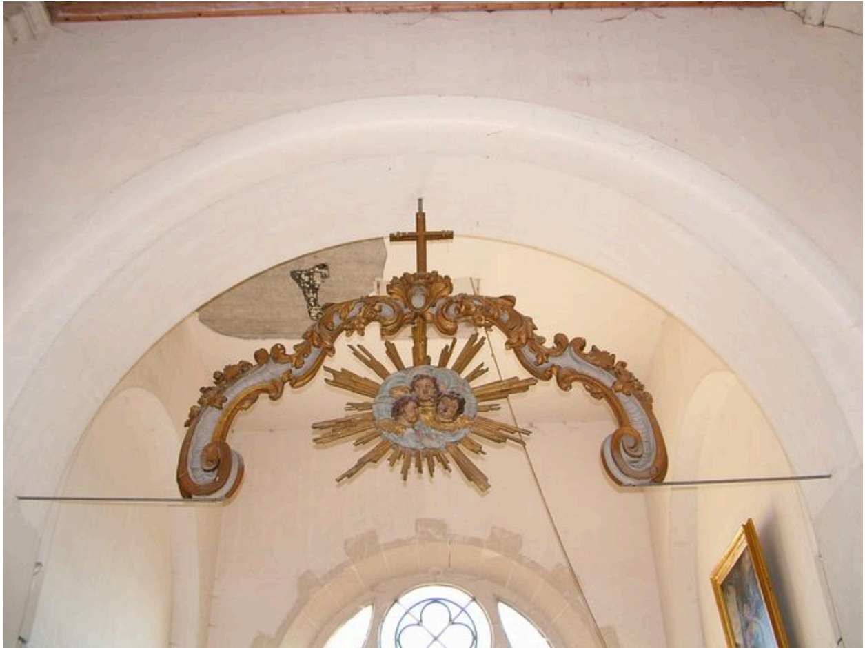
Vue de la poutre de gloire depuis la tribune.