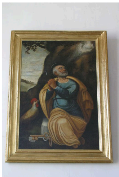
Vue du tableau de saint Pierre.