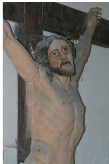
Détail du Christ en croix.