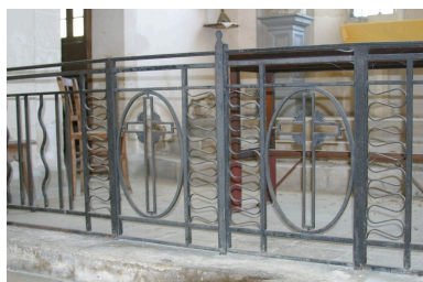
Vue de la clôture de chœur.