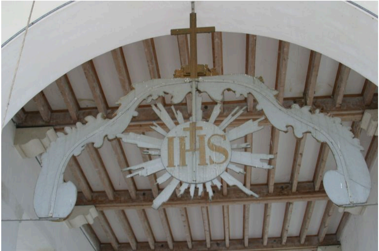
Vue antérieure de la poutre de gloire.