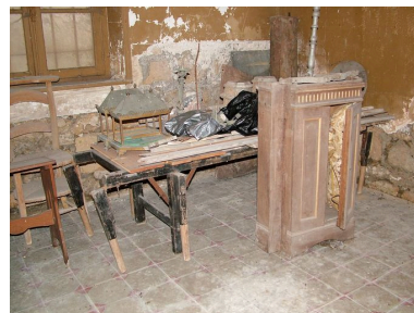
Dépôt d'objets dans la sacristie provenant de l'abbaye de Cuissy-et-Geny. IVR22_20030202715NUCA