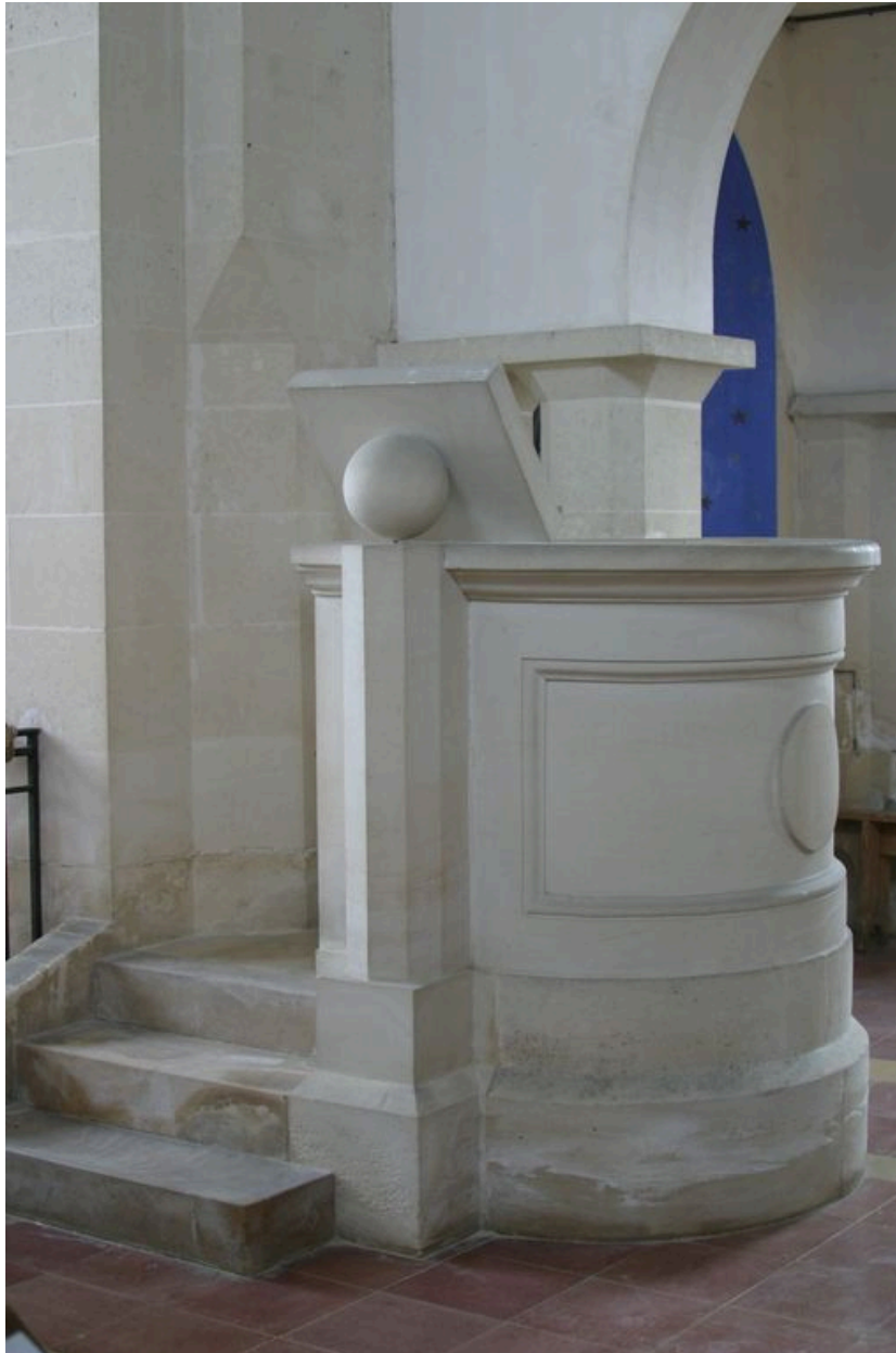
Vue de la chaire à prêcher.