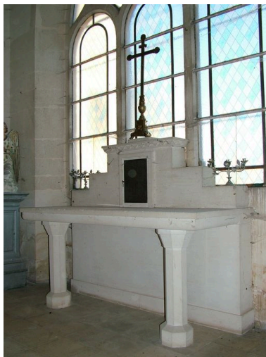
Vue du maître-autel.