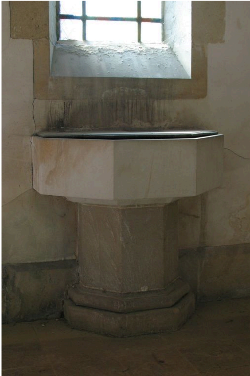
Vue des fonts baptismaux.