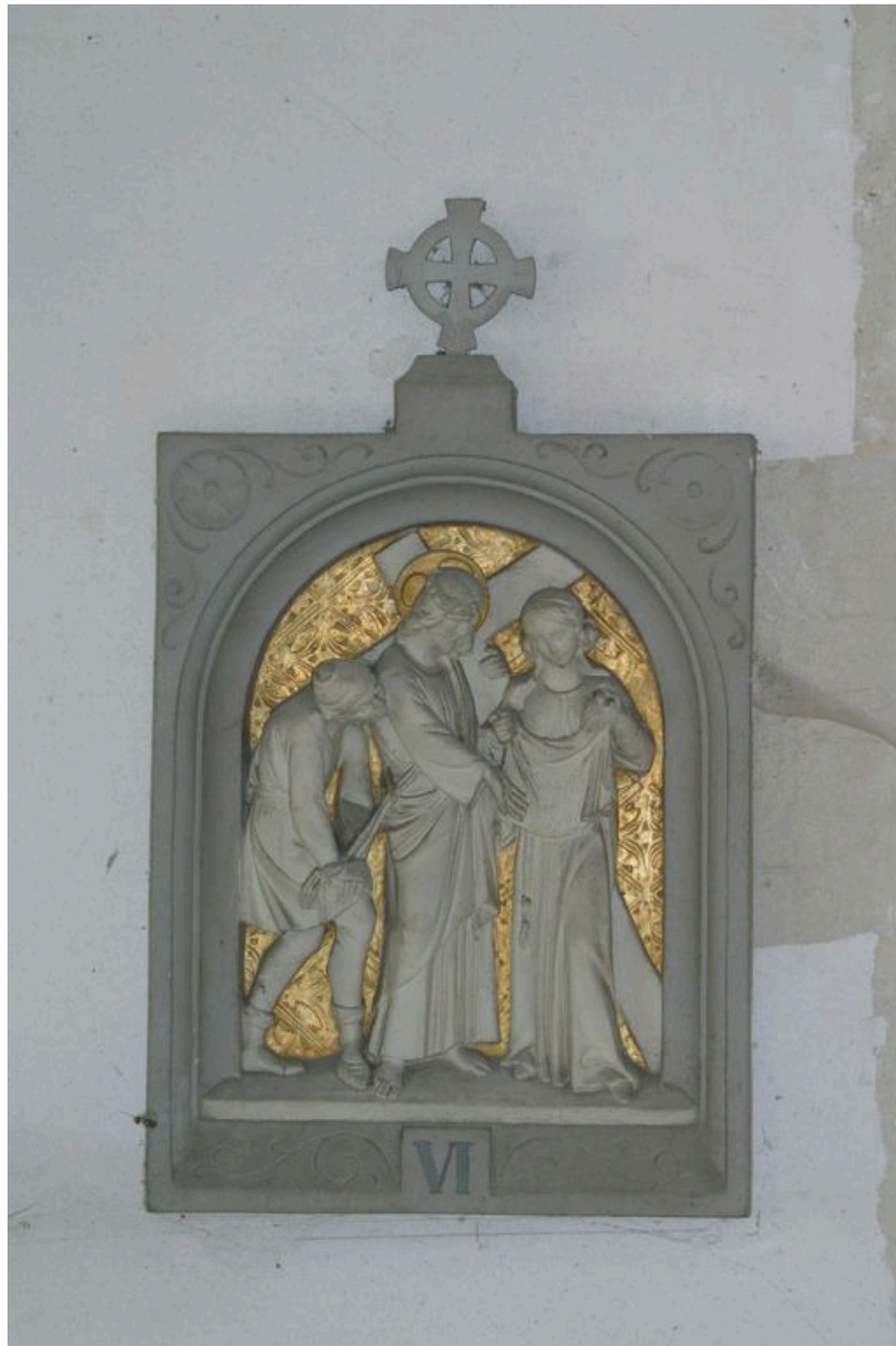
Vue d'une station du chemin de croix.