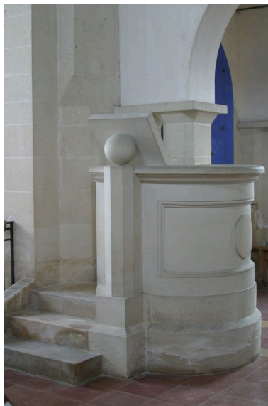
Vue de la chaire à prêcher.