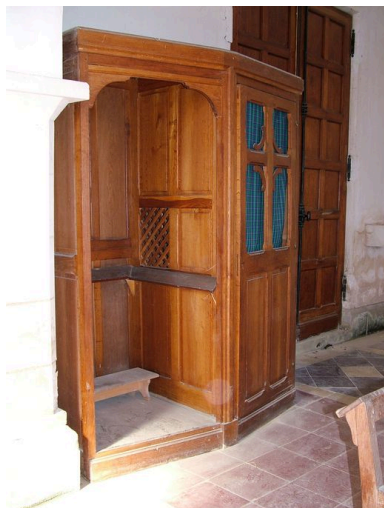
Vue du confessionnal.