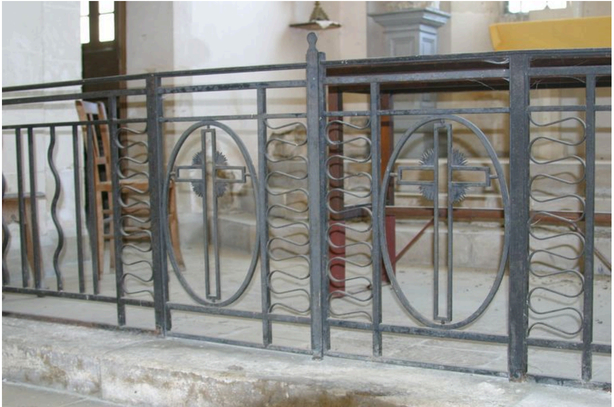
Vue de la clôture de chœur.