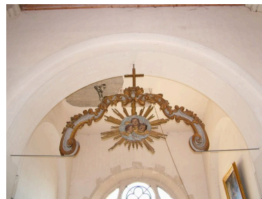
Vue de la poutre de gloire depuis la tribune. IVR22_20030202718NUCA