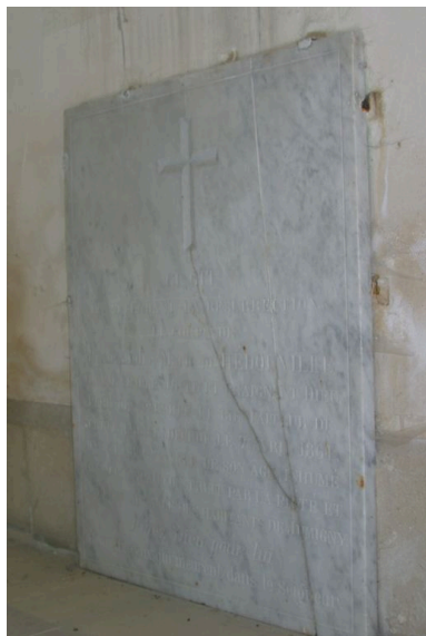
Vue de la dalle funéraire fixée au mur sud. IVR22_20050200945NUCA