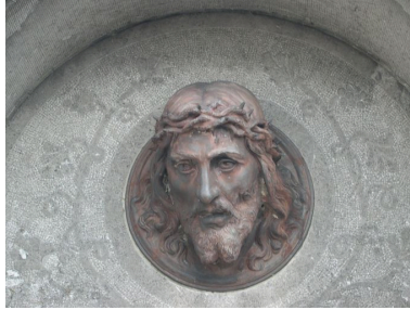
Vue de détail sur la tête de Christ. IVR22_20068011177NUCA