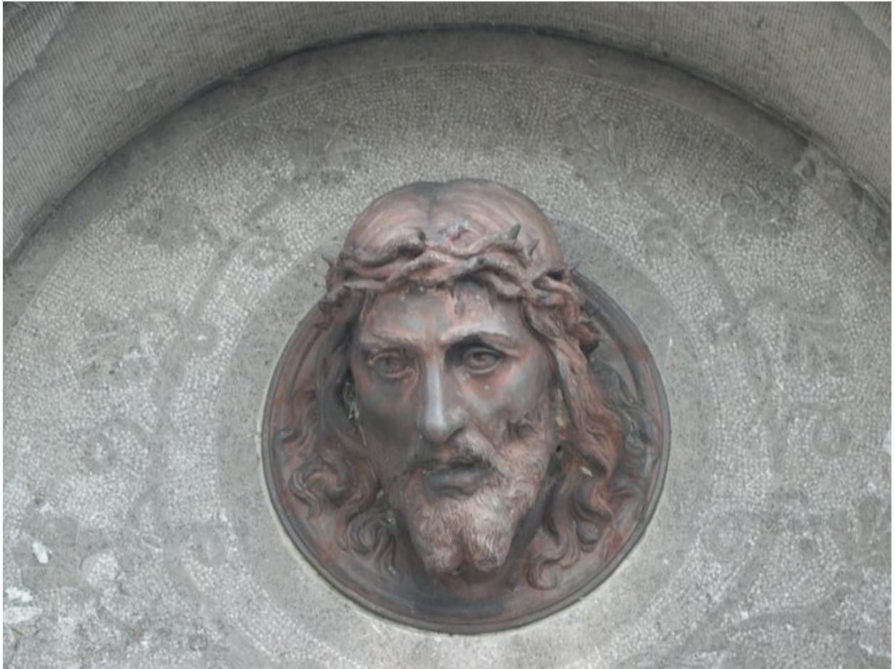
Vue de détail sur la tête de Christ.