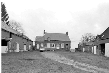
Vue générale. IVR22_19970202378Z

Plan de situation. Extrait du plan cadastre de 1986, section A.