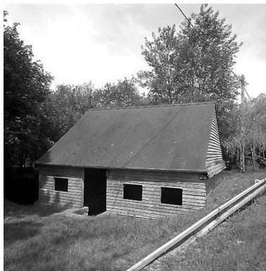
Vue générale. IVR22_20010201757X