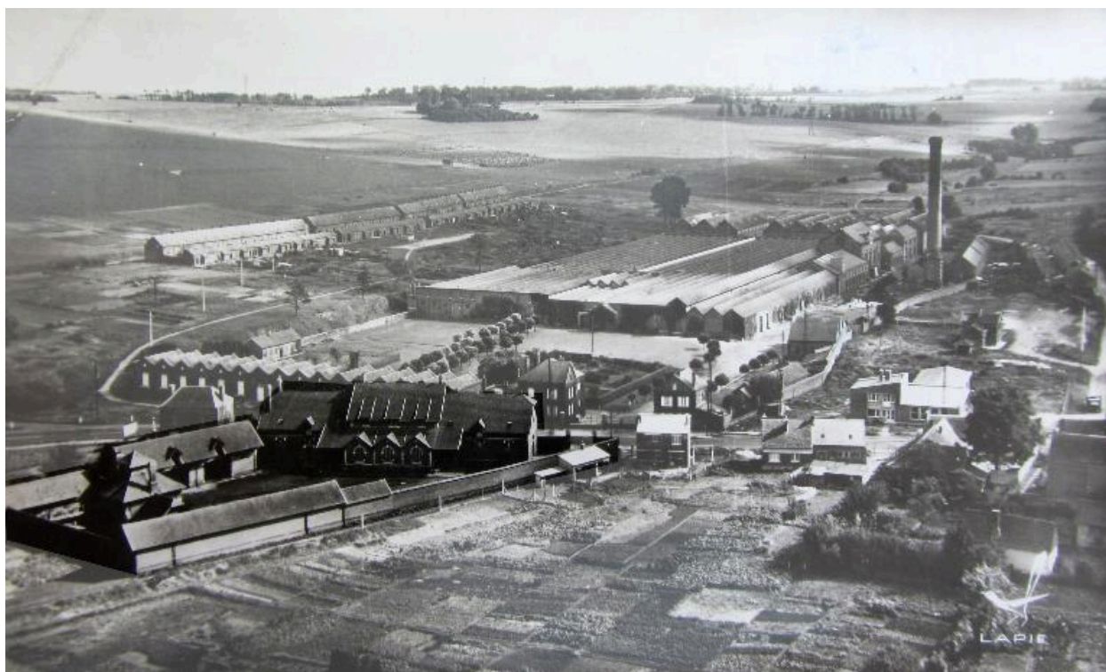
Vue aérienne de la Prévoyance, vers 1950 (coll. part.).