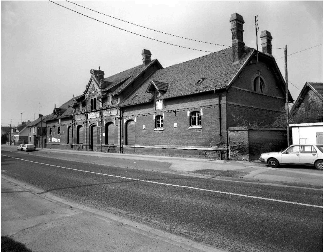
Vue d'ensemble sur rue en 1988.