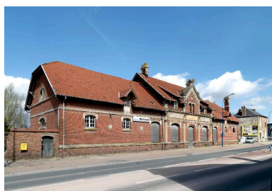
Vue d'ensemble sur rue.