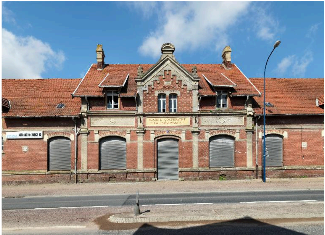
Façade sur rue, vue de face.