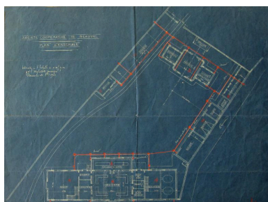
Plan au sol de la Prévoyance, 1910 (AD Somme ; 10 Fi 26). IVR22_20128005276NUCA