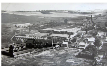
Vue aérienne de la Prévoyance, vers 1950 (coll. part.). IVR22_20138015673NUC2A