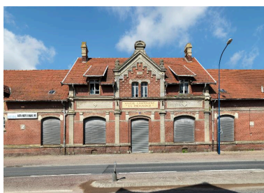
Façade sur rue, vue de face. IVR22_20138000079NUC2A