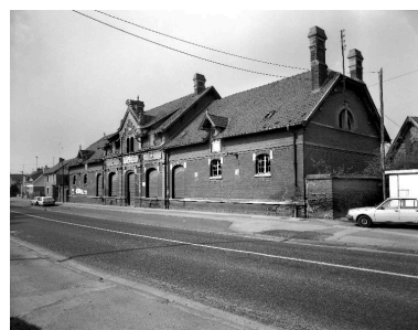
Vue d'ensemble sur rue en 1988. IVR22_19888000460V