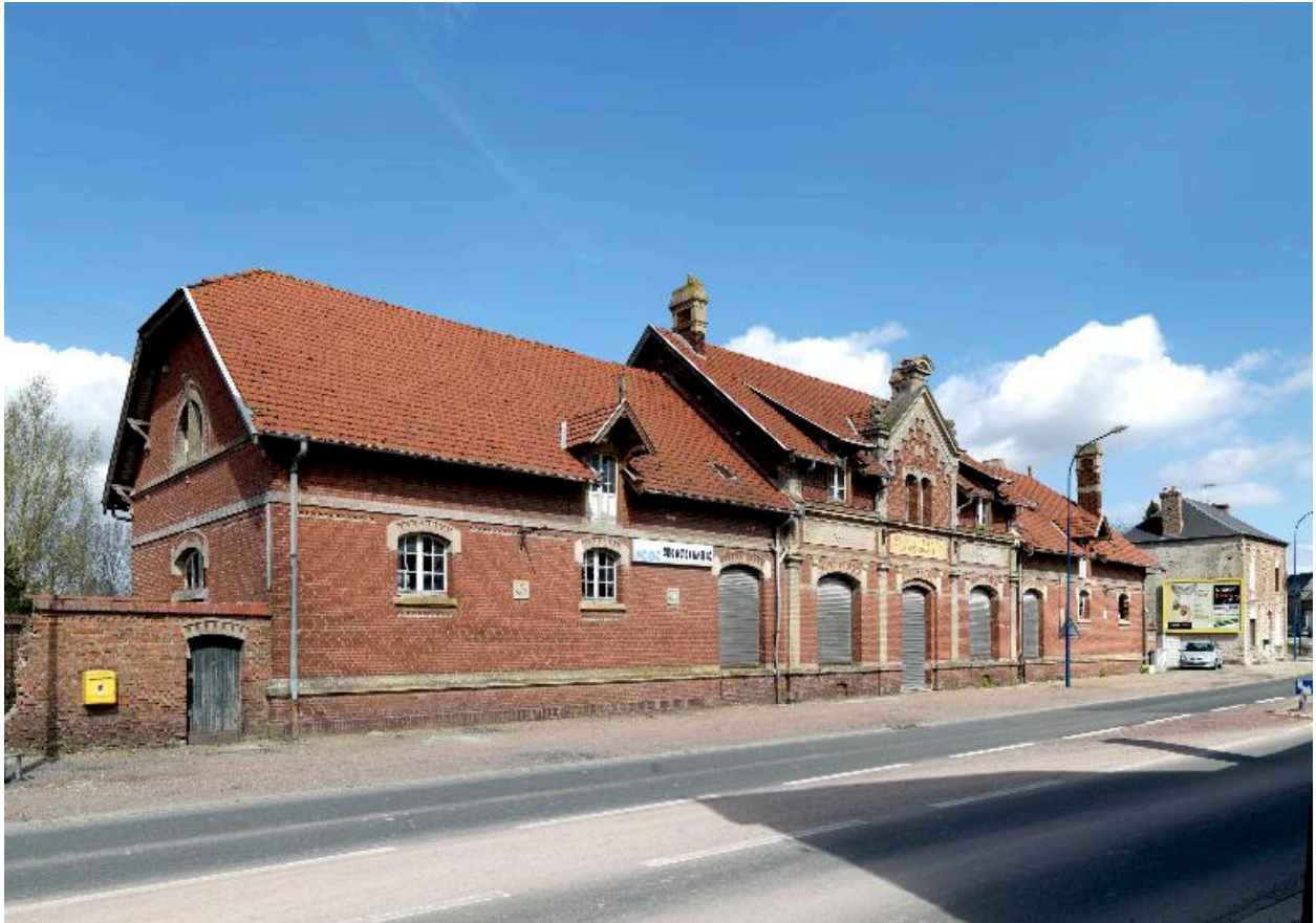
Vue d'ensemble sur rue.