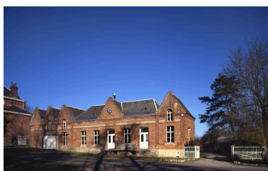
La laiterie. IVR22_19960200005VA