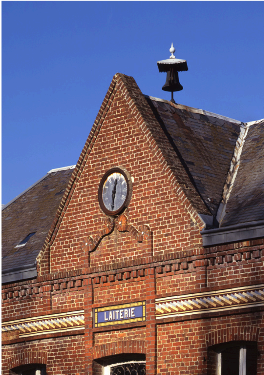
Vue de détail du fronton et de l'horloge.