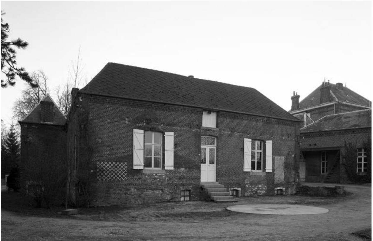
L'atelier de fabrication.