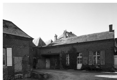
Le logement.