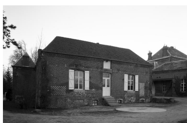
L'atelier de fabrication. IVR22_19950203286V