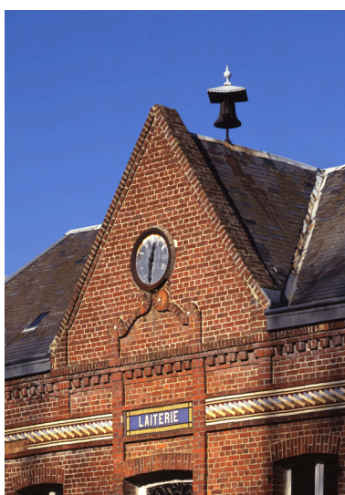
Vue de détail du fronton et de l'horloge. IVR22_19960200003XA