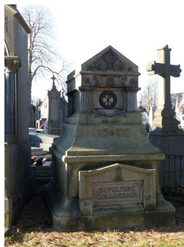
Vue de face. IVR32_20168006452NUCA