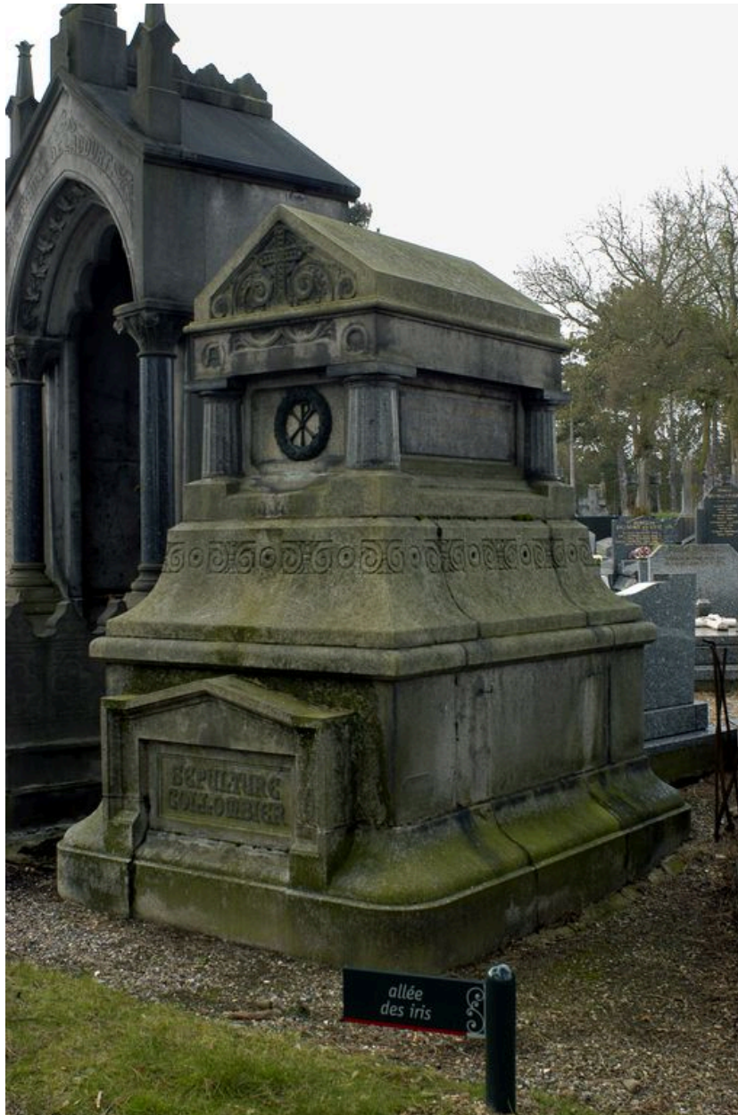
Vue générale, depuis le sud-est.