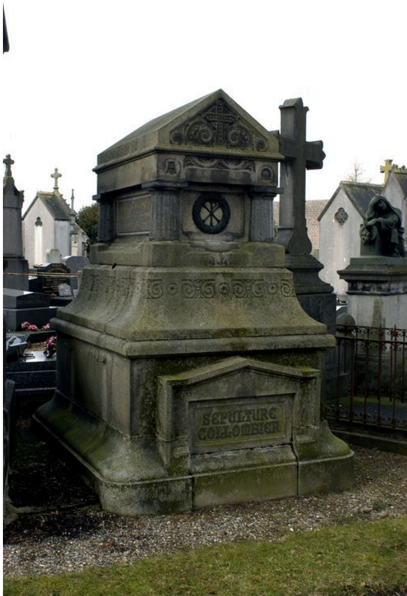
Vue générale, depuis le sud-ouest.