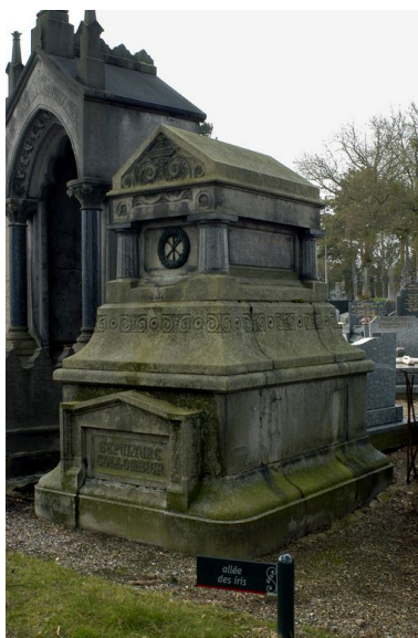
Vue générale, depuis le sud-est. IVR22_20058000223NUCA