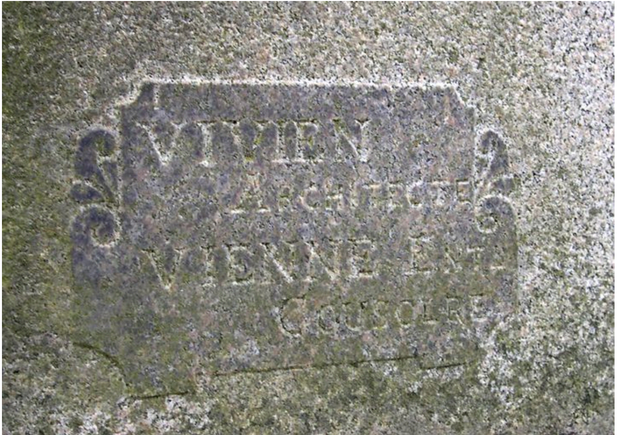
Vue de détail sur la signature.