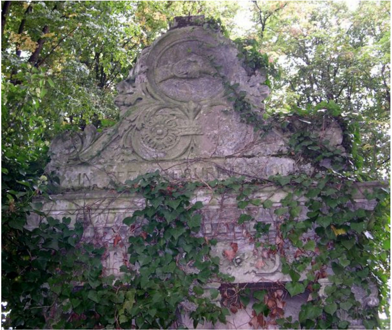
Vue de détail du fronton.