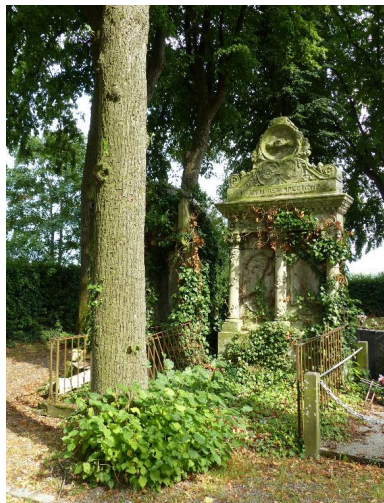
Vue générale. IVR32_20178005113NUCA