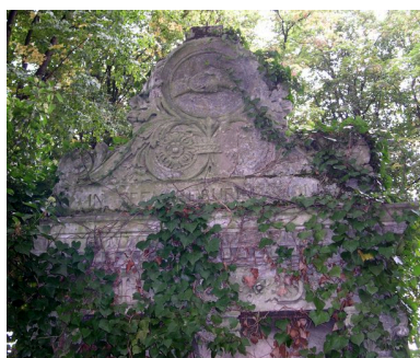
Vue de détail du fronton.