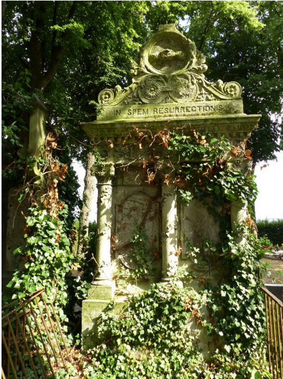
Vue de la stèle.