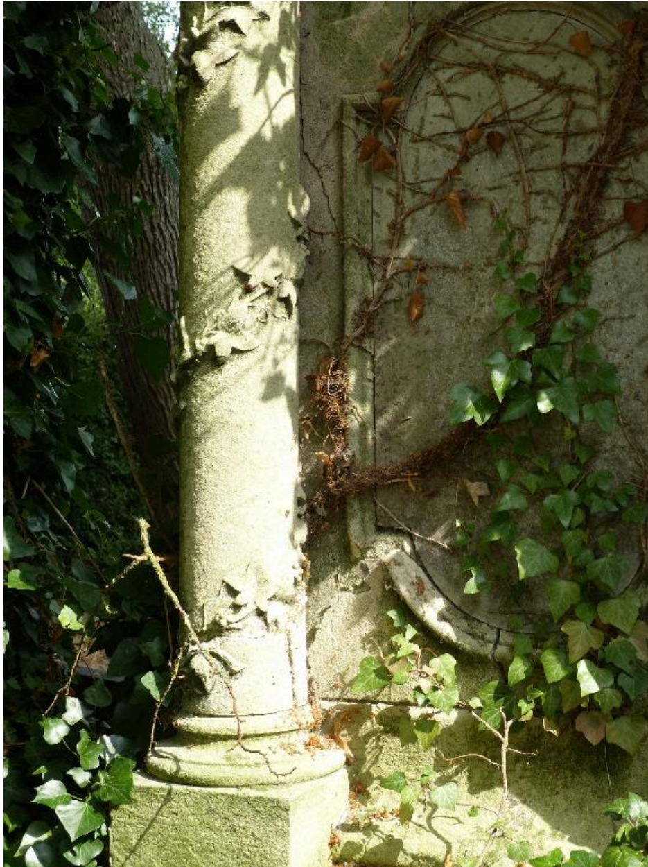
Décor végétal des colonnes.