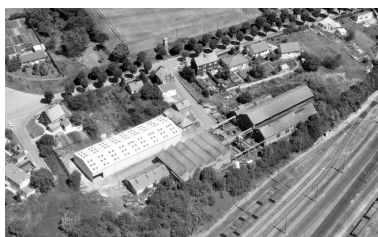
Vue aérienne, flanc sud-ouest.