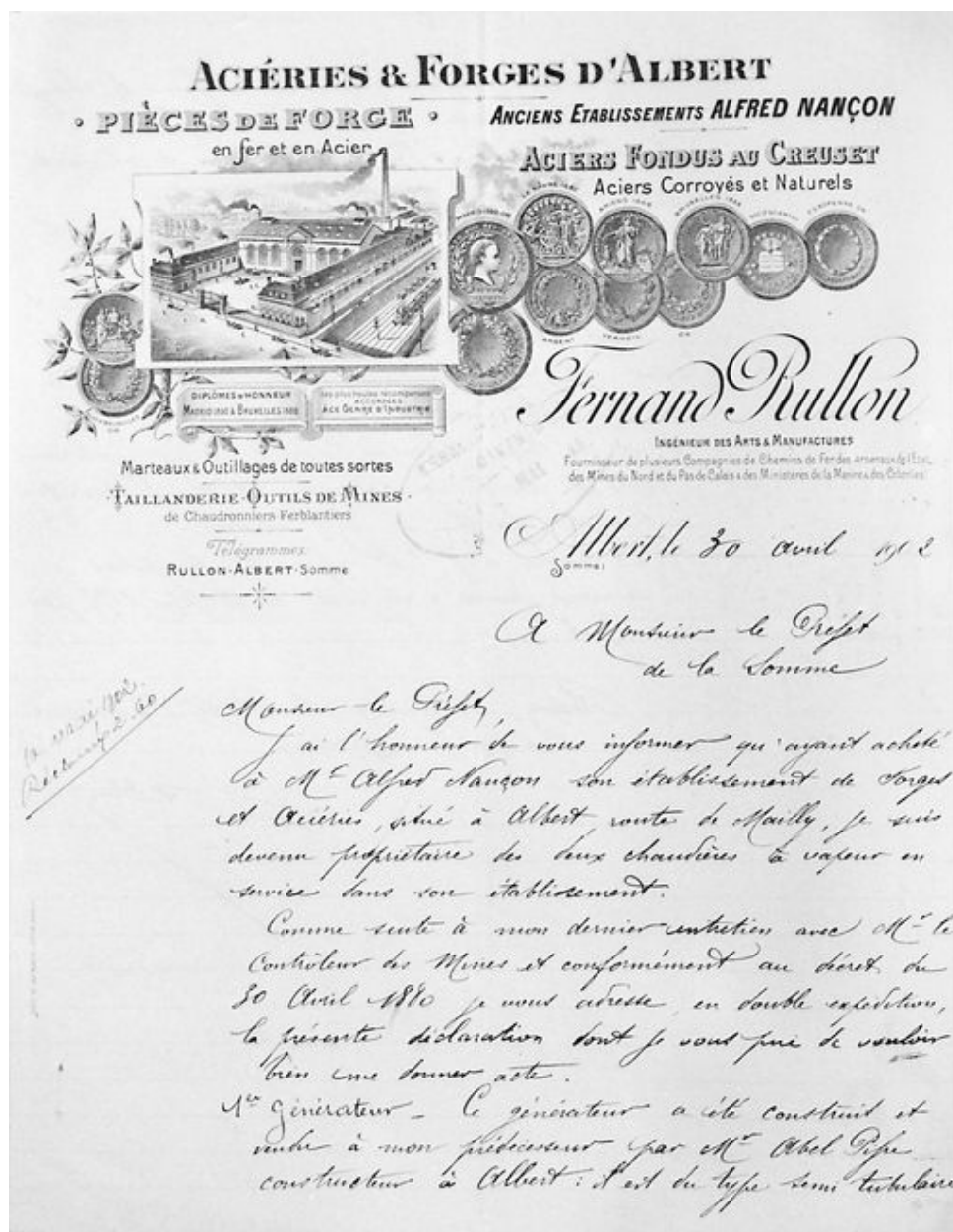
En-tête commercial des Acières et Forges d'Albert, Fernand Roullon (AD Somme ; M 96857).