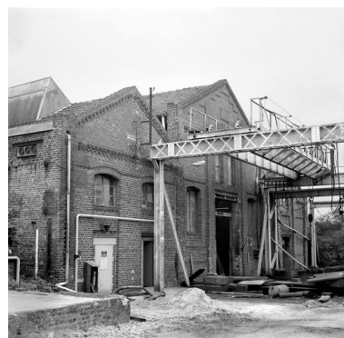
Atelier de fabrication 1, flanc ouest. IVR22_19908001517X