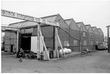
Atelier de fabrication 2, flanc nord-ouest. IVR22_19908000996Z