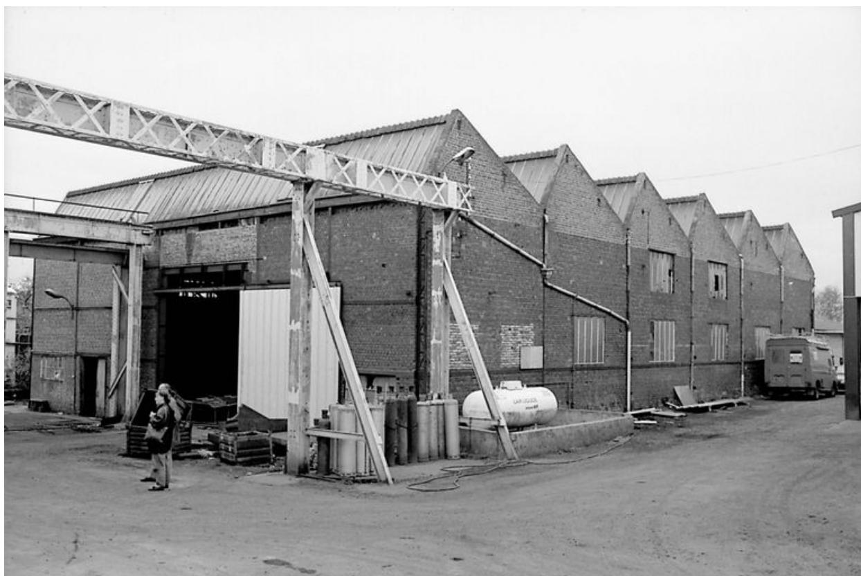
Atelier de fabrication 2, flanc nord-ouest.