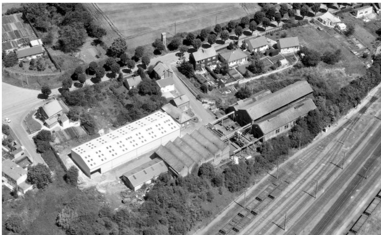
Vue aérienne, flanc sud-ouest.