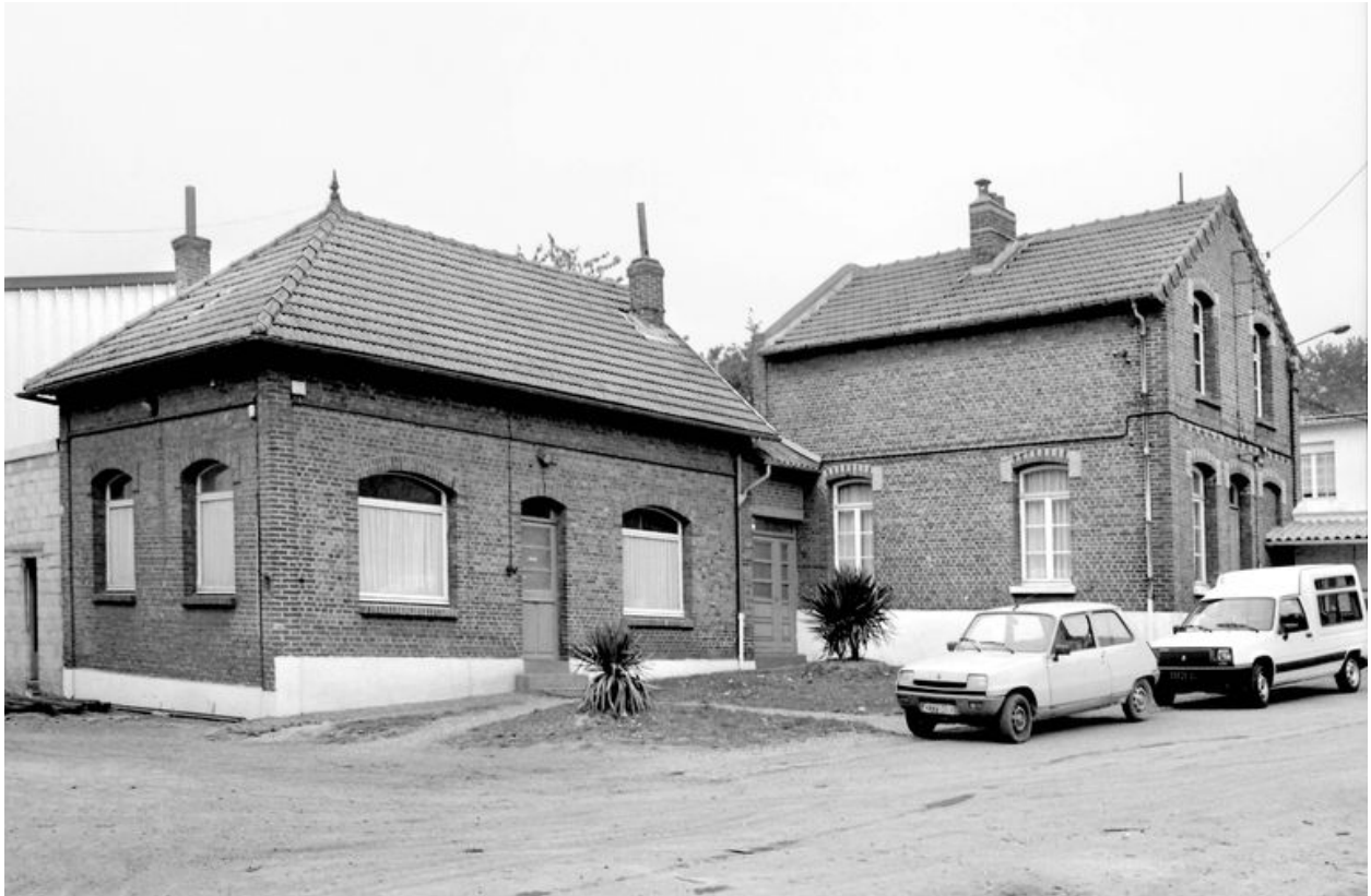
Bureau, flanc est.