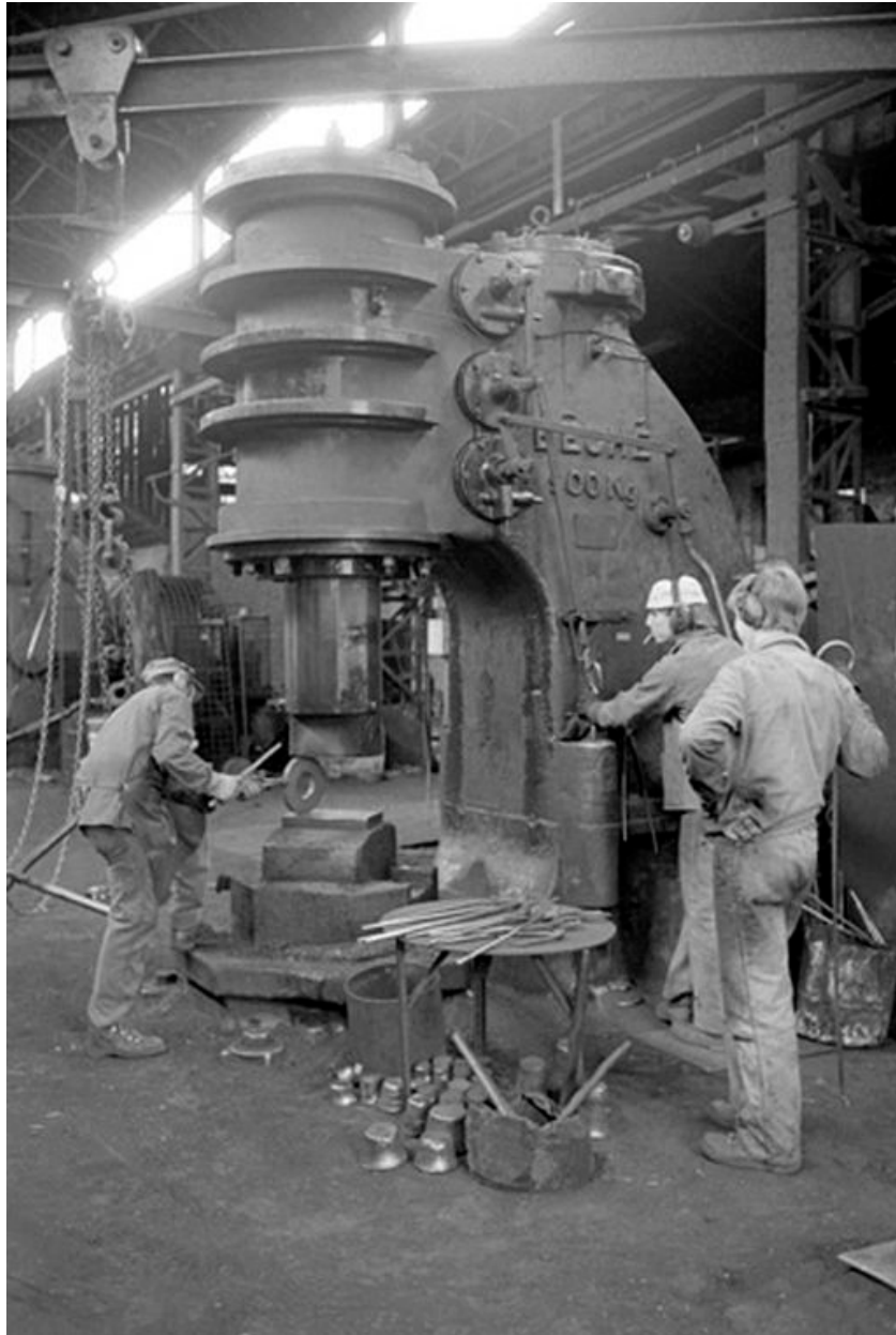
Atelier de fabrication, vue intérieure : presse.