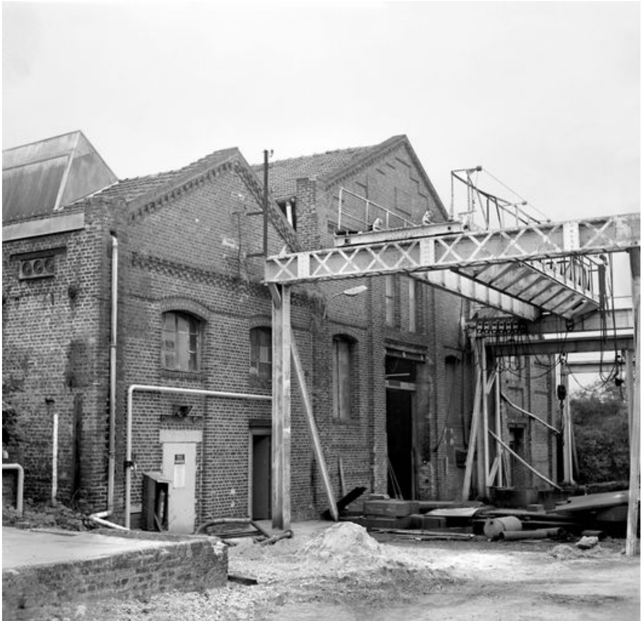
Atelier de fabrication 1, flanc ouest.