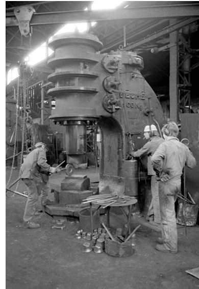
Atelier de fabrication, vue intérieure : presse. IVR22_19908000999Z