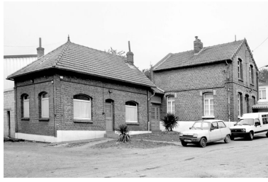
Bureau, flanc est. IVR22_19908000997Z