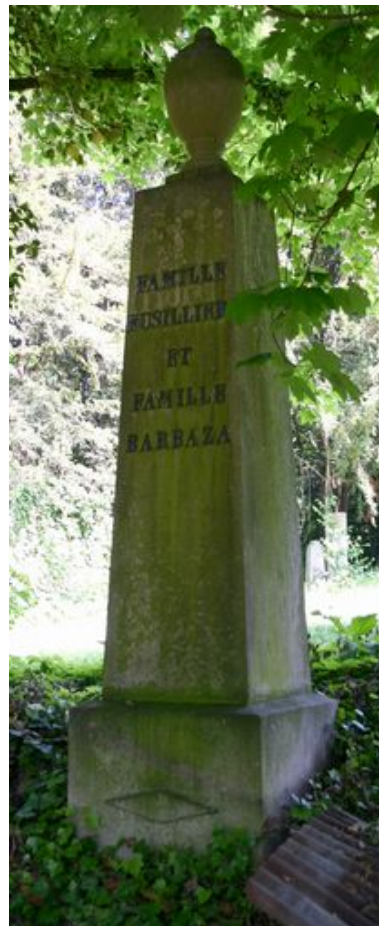
Obélisque, vers 1875. IVR22_20088000666NUCA