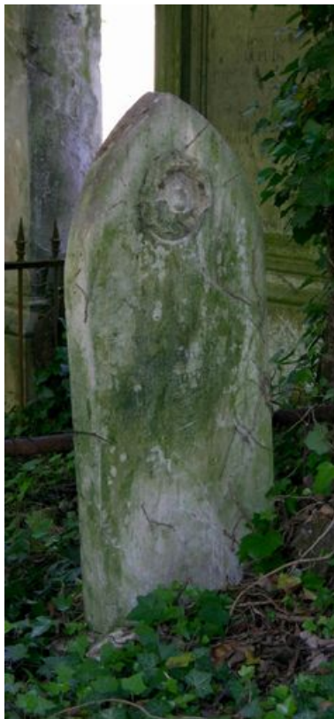
Stèle néogothique, vers 1841.