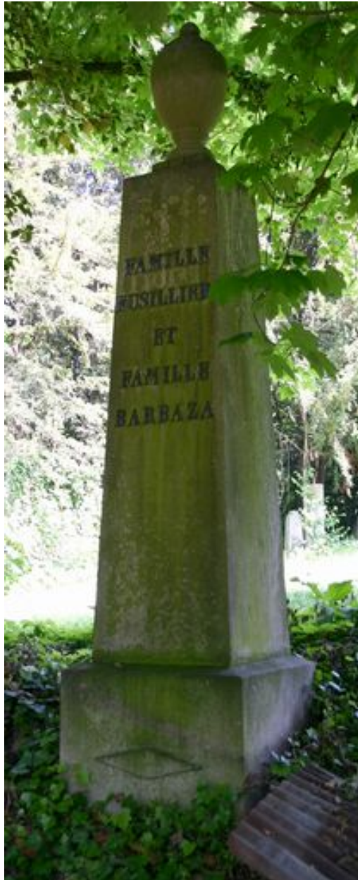
Obélisque, vers 1875.