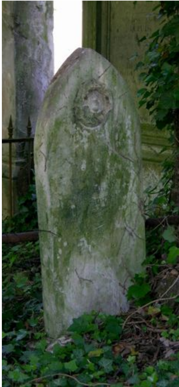
Stèle néogothique, vers 1841.