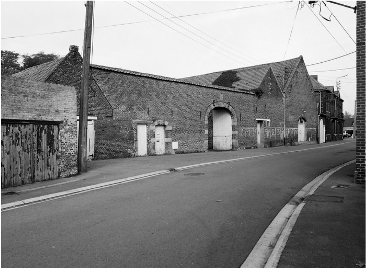
Presbytère, 95, rue Alexandre-Dubois, vue générale.