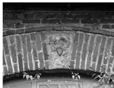
Clé avec armoiries sur l'arc du passage traversant de l'ancienne grange.