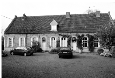
Vue générale du logis. IVR31_20045900689X