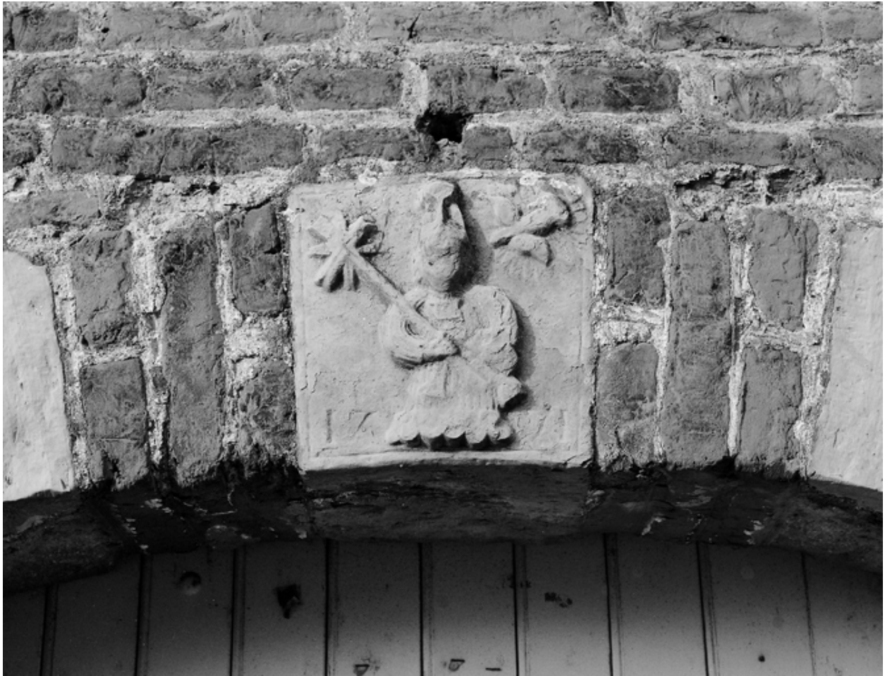
La clé du portail portant les armoiries.