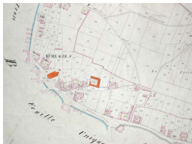
Cadastré de 1830, détail de la feuille D2 (AD Nord : P31/626).