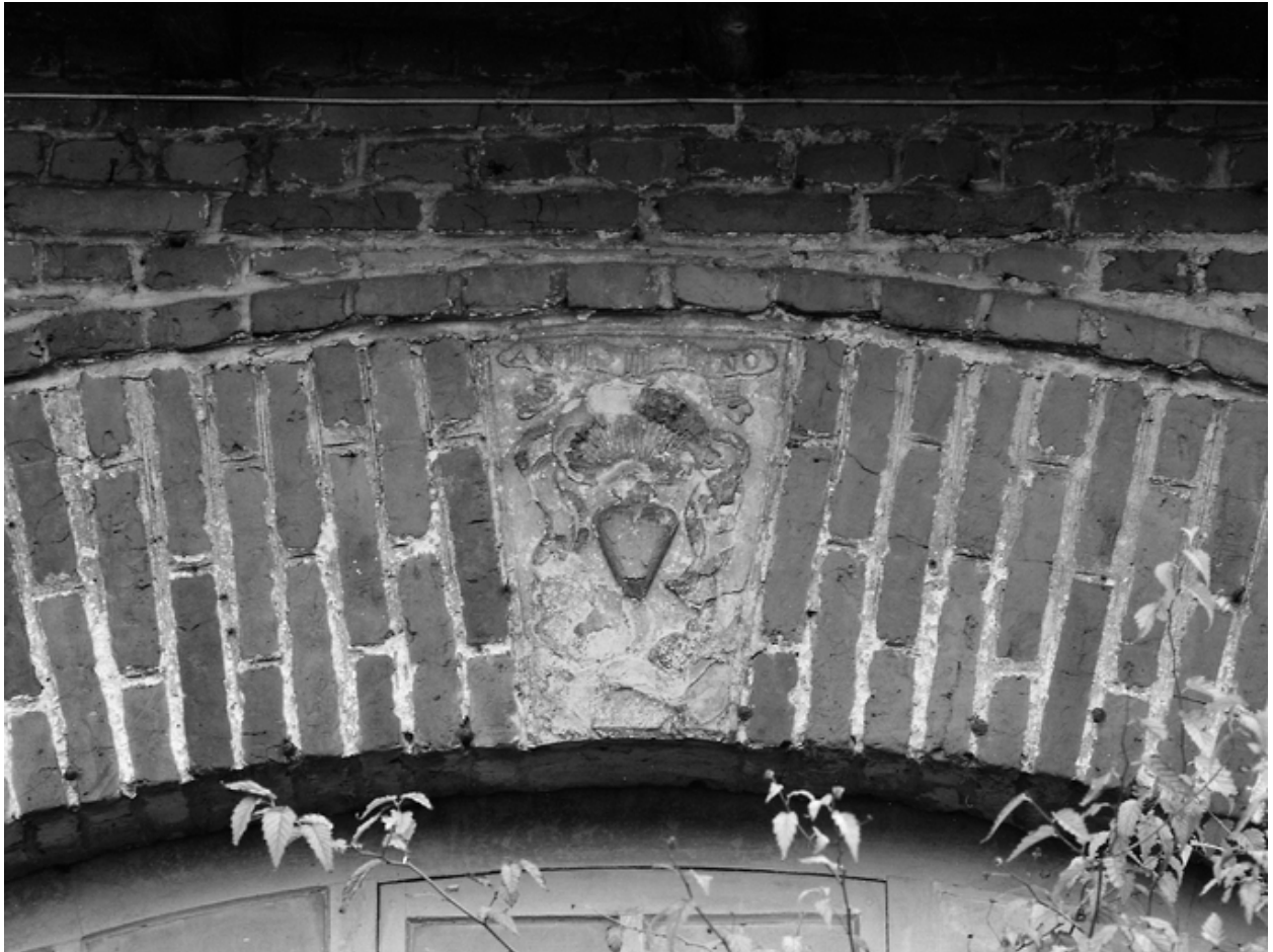
Clé avec armoiries sur l'arc du passage traversant de l'ancienne grange.