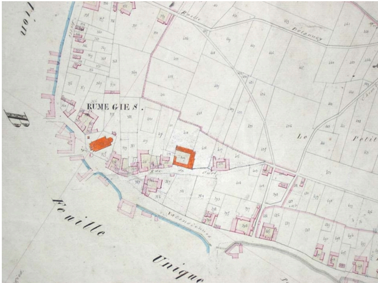
Cadastre de 1830, détail de la feuille D2 (AD Nord : P31/626).