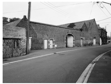
Presbytère, 95, rue Alexandre-Dubois, vue générale.