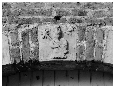
La clé du portail portant les armoiries.