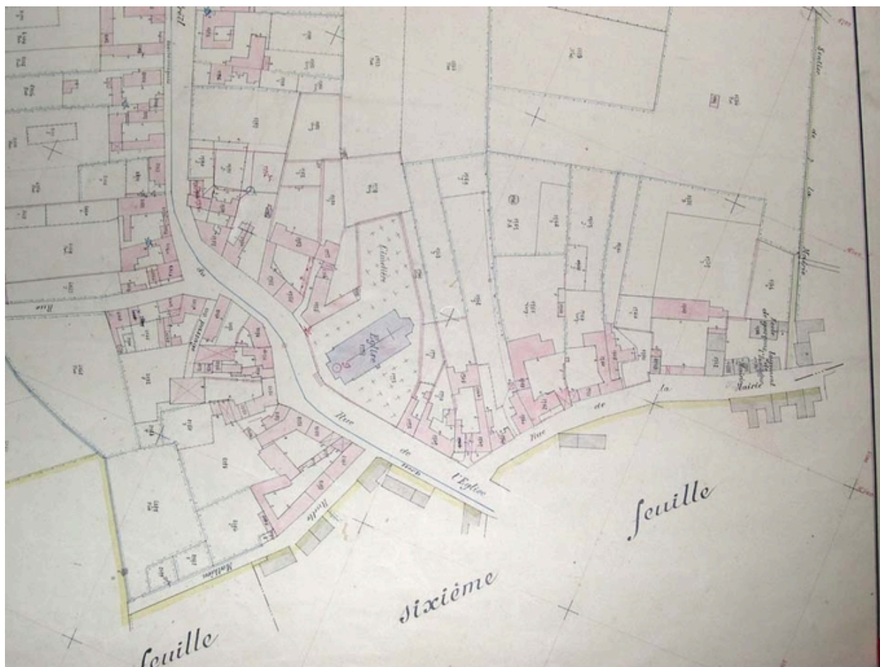
Plan de situation. Cadastre de 1913, 5e feuille, extrait (AD Nord : P31/626).