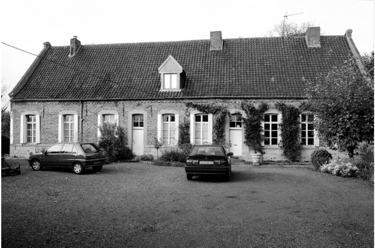
Vue générale du logis.