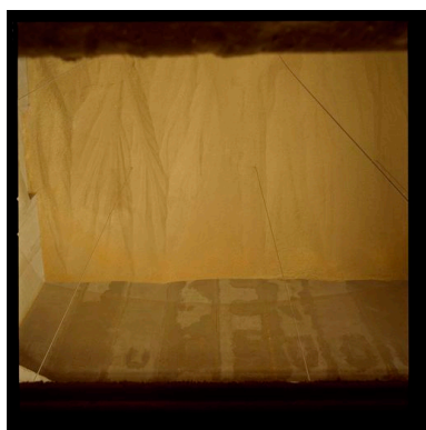
Vue plongeante sur l'une des cellules de stockage à demie remplie de grains.