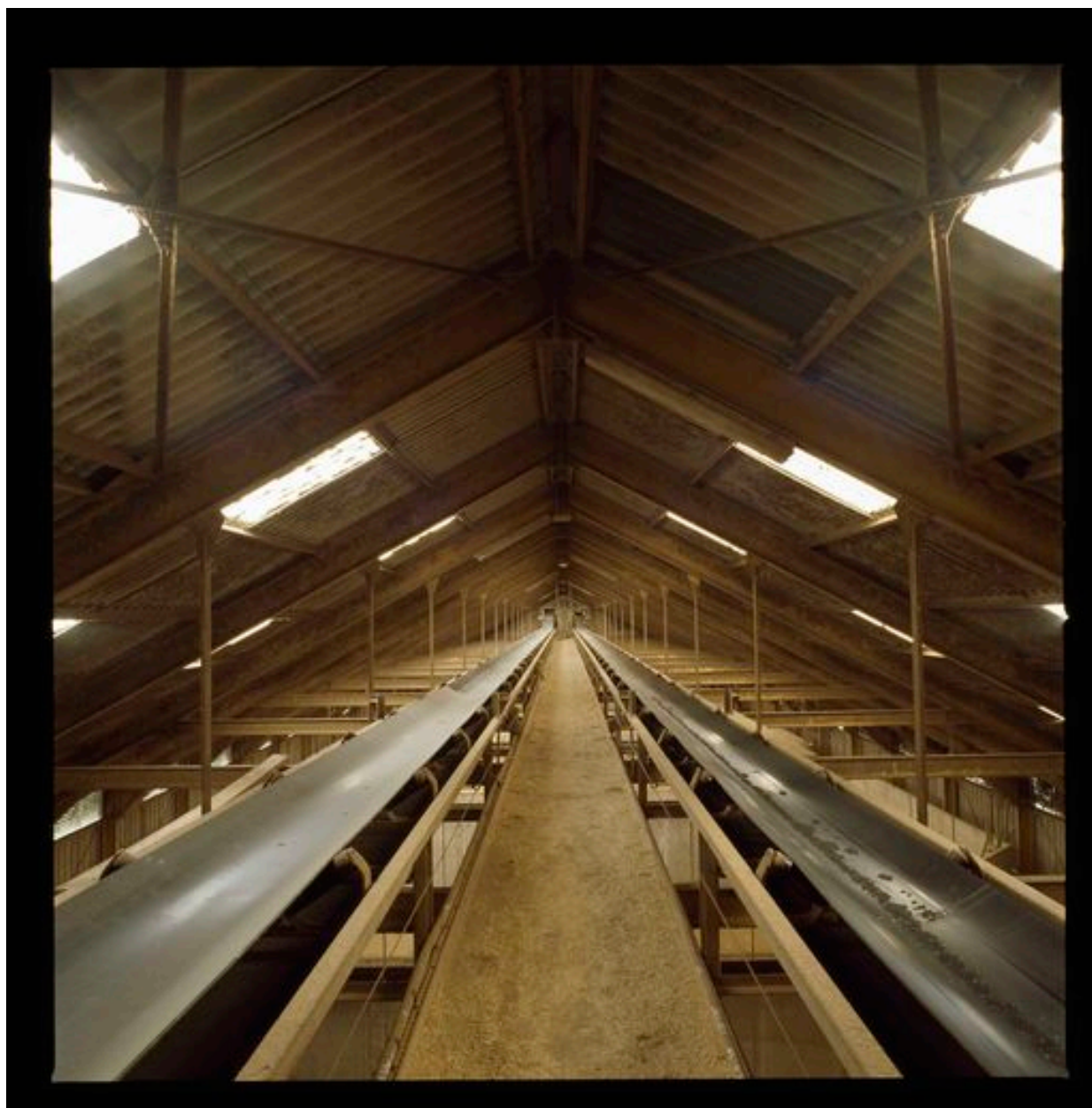
Vue intérieure du bâtiment abritant les 4 cases de stockage à plat (12000 tonnes).