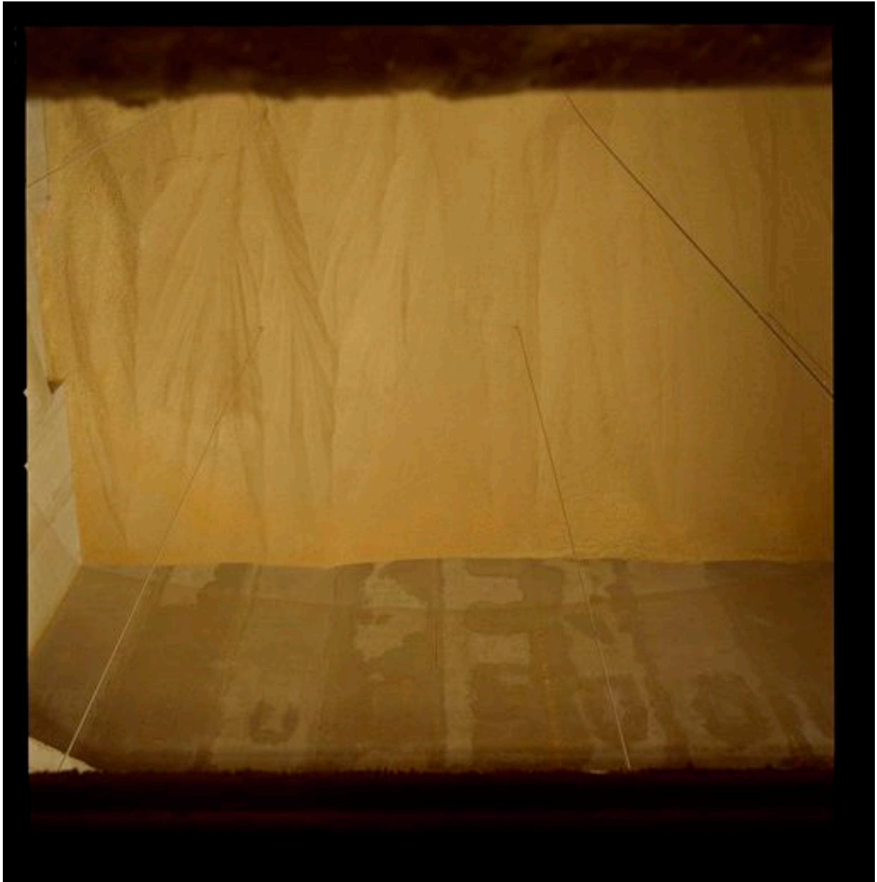
Vue plongeante sur l'une des cellules de stockage à demie remplie de grains.