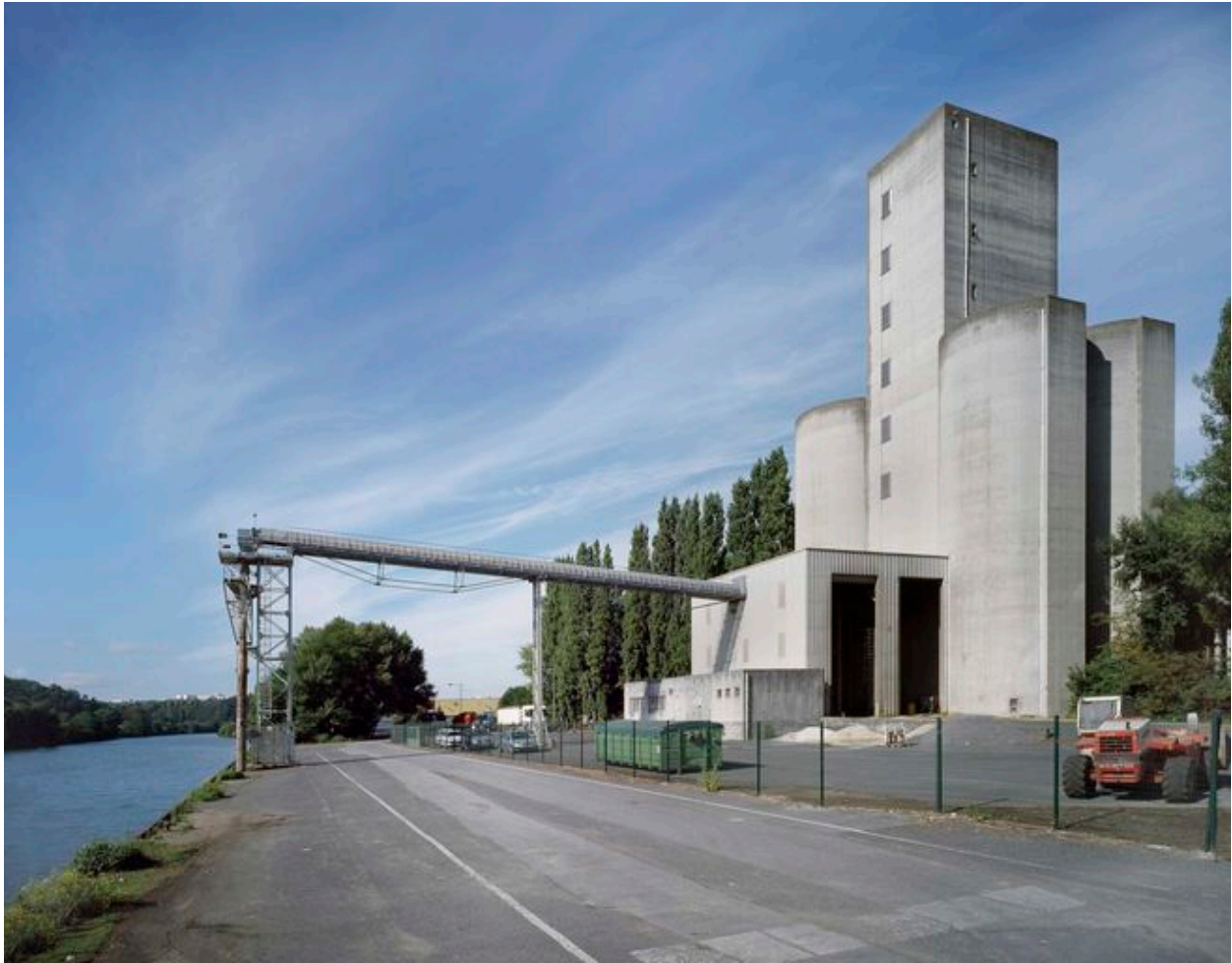
Vue générale du silo de Nogent-sur-Oise