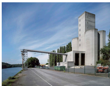
Vue générale du silo de Nogent-sur-Oise