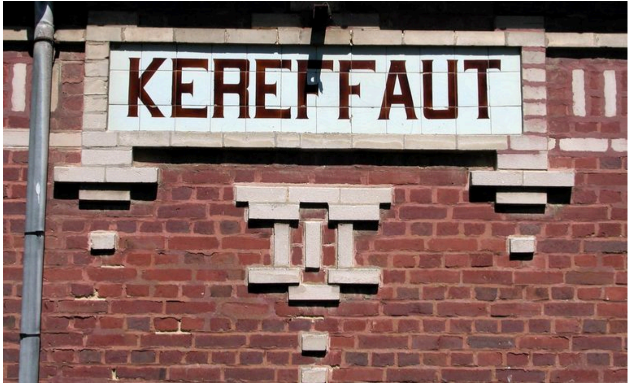
Détail de l'appellation, élévation antérieure.