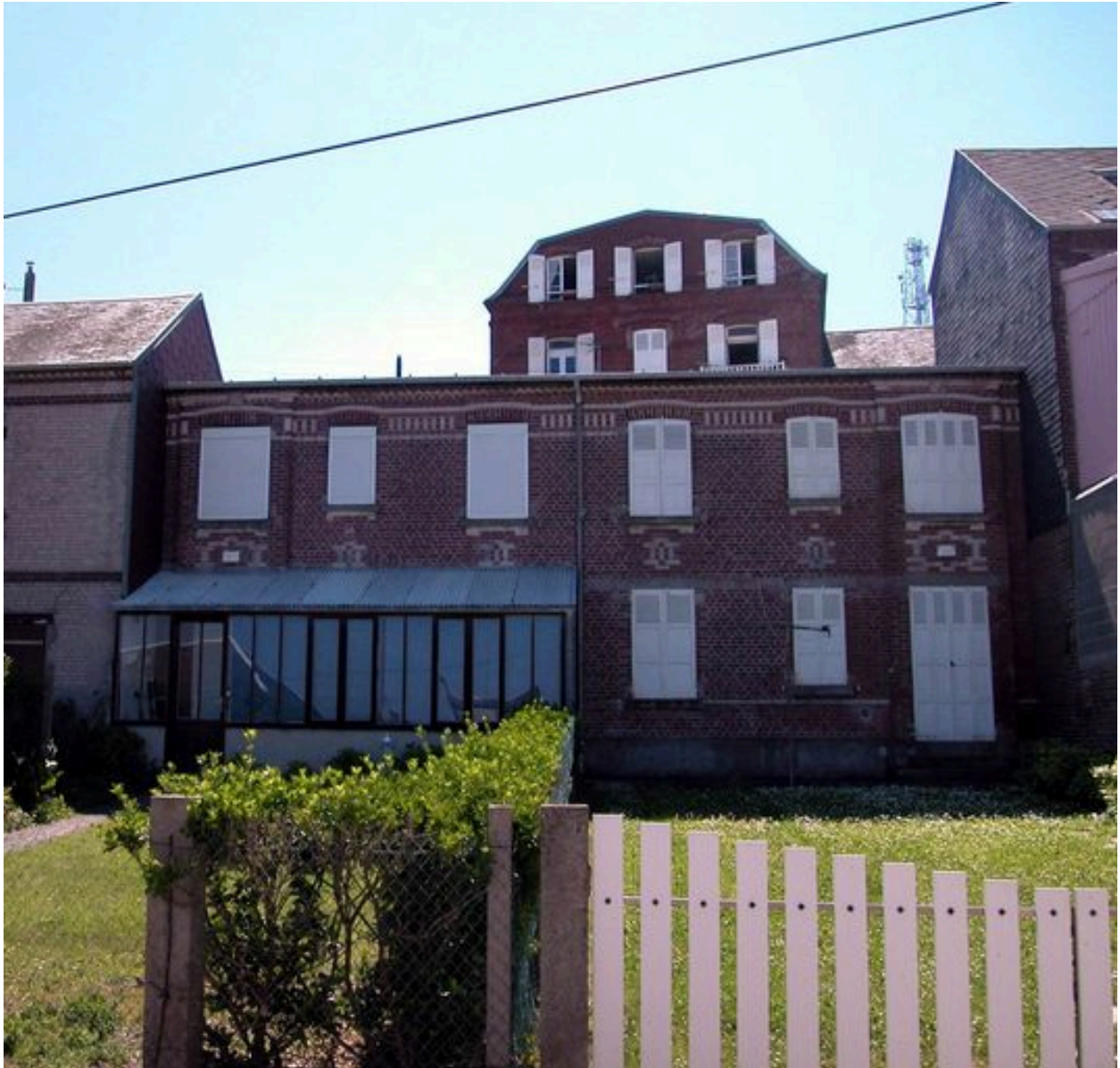
Vue d'ensemble depuis la rue de la Terrasse.