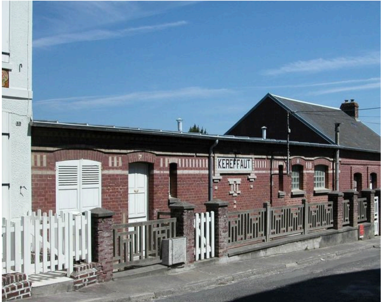
Vue d'ensemble depuis la rue Gros.