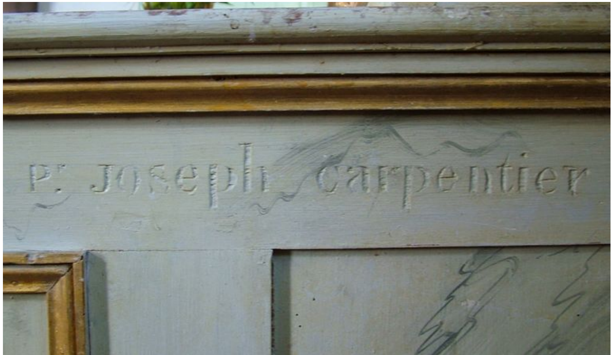
Signature gravée sur le bord latéral de l'autel : Pr Joseph carpentier.