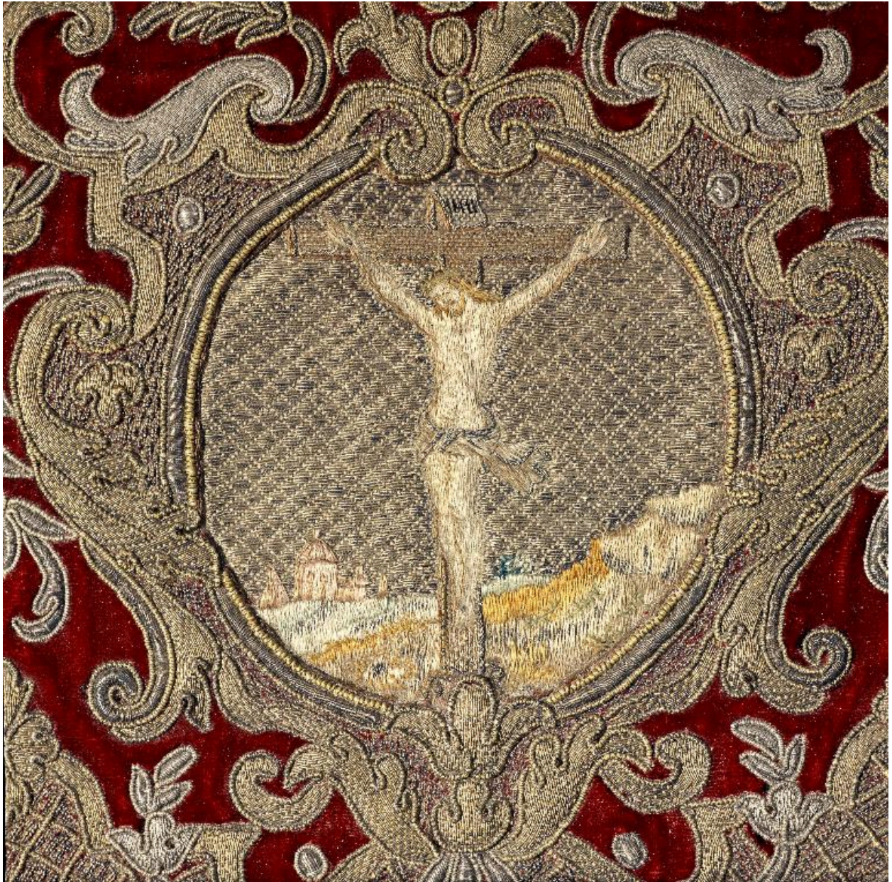
Détail du médaillon du canon central : Christ en croix.