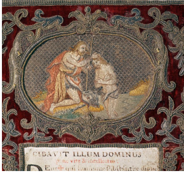
Détail du canon du Lavabo : Baptême du Christ. IVR22_19976000027XA