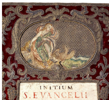
Détail du canon de l'Évangile : saint Jean l'Évangéliste. IVR22_19966001658XA