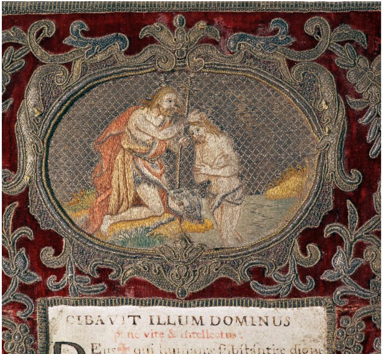
Détail du canon du Lavabo : Baptême du Christ.