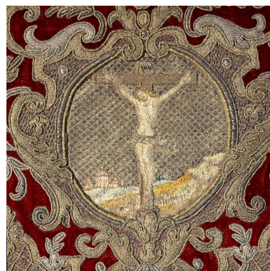
Détail du médaillon du canon central : Christ en croix. IVR22_19966001660XA