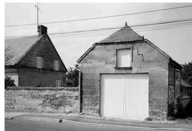
Remise. IVR22_19856000747X