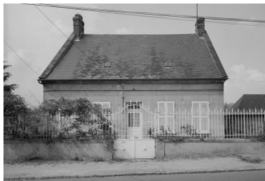
Élévation antérieure. IVR22_19856000746X