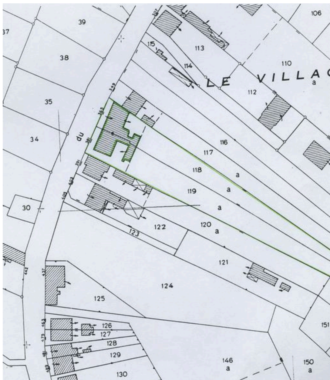
Plan de situation. Extrait du plan cadastral de 1982, section AB 118, 119.