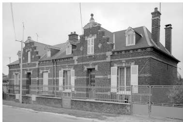
Elévation antérieure. IVR22_19856000948X