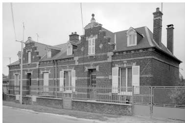
Élévation antérieure. IVR22_19856000948X

IVR22_20096000171NUCA