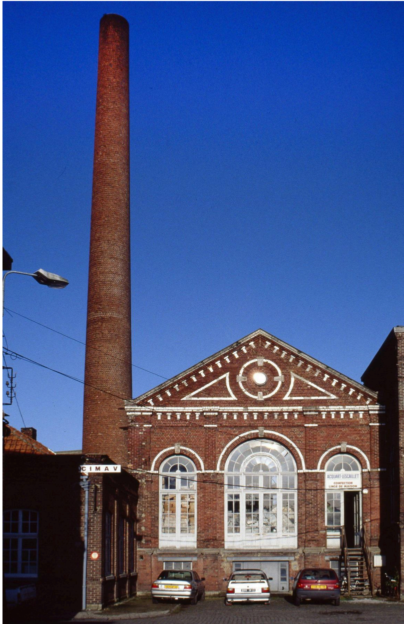
Seconde salle des machines. Élévation antérieure.