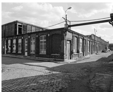
Atelier de fabrication. Vue prise vers l'est. IVR31_19905900965X