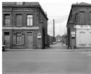
Vue générale depuis la rue. Vue prise vers le nord. IVR31_19805900014X