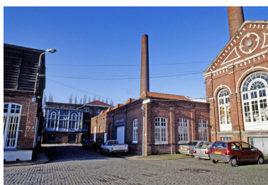
Vue générale vers l'ouest prise depuis la cour. IVR31_19965901547ZA