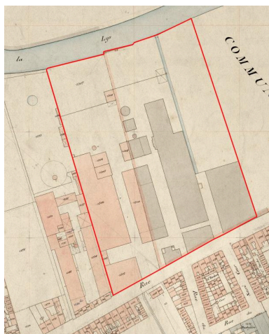
Établissements Mahieu. Extrait de plan cadastral, 1888 (la partie grisée se trouve sur le territoire d'Houplines). IVR32_20205902486NUCA