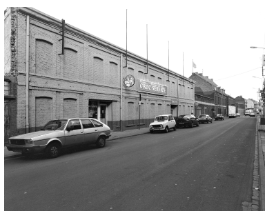
Élévation sur rue. Vue prise vers le nord-est.