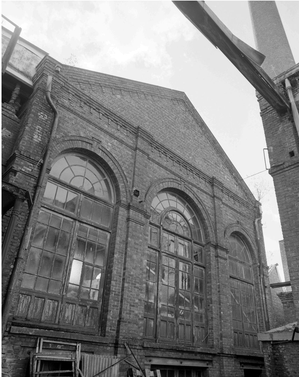
Seconde salle des machines. Élévation postérieure.