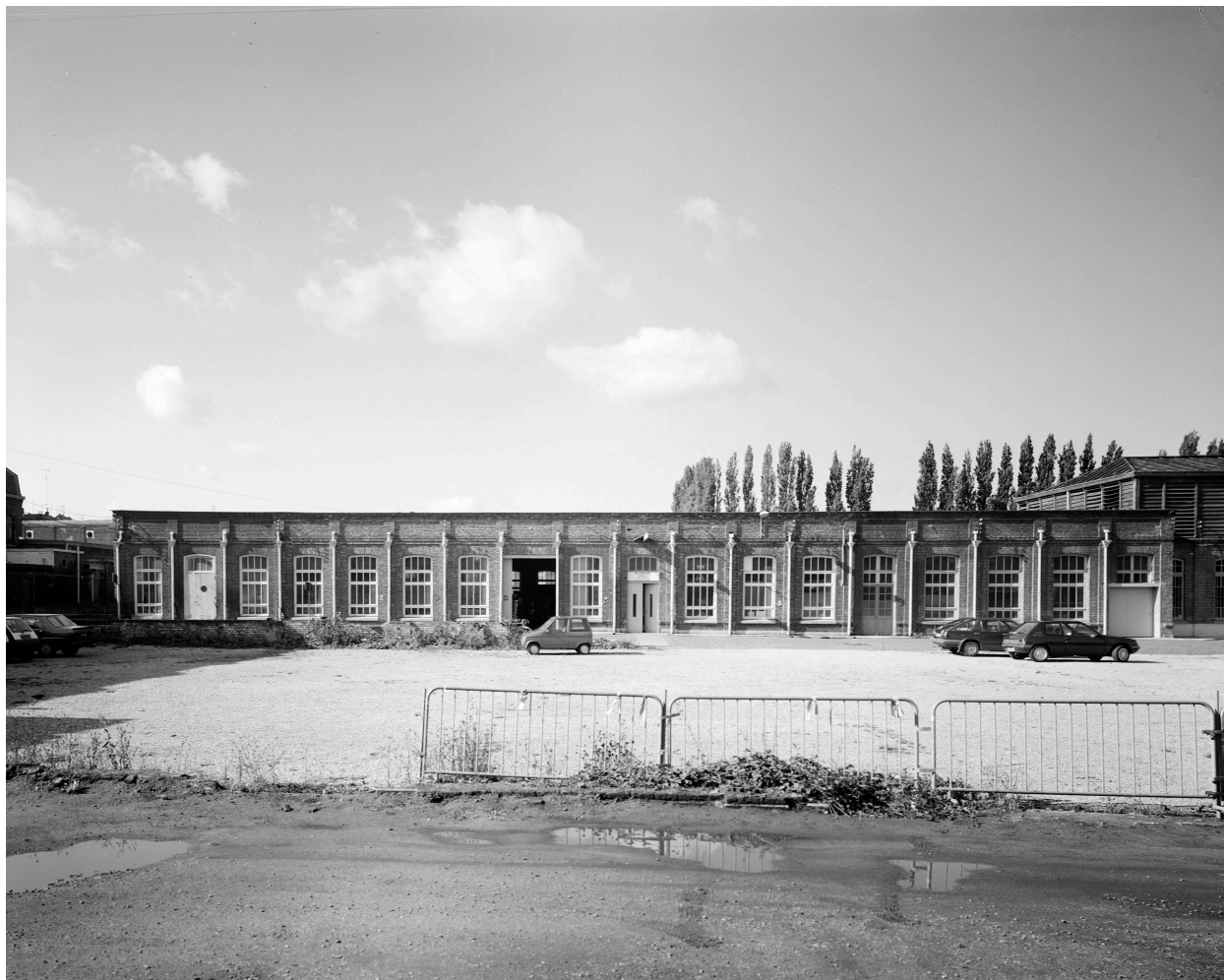
Atelier de fabrication. Vue prise vers l'ouest.