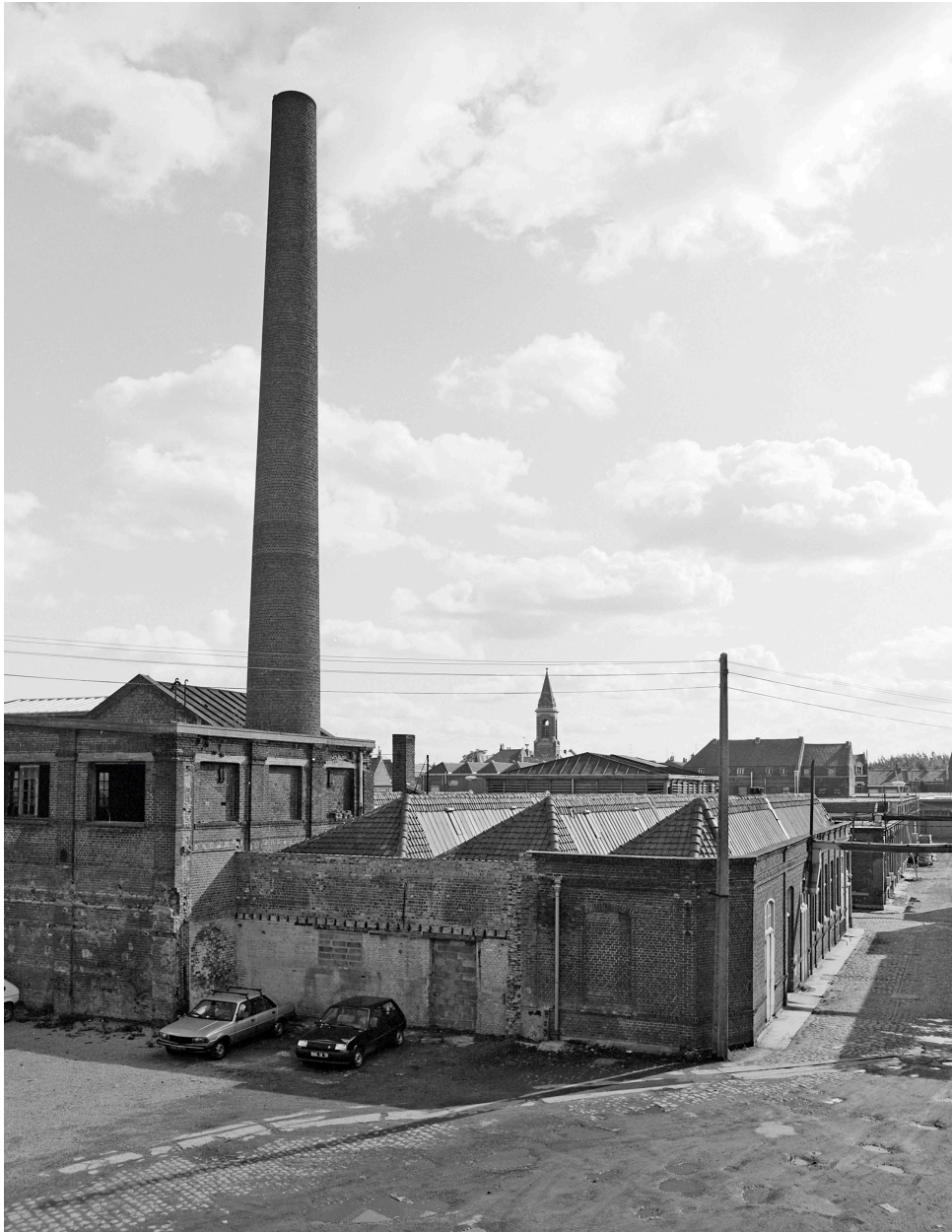
Vue générale prise vers le sud.