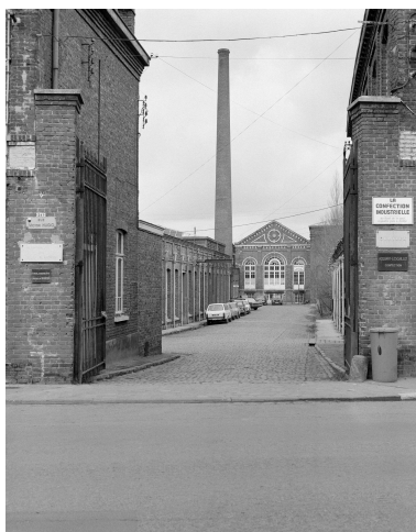
Vue générale depuis la rue. Vue prise vers le nord. IVR31_19805900027X