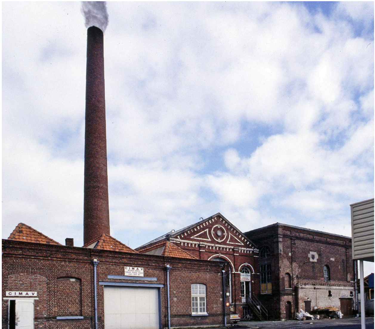
Vue générale vers l'est prise depuis la cour.