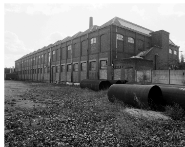
Magasin, enfilade. Vue prise vers le sud.