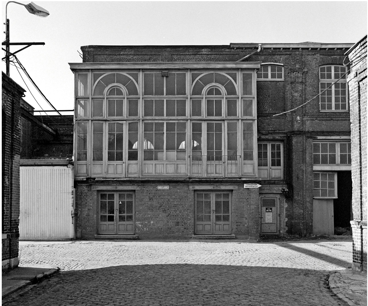
Salle des machines. Élévation antérieure.