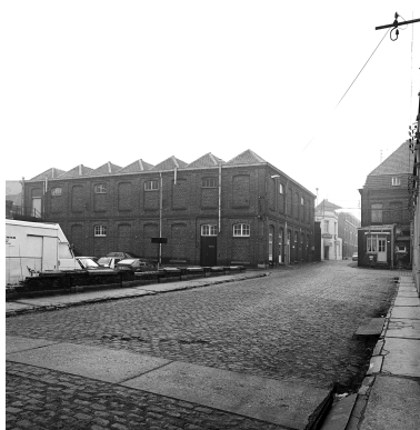
Magasin rue Victor-Hugo. Vue antérieure prise depuis la cour. IVR31_19915900106X