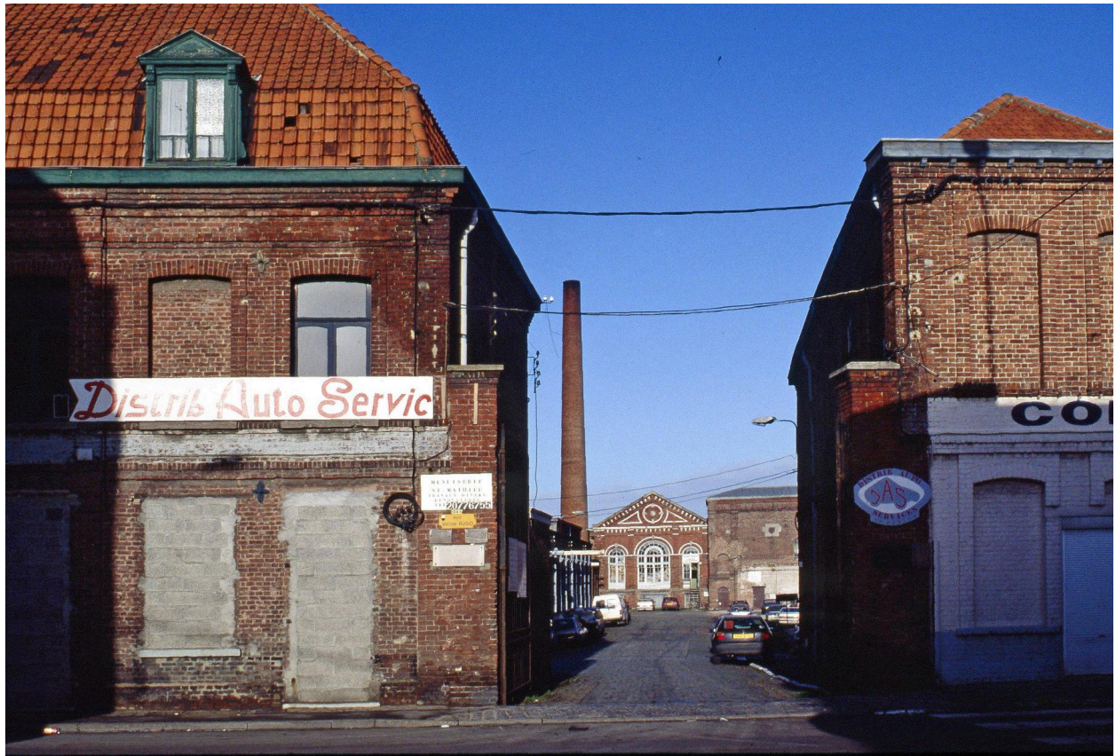
Entrée rue Victor-Hugo.