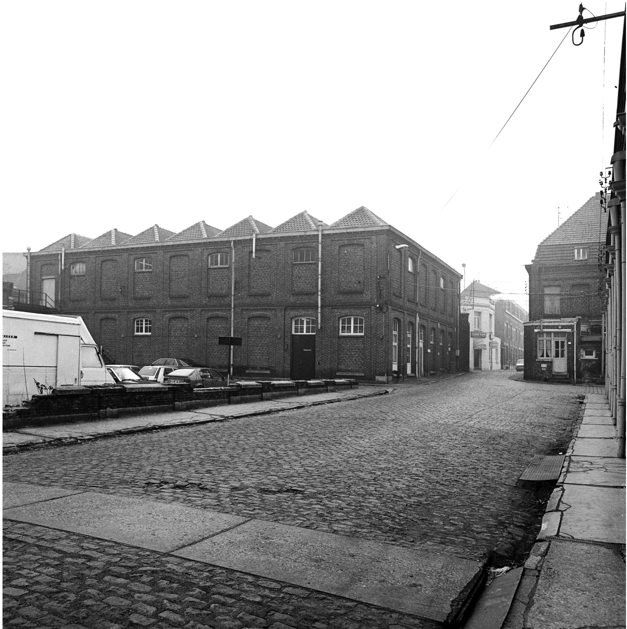
Magasin rue Victor-Hugo. Vue antérieure prise depuis la cour.