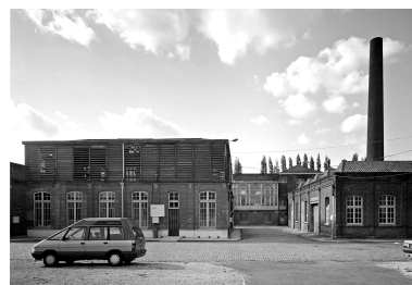
Crémage (à gauche) et salle des machines (à droite). IVR31_19905900961V