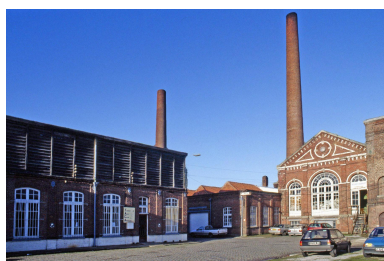
Crémage (à gauche) et salle des machines (à droite).