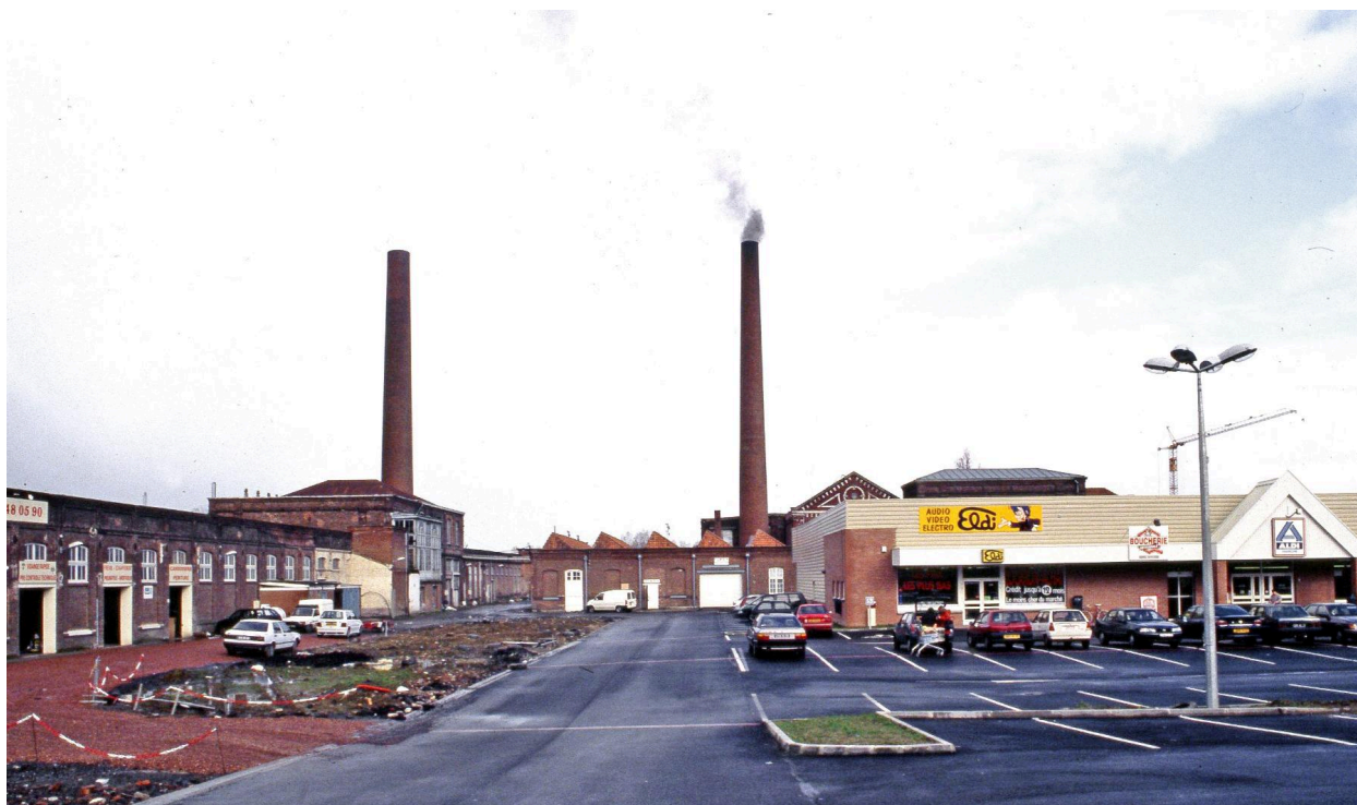
Vue générale vers l'est prise depuis l'entrée.