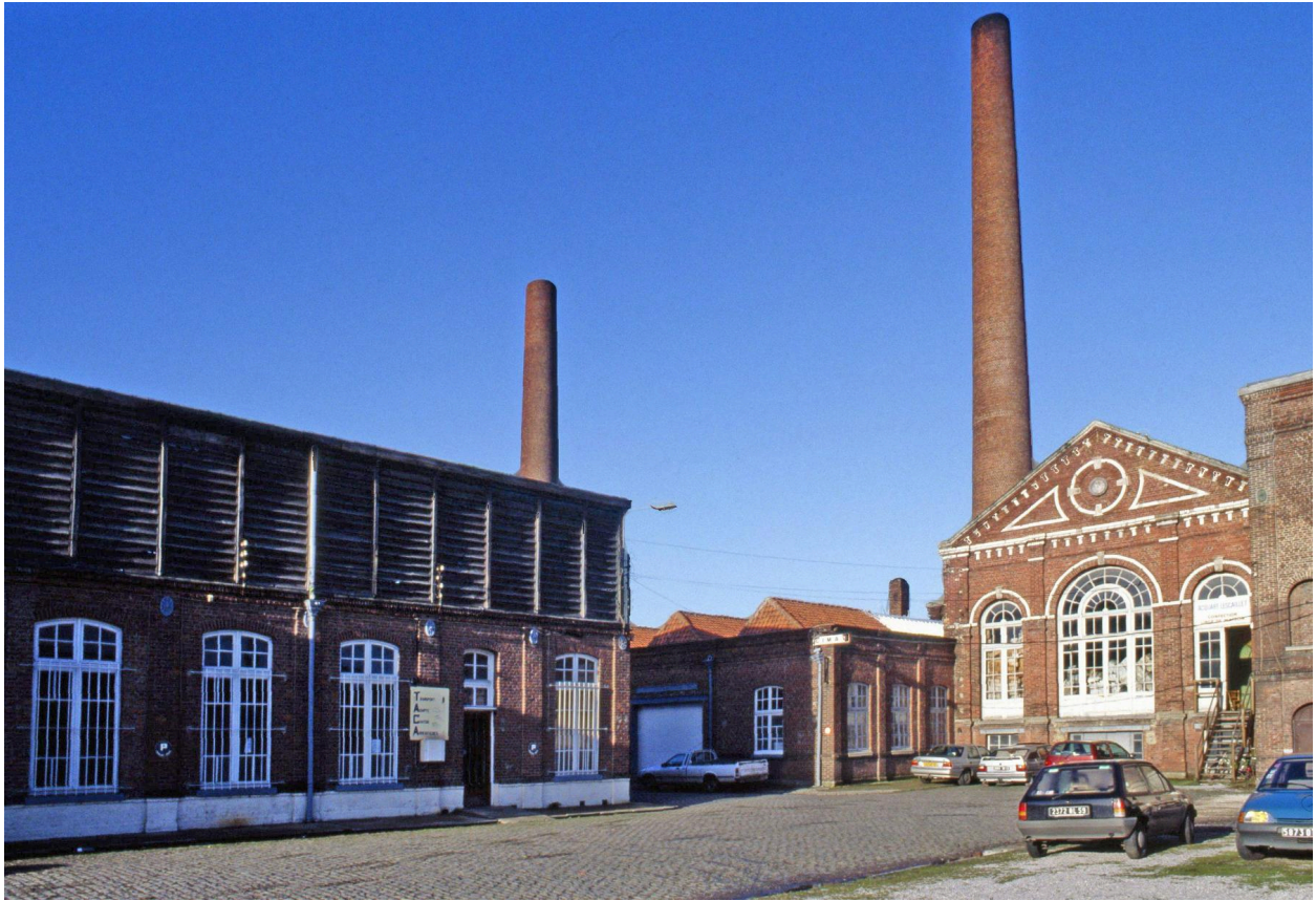
Crémage (à gauche) et salle des machines (à droite).