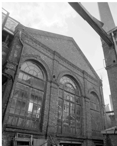
Seconde salle des machines. Élévation postérieure.