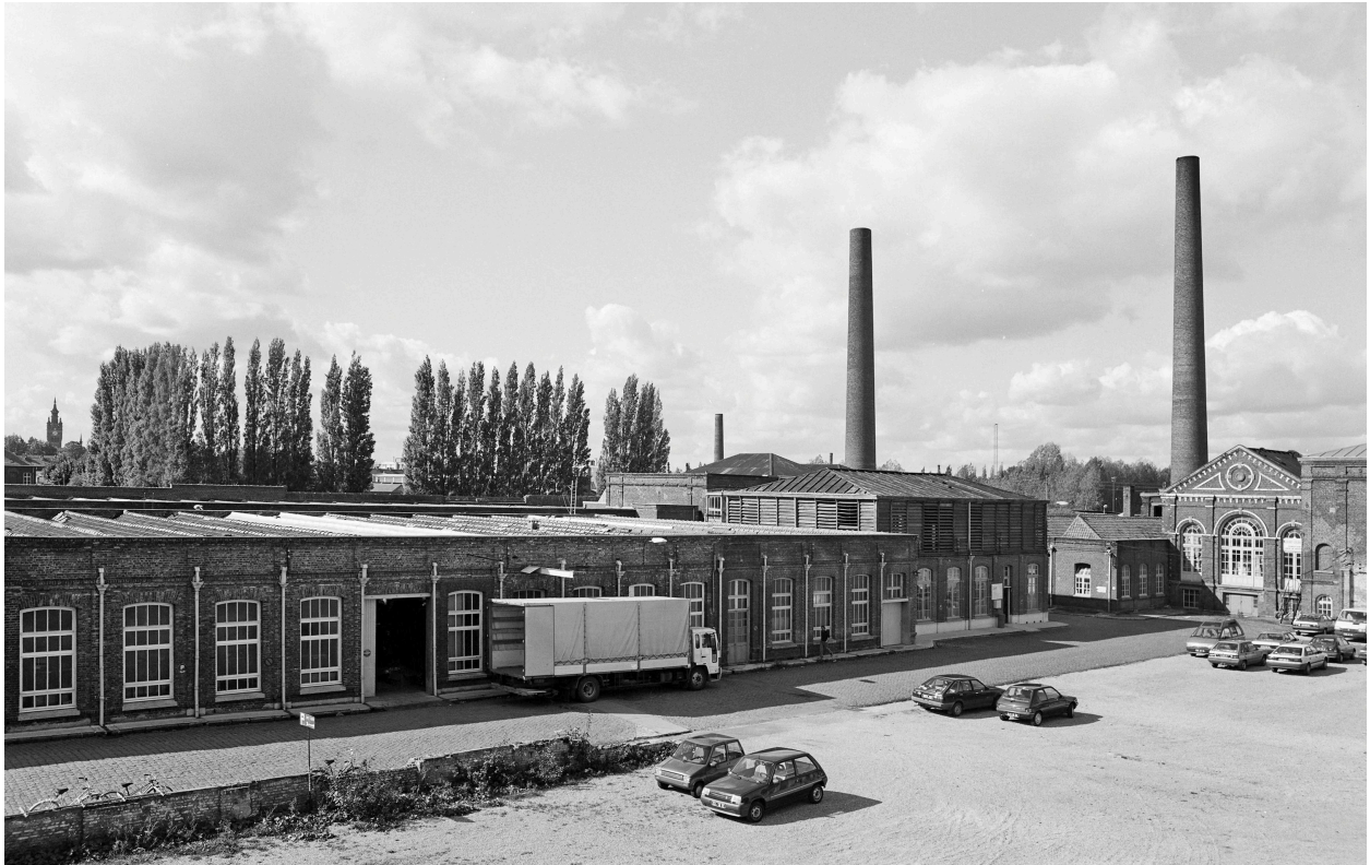
Vue générale prise vers le nord-ouest.