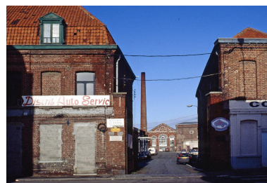
Entrée rue Victor-Hugo. IVR31_19965901546ZA