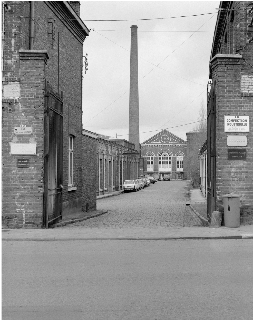
Vue générale depuis la rue. Vue prise vers le nord.