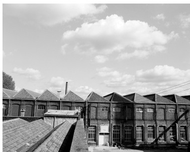
Magasin. Vue prise vers l'est. IVR31_19905900967X