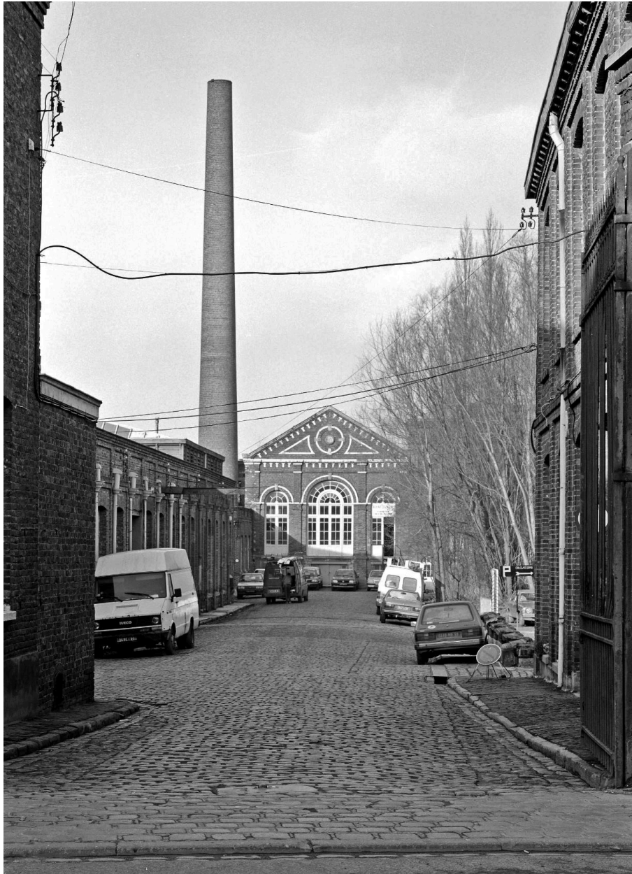
Vue sur la cour prise depuis la rue.