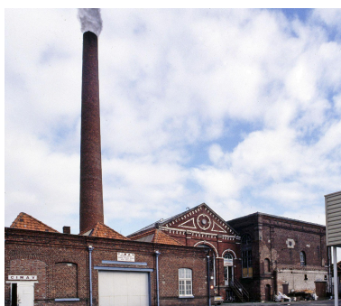
Vue générale vers l'est prise depuis la cour.