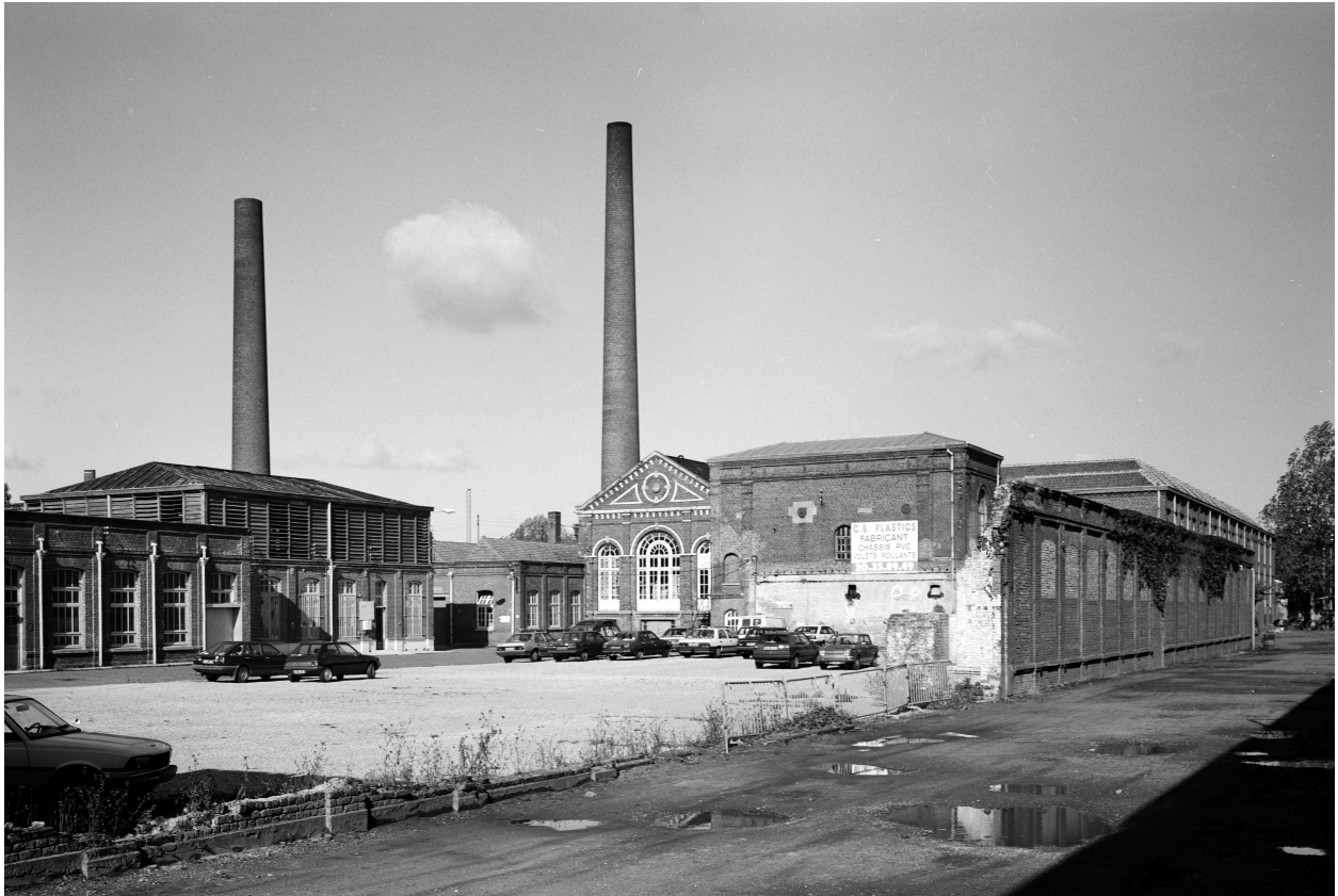
Vue générale prise vers le nord-ouest. À gauche le crémage et au centre une salle des machines.