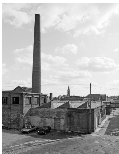
Vue générale prise vers le sud.