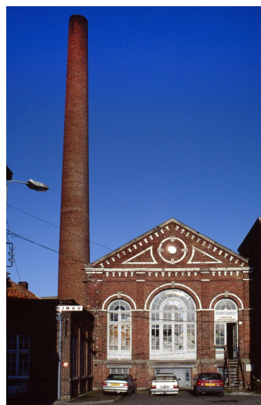
Seconde salle des machines. Élévation antérieure. IVR31_19965901549ZA