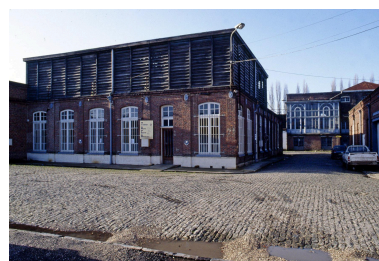
Crémage (à gauche) et salle des machines (à droite). IVR31_19965901551ZA