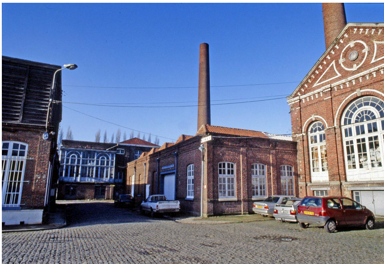
Vue générale vers l'ouest prise depuis la cour.