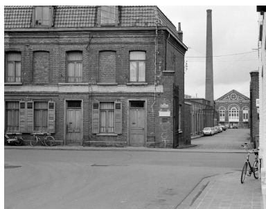
Vue générale depuis la rue. Vue prise vers le nord. IVR31_19805900028X