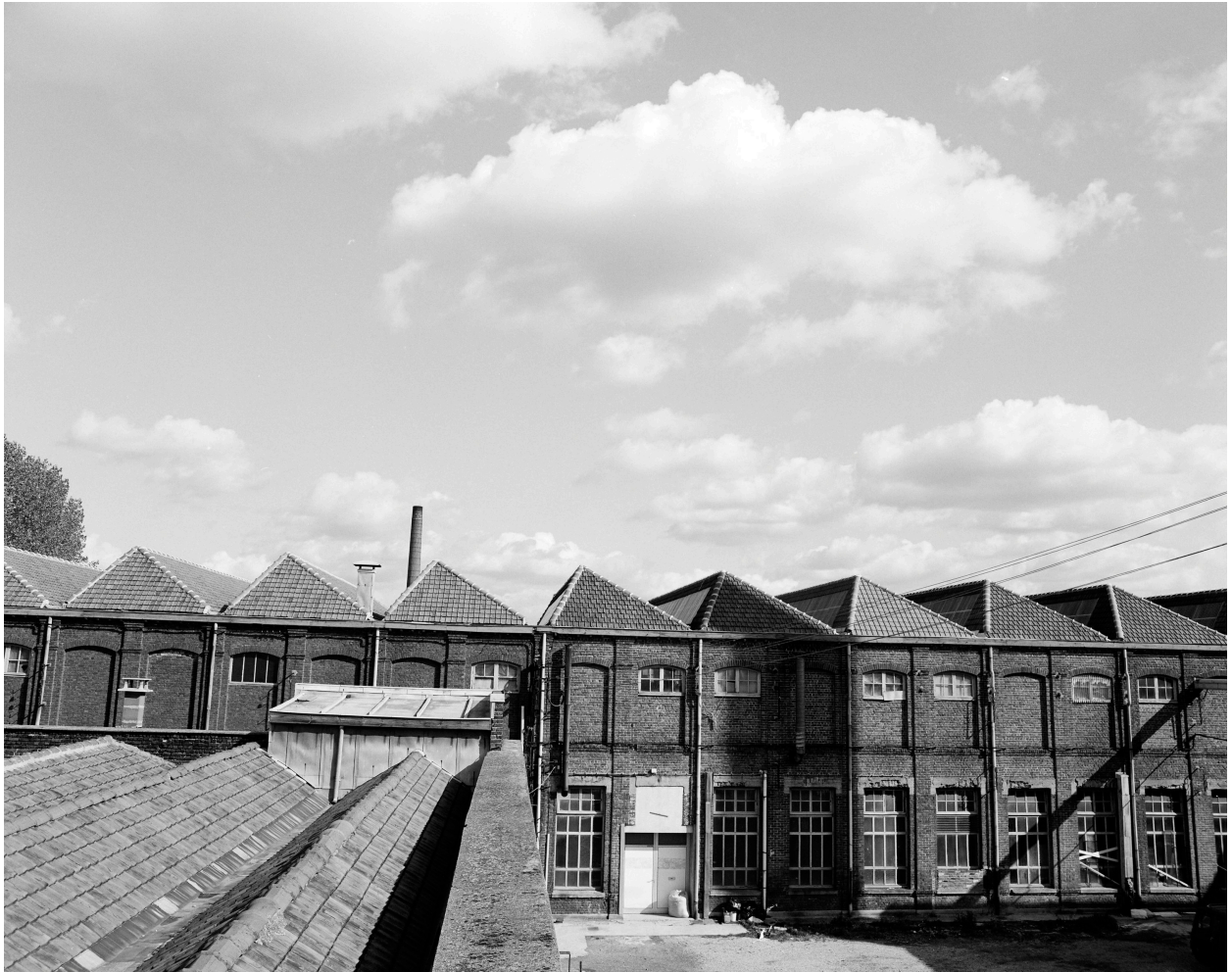
Magasin. Vue prise vers l'est.