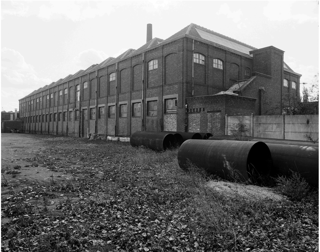
Magasin, enfilade. Vue prise vers le sud.