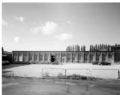
Atelier de fabrication. Vue prise vers l'ouest.