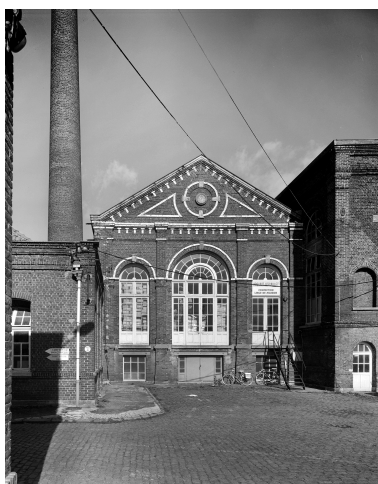
Seconde salle des machines. Élévation antérieure.