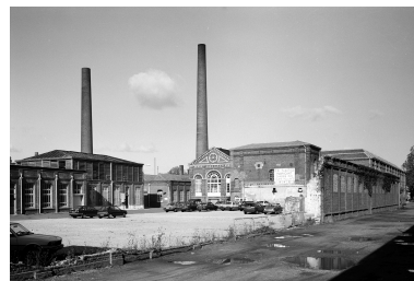
Vue générale prise vers le nord-ouest. À gauche le crémage et au centre une salle des machines.