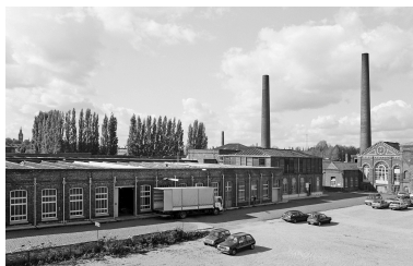
Vue générale prise vers le nord-ouest. IVR31_19905900969V