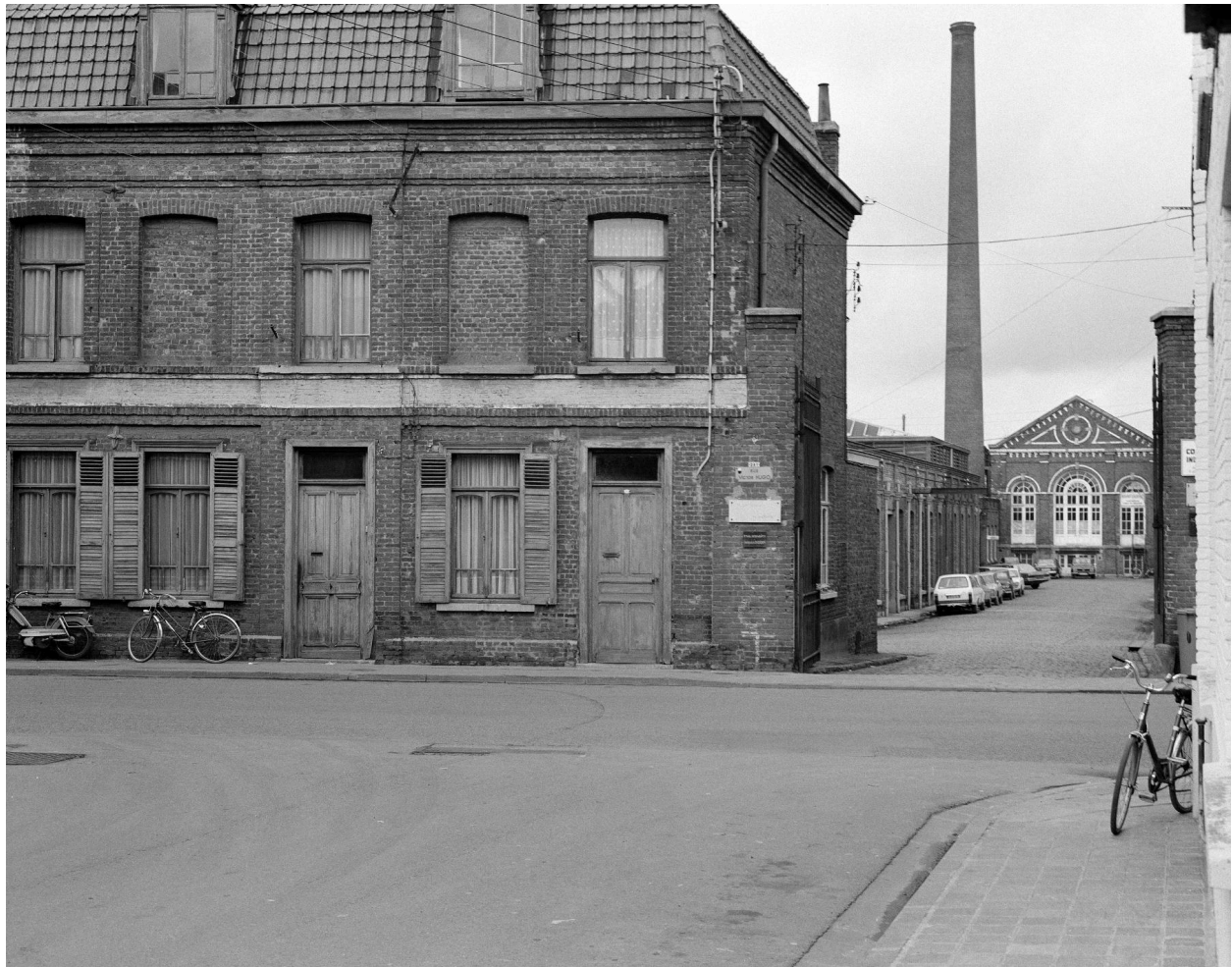
Vue générale depuis la rue. Vue prise vers le nord.