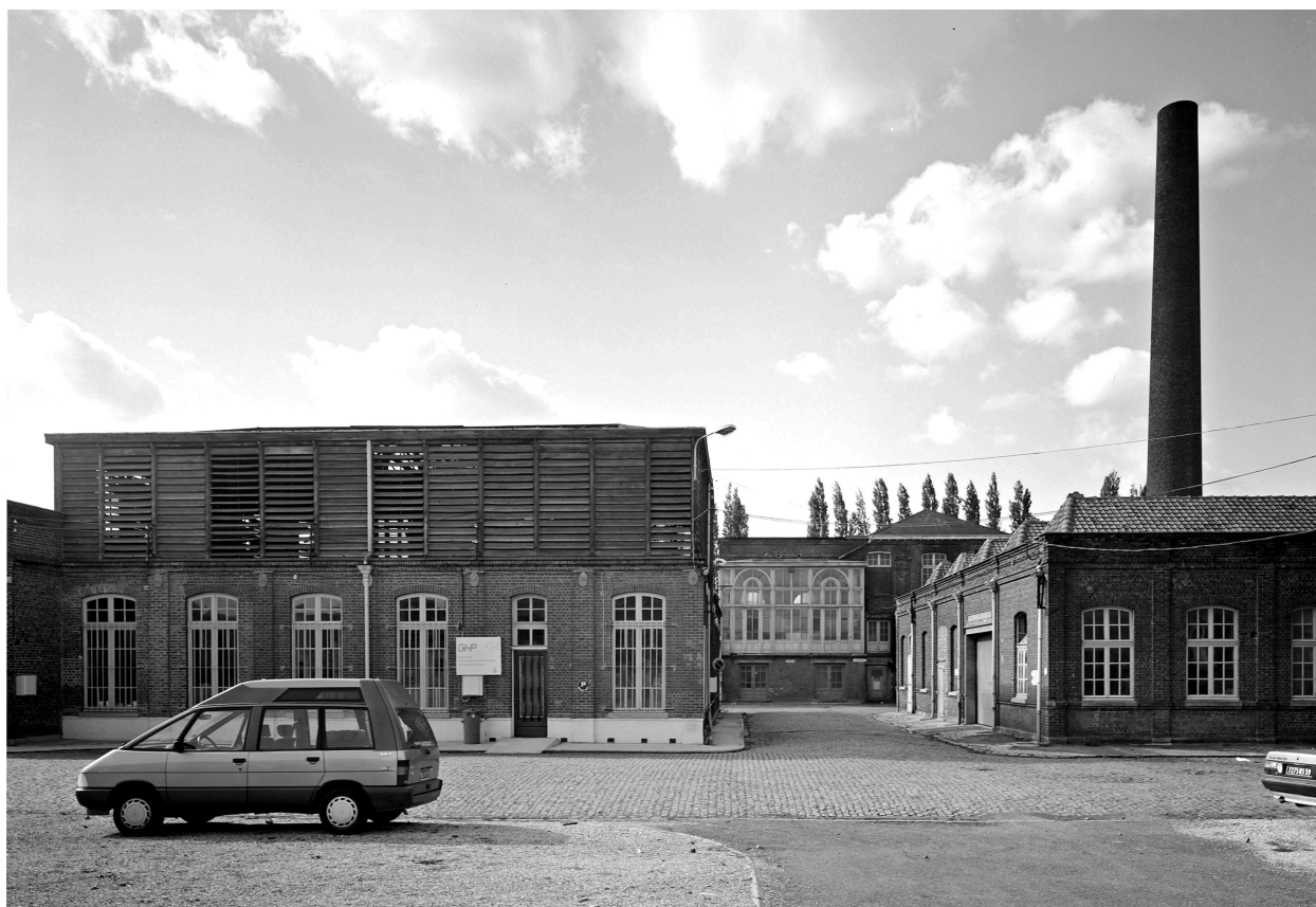
Crémage (à gauche) et salle des machines (à droite).