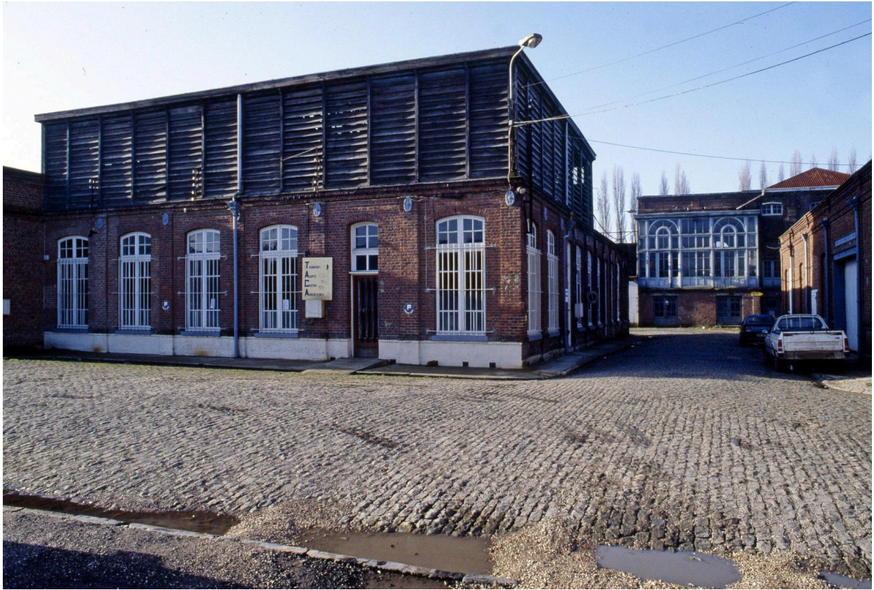
Crémage (à gauche) et salle des machines (à droite).