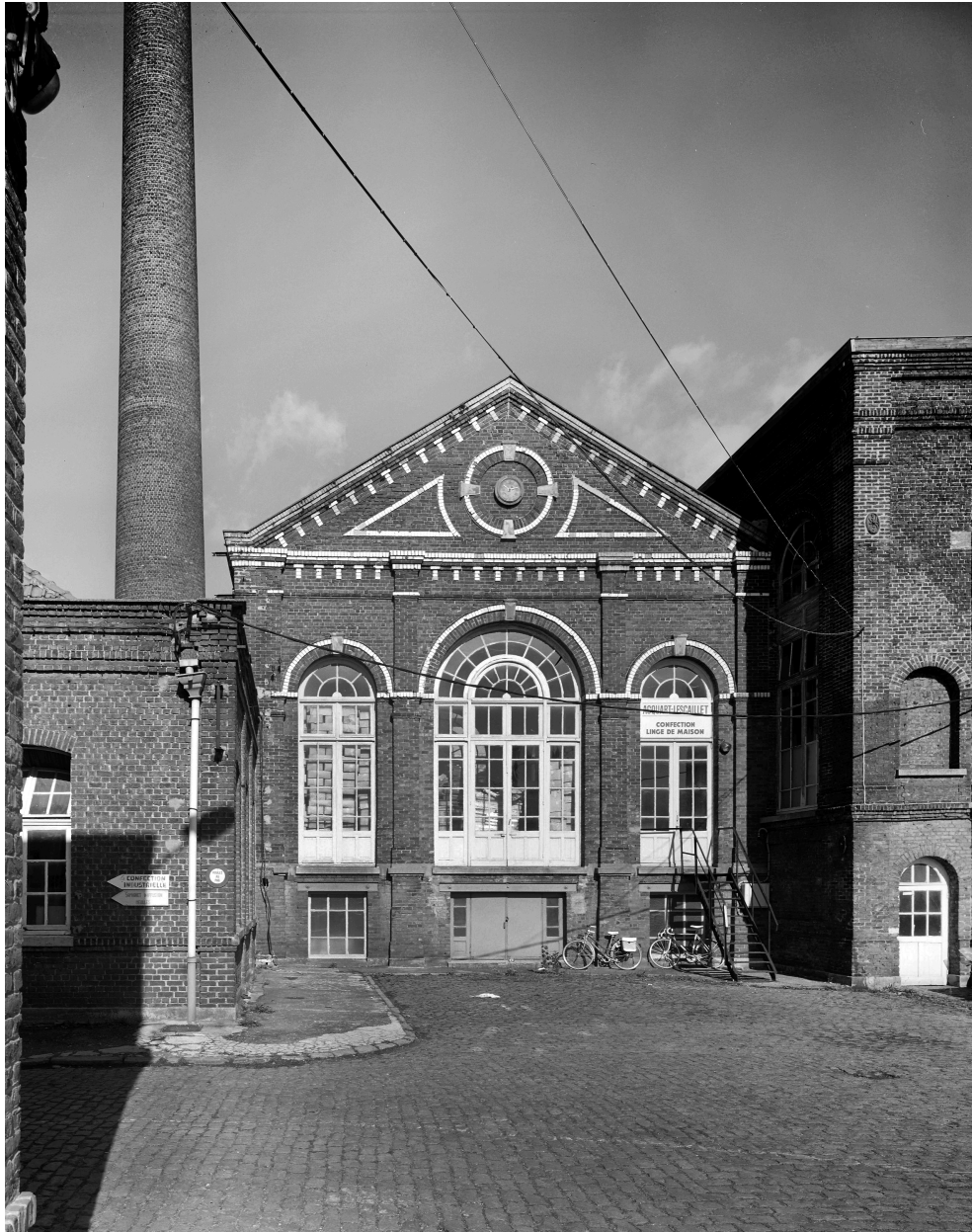
Seconde salle des machines. Élévation antérieure.