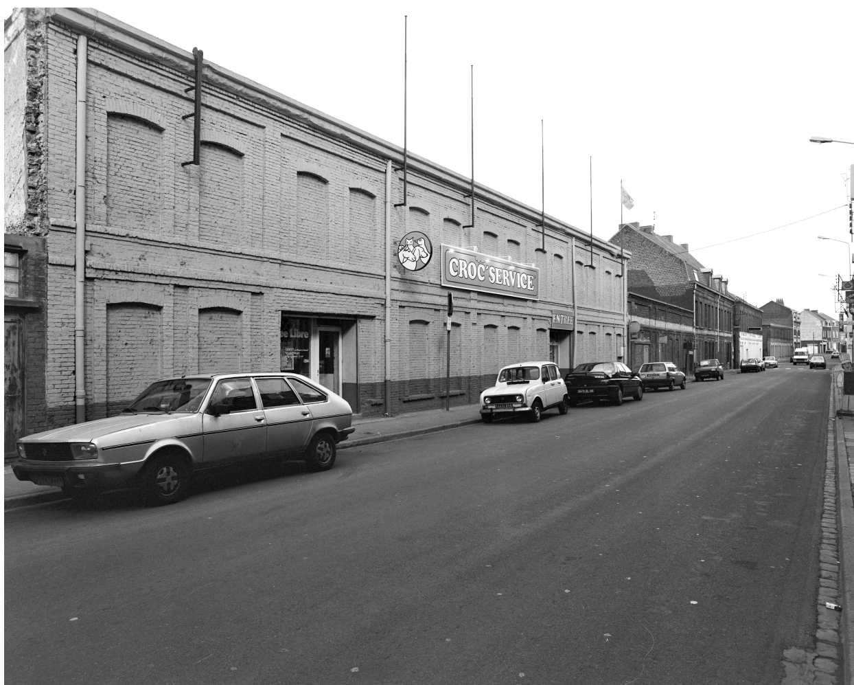
Élévation sur rue. Vue prise vers le nord-est.