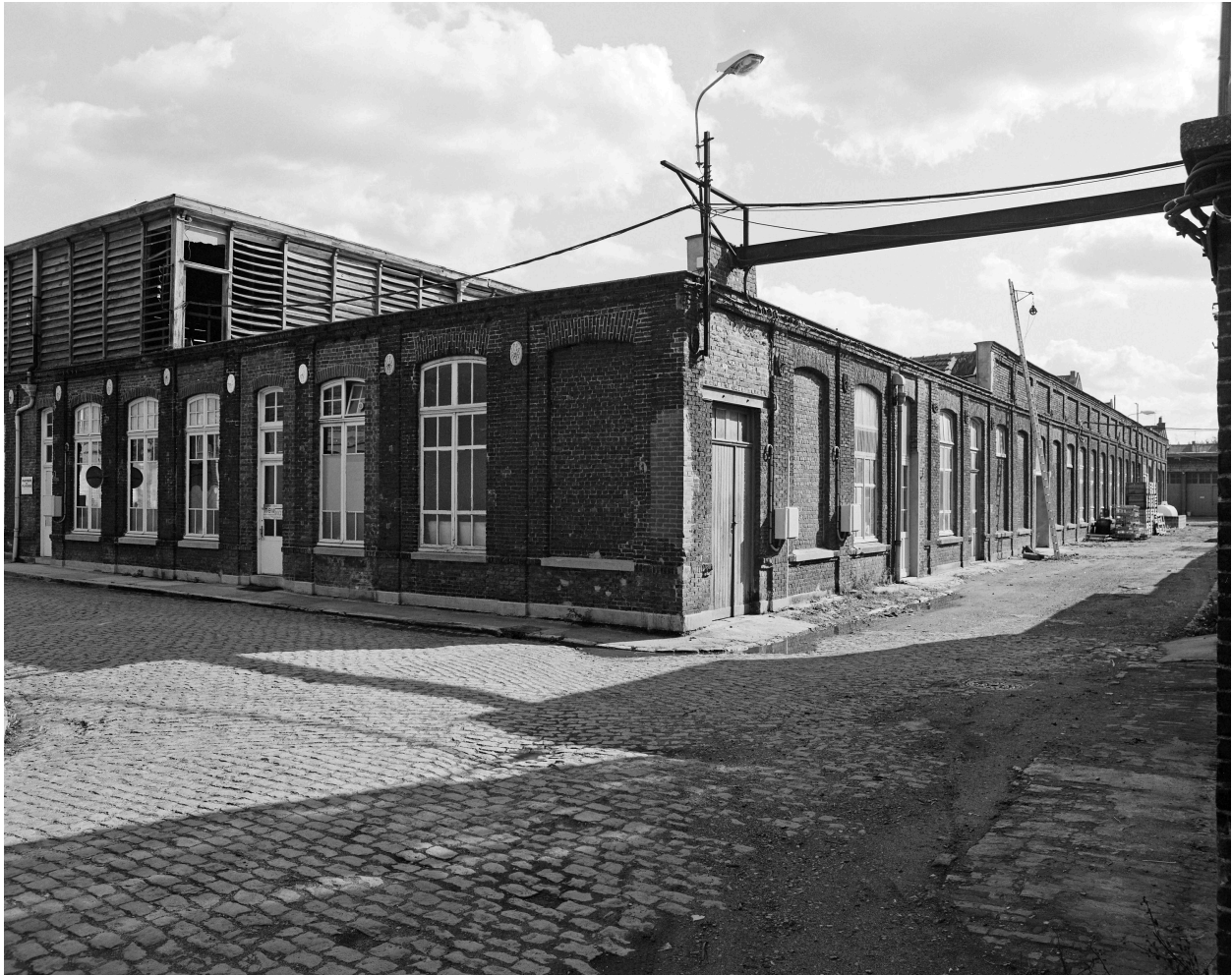
Atelier de fabrication. Vue prise vers l'est.