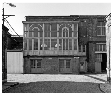
Salle des machines. Élévation antérieure. IVR31_19905901057X