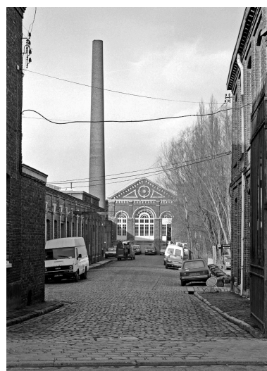
Vue sur la cour prise depuis la rue.