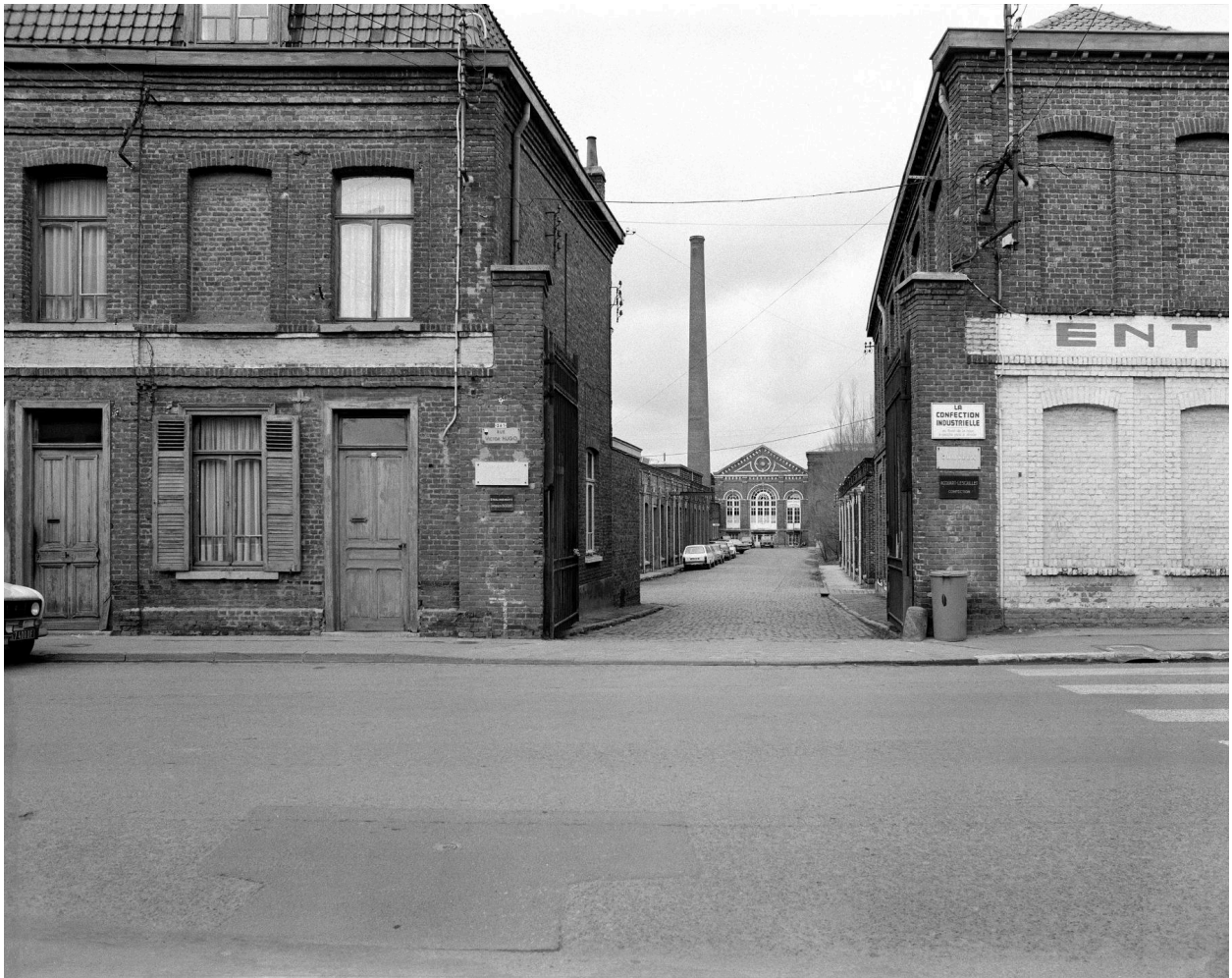
Vue générale depuis la rue. Vue prise vers le nord.