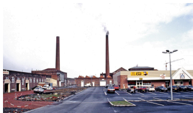
Vue générale vers l'est prise depuis l'entrée.