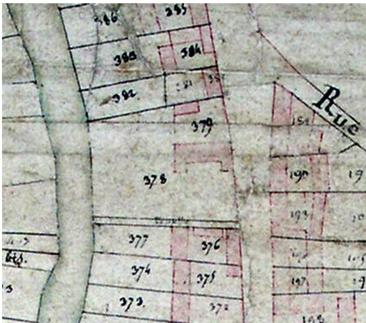
Extrait du cadastre napoléonien (DGI).