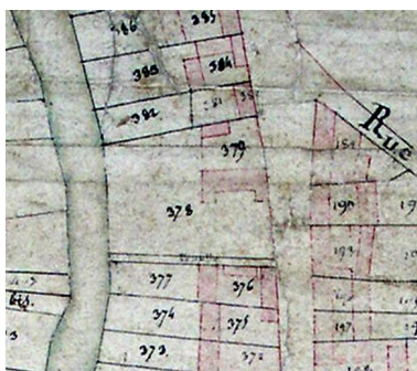
Extrait du cadastre napoléonien (DGI).