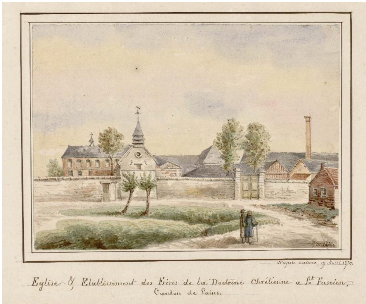
La chapelle en 1870. Aquarelle de Macqueron (BM Abbeville ; Bov. 84).