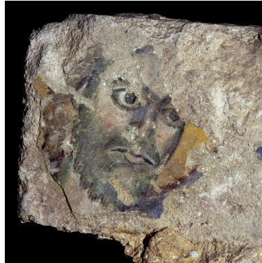
Vue de détail : la tête du Christ.