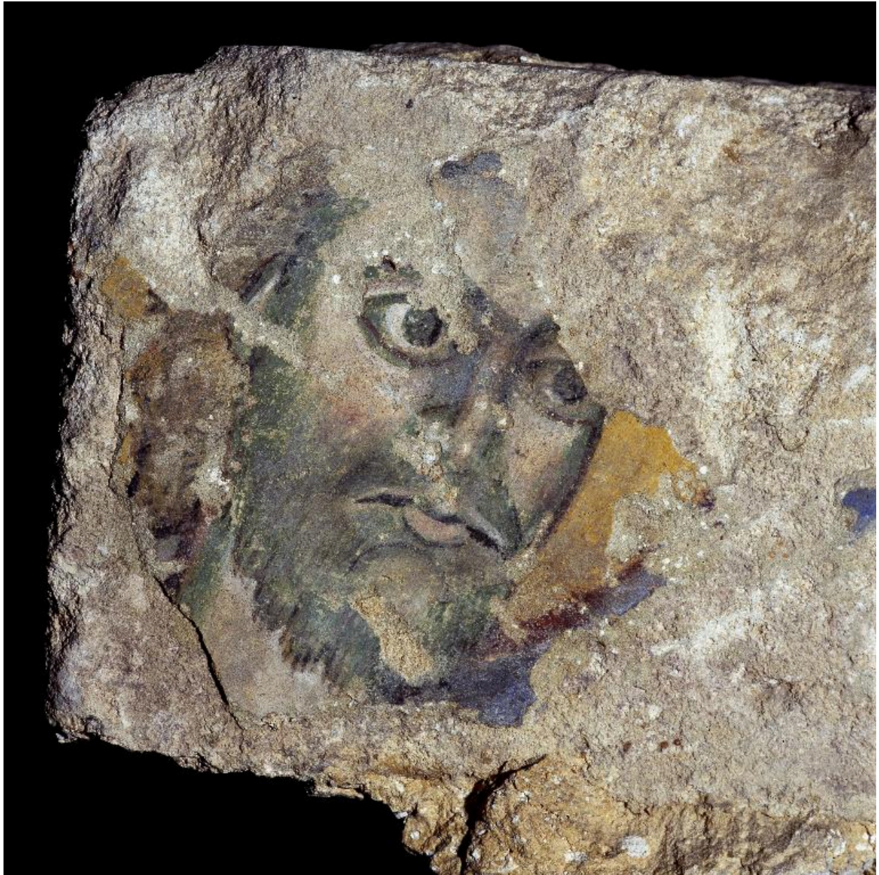
Vue de détail : la tête du Christ.