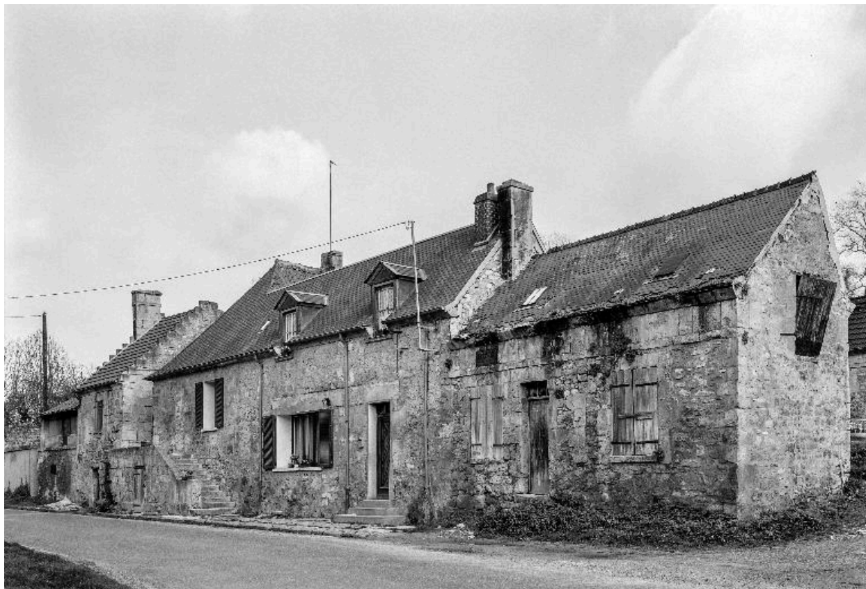
Anciens bâtiments de ferme (25 Grande rue) : élévation sud-ouest, sur rue.