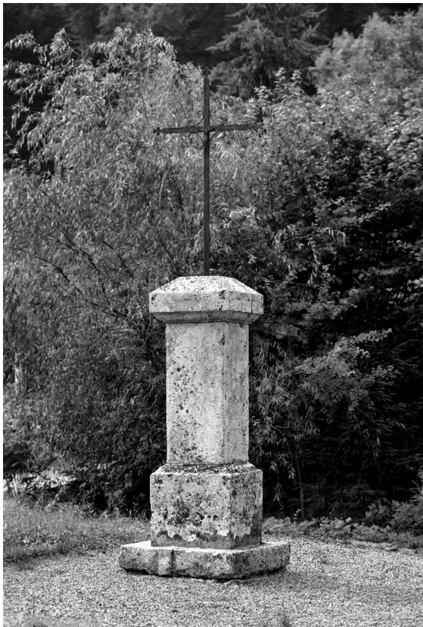
Vue de la croix de chemin.