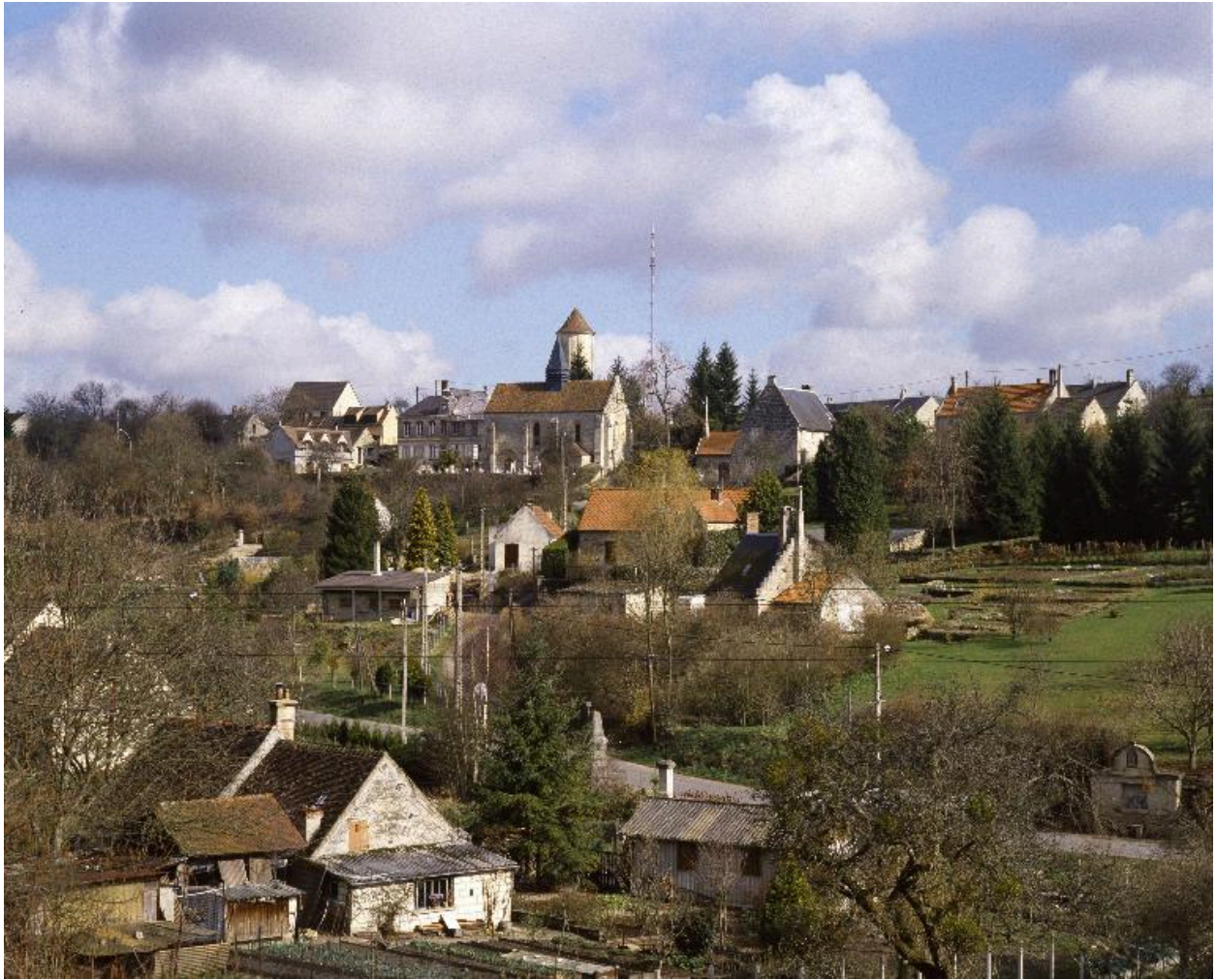
Vue du centre du village, depuis le sud.