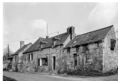
Anciens bâtiments de ferme (25 Grande rue) : élévation sud-ouest, sur rue. IVR22_19900200657X