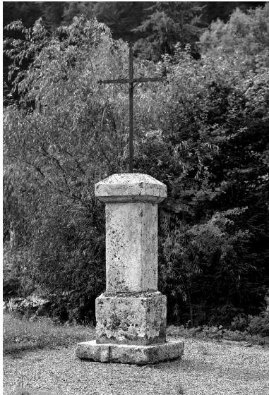
Vue de la croix de chemin.