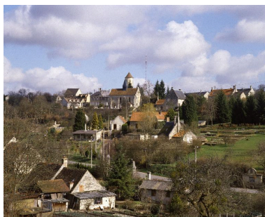
Vue du centre du village, depuis le sud.