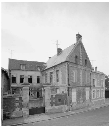
Vue depuis la rue. IVR22_19856001435V