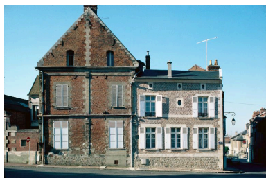
Elévation antérieure. Pignon. IVR22_19856001334ZA