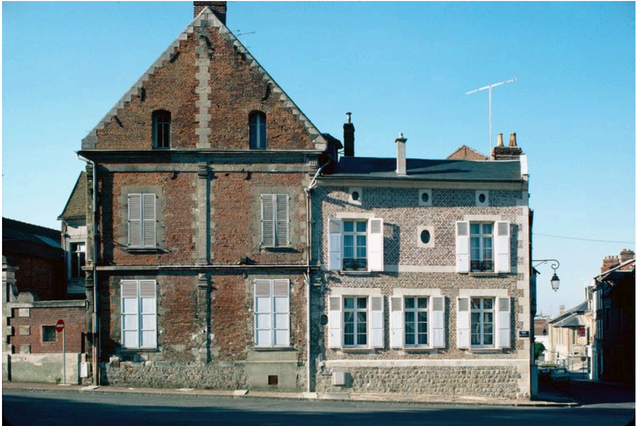
Elévation antérieure. Pignon.