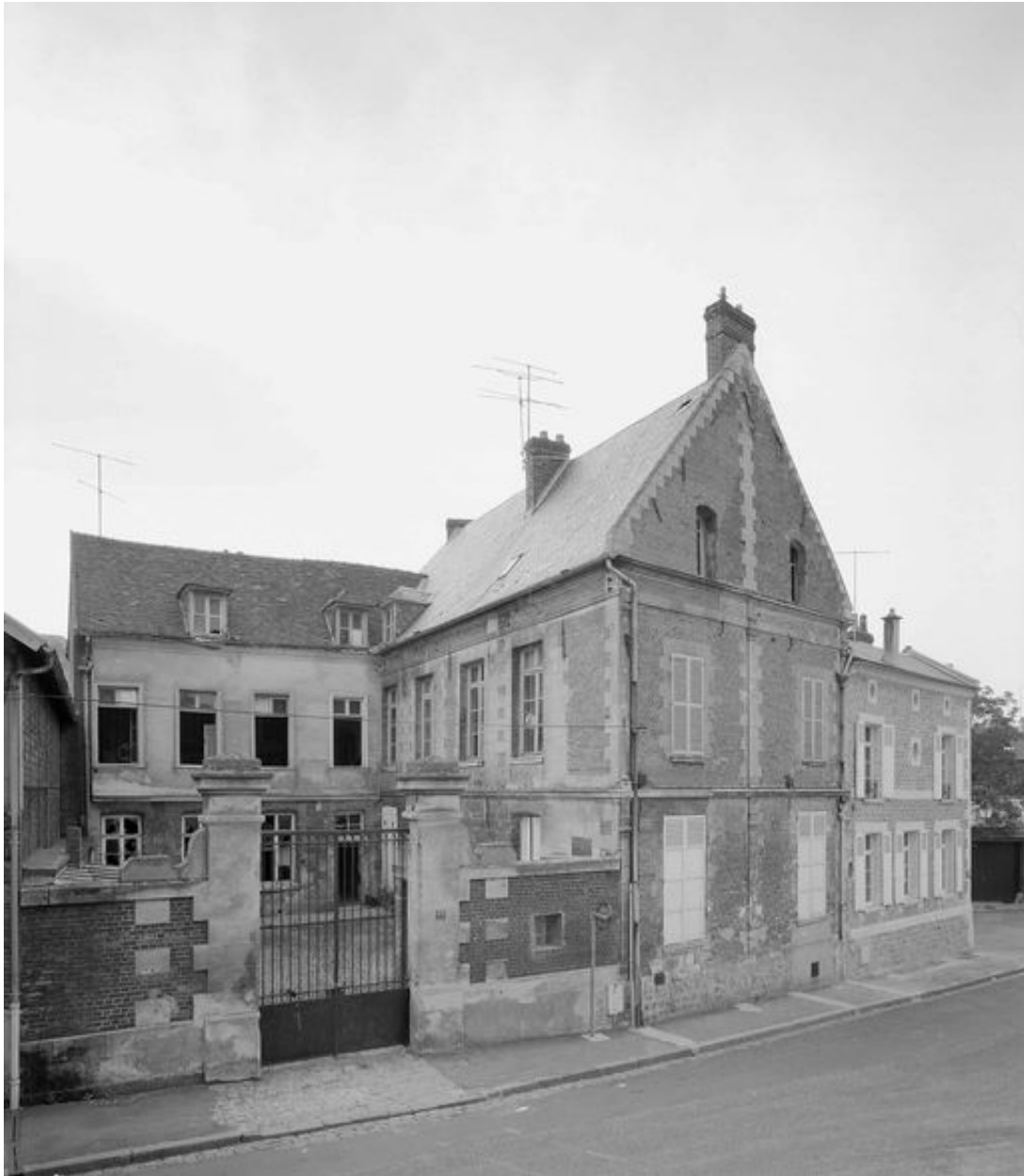
Vue depuis la rue.