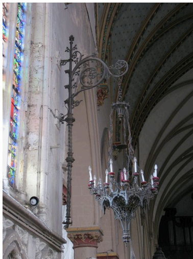
Vue générale IVR31_20106201933NUCA