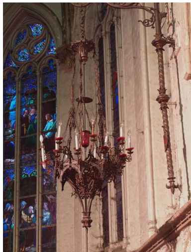
Lustre IVR31_20106201934NUCA