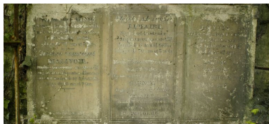
Stèle funéraire, vers 1840.