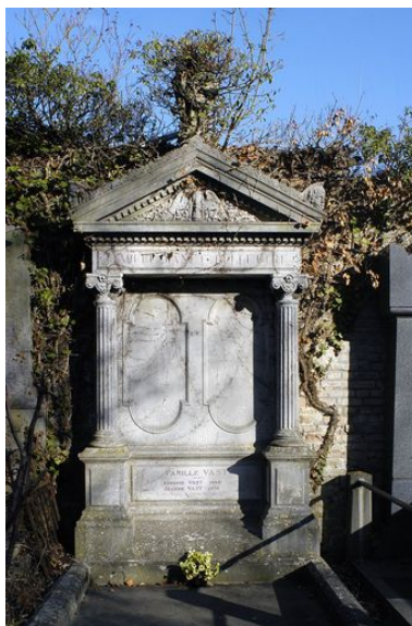
Vue de la stèle. IVR22_20058002128NUCA