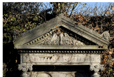
Vue du fronton.