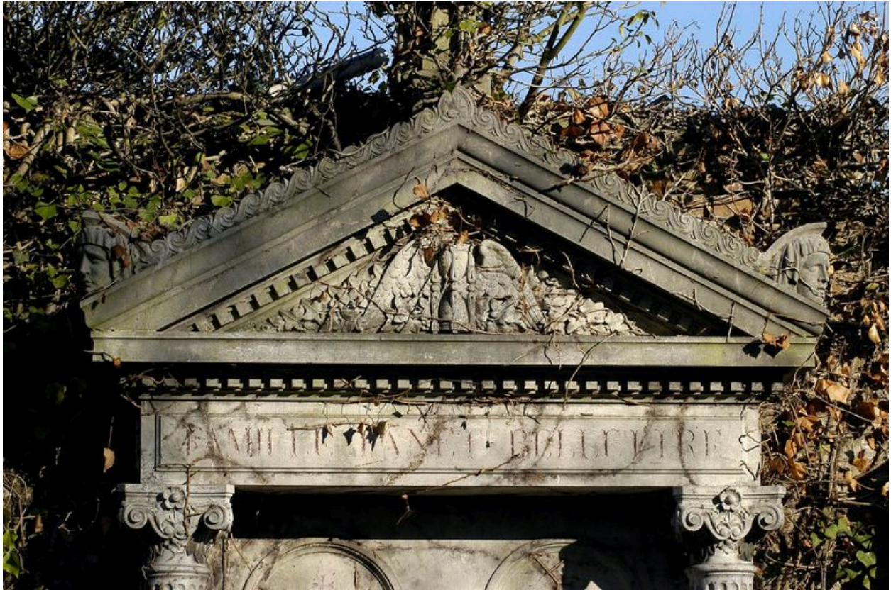
Vue du fronton.