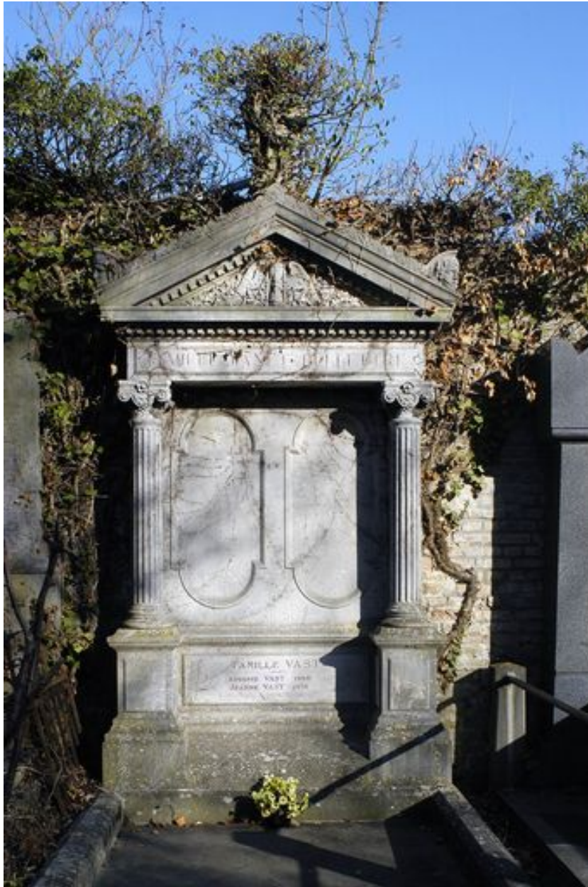
Vue de la stèle.