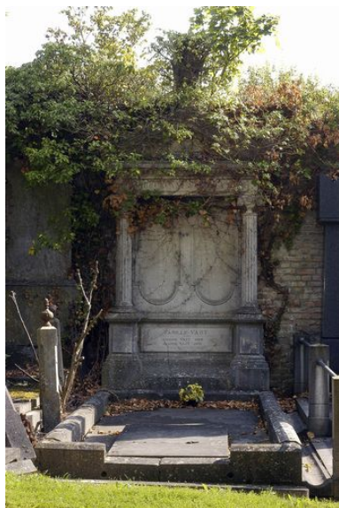
Vue générale. IVR22_20058001310NUCA