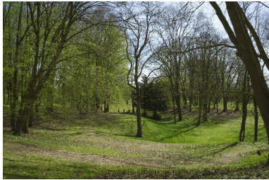
Une allée du parc. IVR32_20170200165NUC2A

Parc des Buttes-Chaumont. Vue aérienne, 26 juin 1931 ( ; C94PHQ4451_1931_NP3_HR50_0007). IVR32_20220205082NUCA