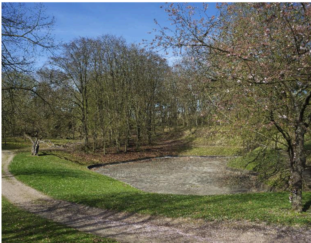
Le lac artificiel.