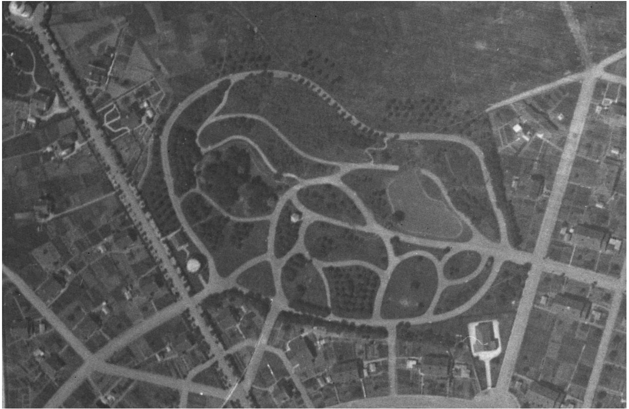
Parc des Buttes-Chaumont. Vue aérienne, 26 juin 1931 (IGN ; C94PHQ4451_1931_NP3_HR50_0007).