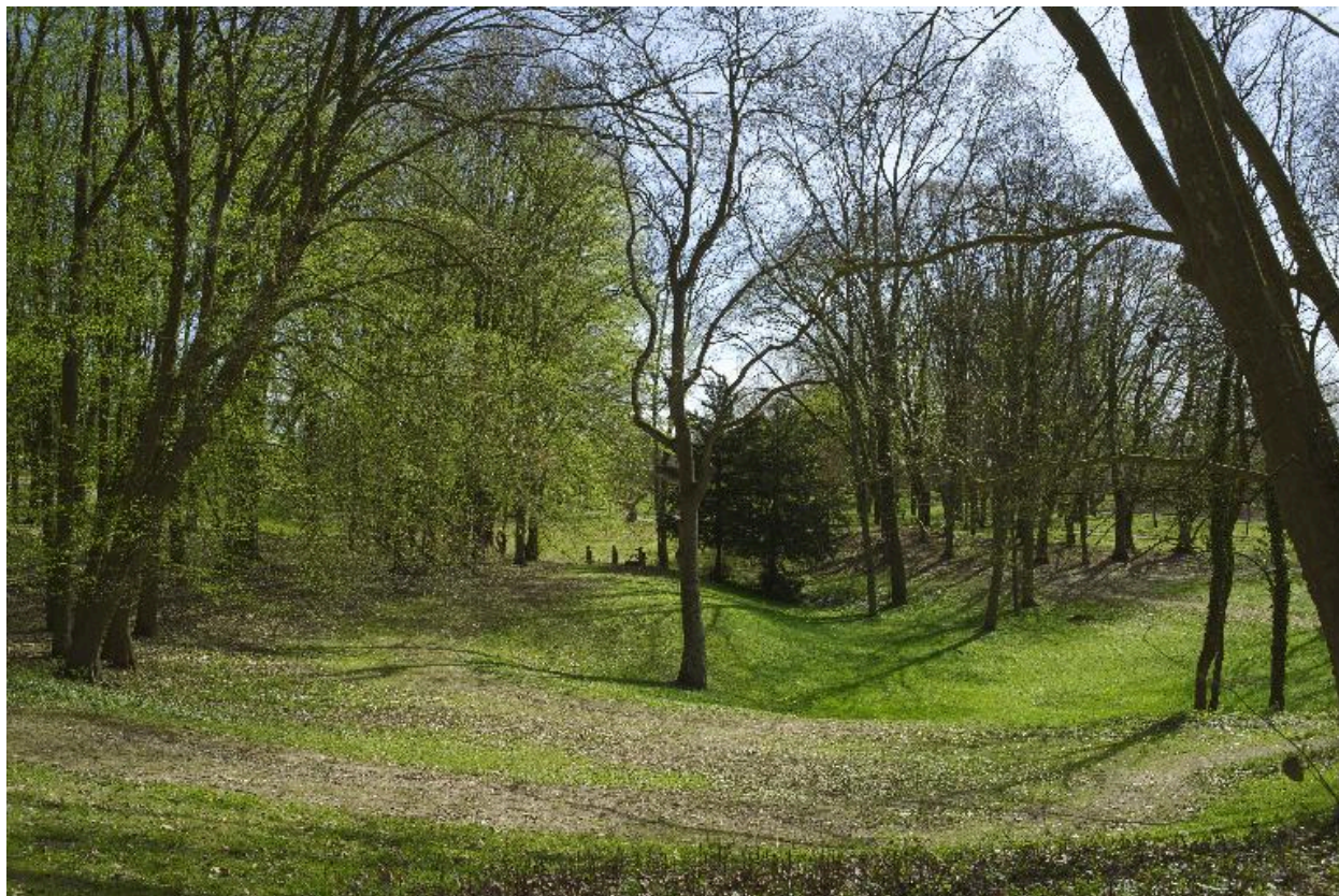
Une allée du parc.