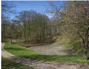
Le lac artificiel. IVR32_20170200166NUC2A

Les Buttes-Chaumont près du kiosque, carte postale, vers 1930 (coll. part.). IVR32_20170205061NUCA