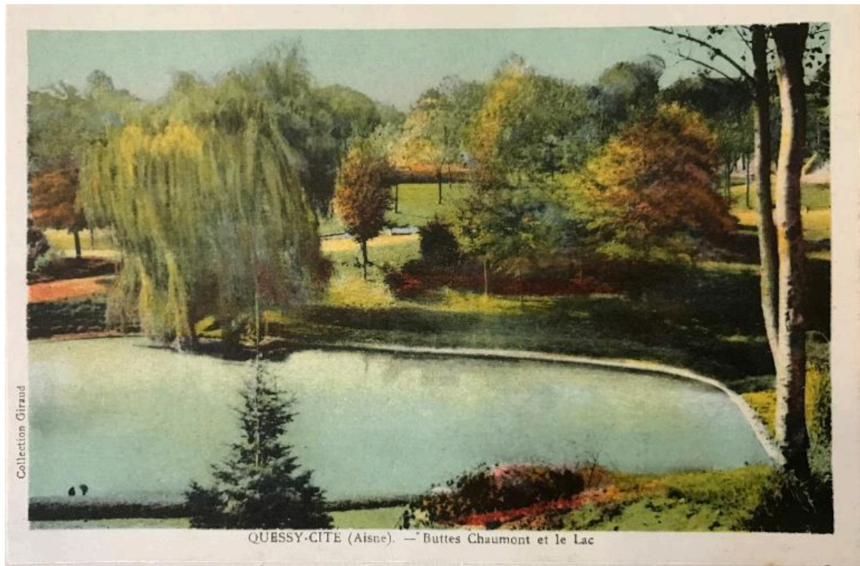
Le parc des Buttes-Chaumont et le lac artificiel, carte postale, vers 1930 (coll. part.).